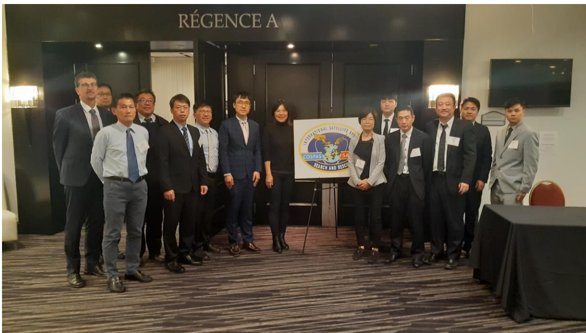
西北太平洋區域成員國團體合照 (日本、台灣、南韓)