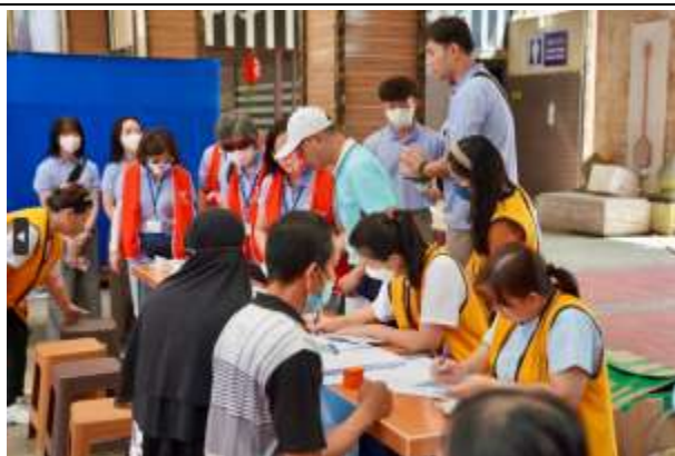
金剛山志工協助病人基本資料病歷填寫