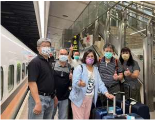
團員於左營高鐵站候車，前往桃園高鐵站