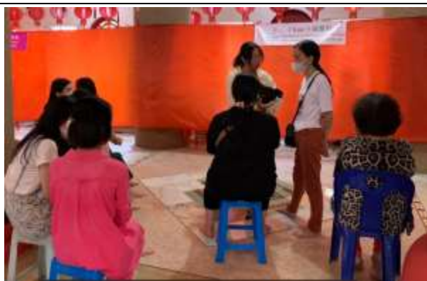
眾多女性民眾等候婦產科看診