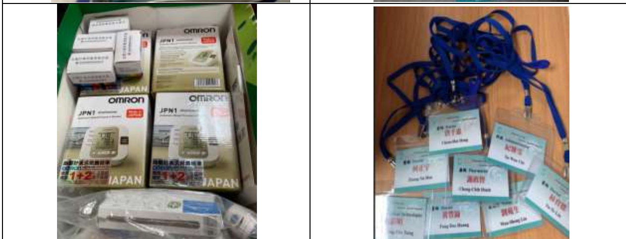
出發前各項物資與行政作業