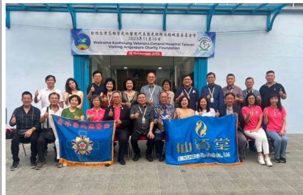
高雄榮總與印尼棉蘭鵝城慈善基金會合影