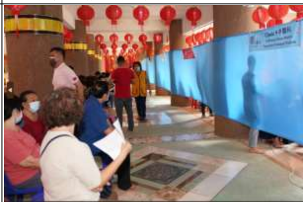
診間外等候看診民眾