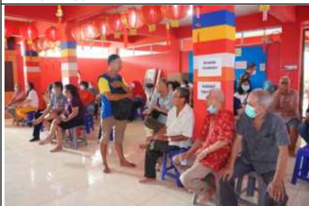
本願寺裡等候檢傷之民眾