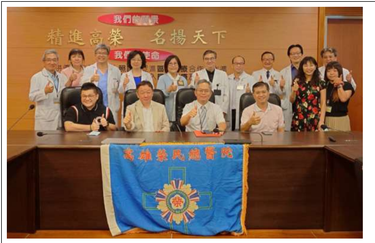
印尼行動醫療團行前說明會，團員合照