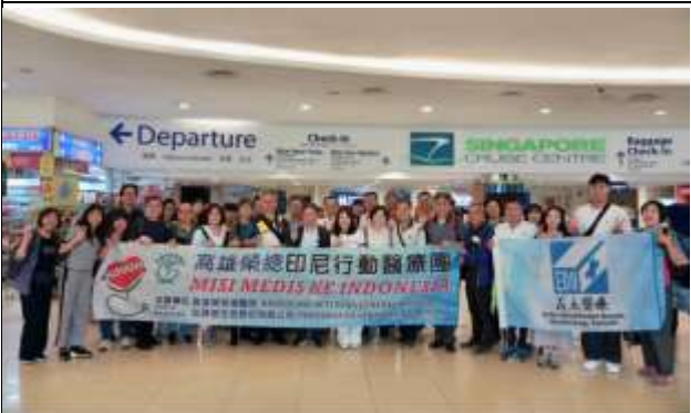
抵達新加坡度輪船站，準備搭船前往印尼