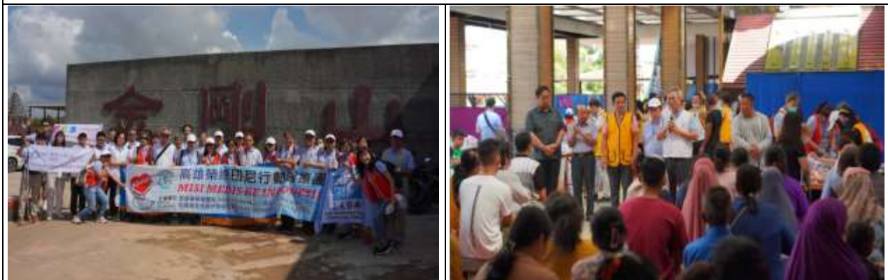
印診民丹島第一天，地點金剛山