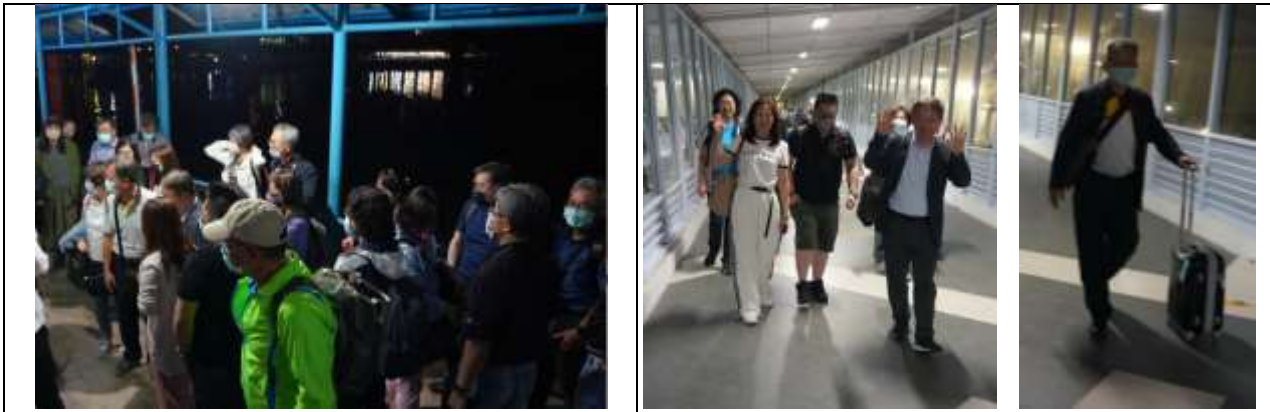
印尼行動醫療團終於晚間 19:00 抵達印尼度輪船站