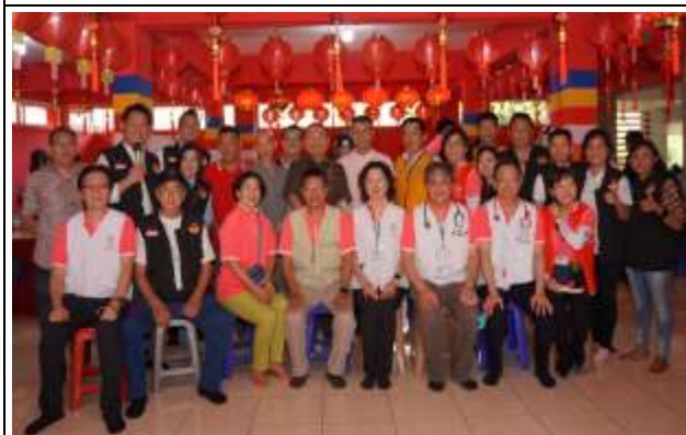
開診前，與當地議員和本願寺志工合影