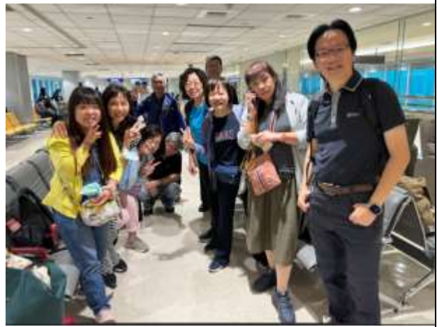
團員於桃園機場候機室等候