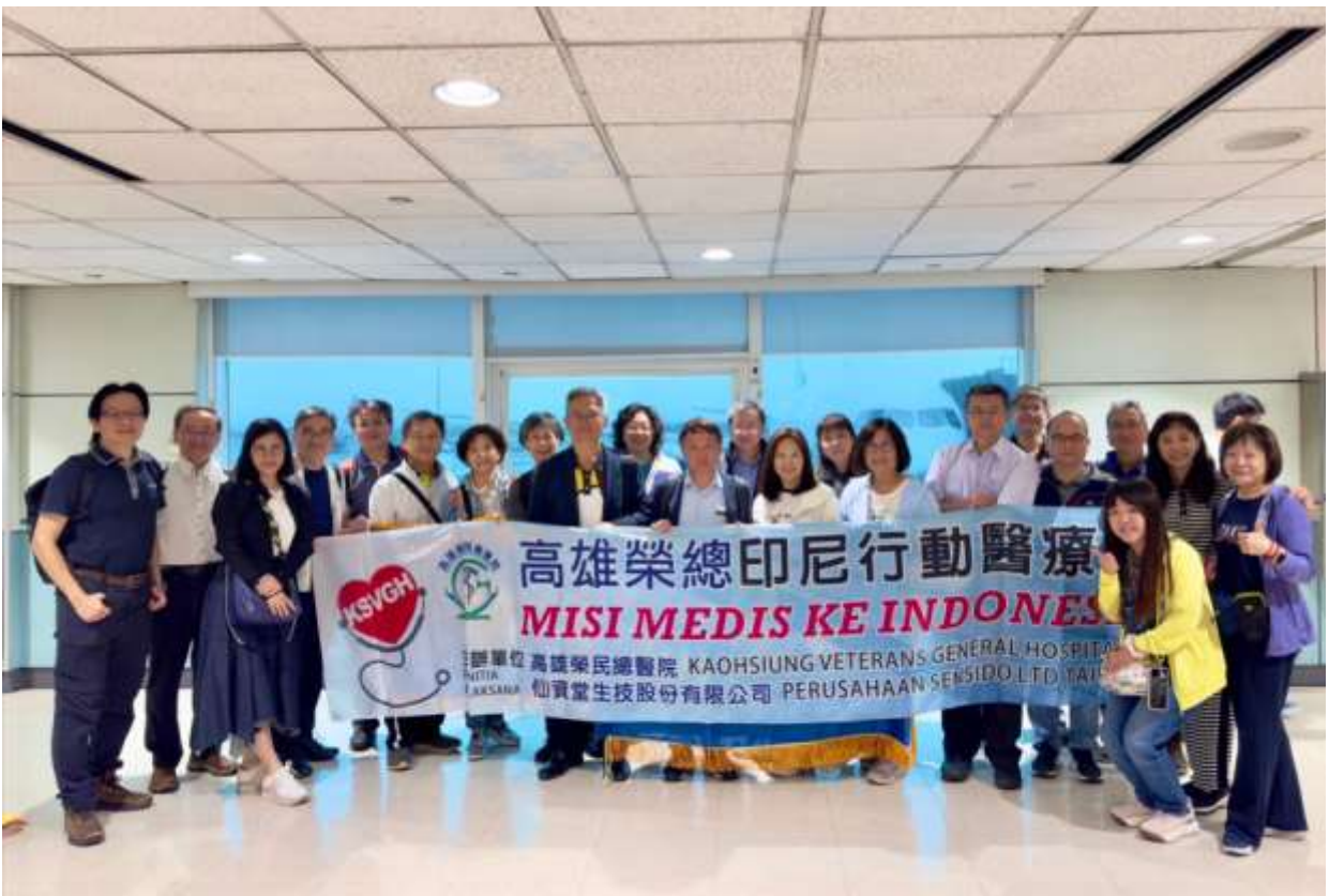
印尼行動醫療團準備啟程，出發前於桃園機場合照