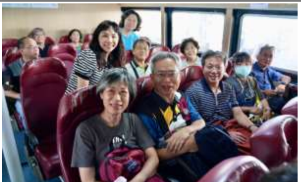
搭船前往印尼民丹島