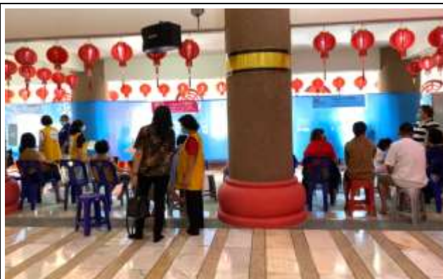
眾多民眾等候中醫看診