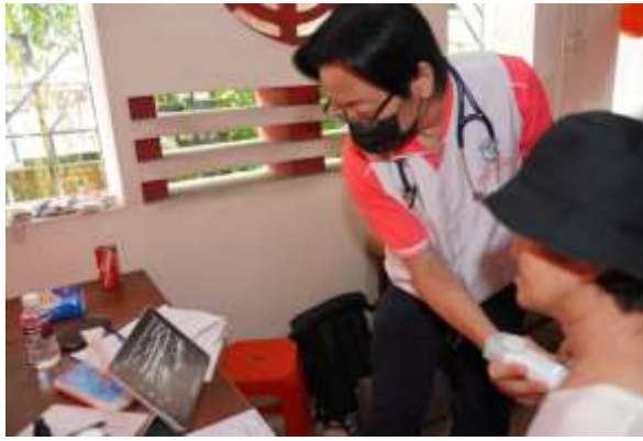
復健部何醫師為民眾執行軟組織超音波檢 查