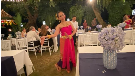
說明：大會安排之泰國民族舞舞蹈表演，舞者穿梭於席位之間。

晚宴場地安排在一處緊鄰泳池的戶外庭園，採自助餐形式供餐，俾利與會品牌及各國出席執法人員能自由交流。晚宴期間，大會另精心安排三段突顯泰國民族特色的舞蹈表演，表演人員時而穿梭於席位之間，時而自旁邊的泳池中翩然出現，為大會成員們的第一次見面，建立了相當熱絡的氣氛。