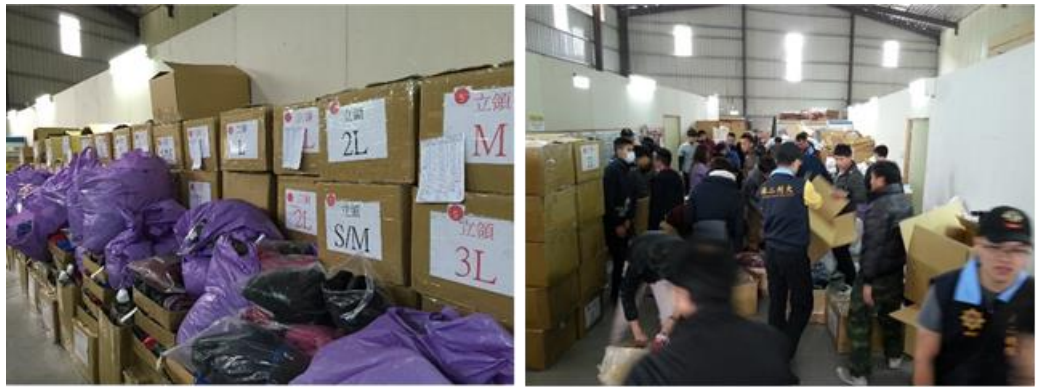
說明：保二刑大偵一隊查獲仿冒知名商標羽絨衣的倉儲，應查扣之仿冒羽絨衣堆滿搜索現場，該案實際清點的查扣數量為 187 箱。

此類案件因為查扣物品數量龐大，即使偵辦終結移送地檢署，地檢署也經常因為贓物庫或大型贓物庫空間不足而無法接收，須俟贓物庫空間足夠時始能入庫。因此存放查扣仿冒品的空間問題，始終是一項空間成本高昂且無解的難題。