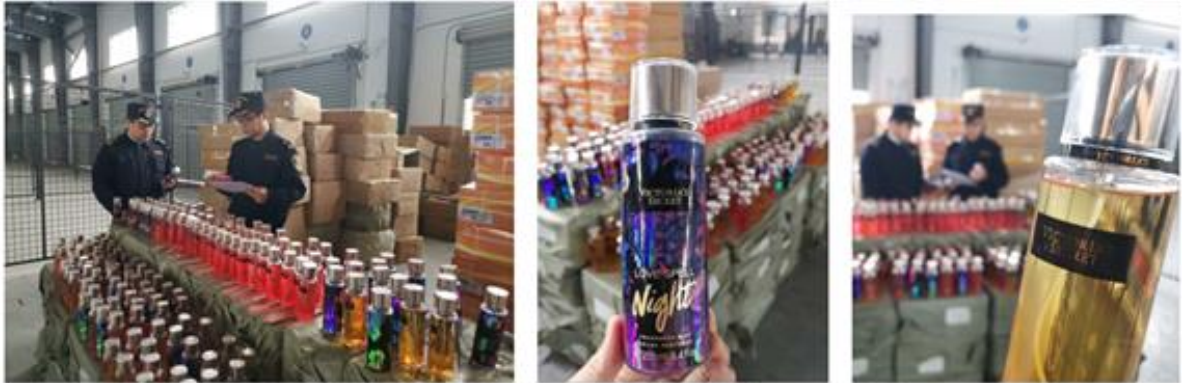
說明：中國海關查獲 VICTORIA' S SECRET 的化妝品及香水。

依據中國海關 2022 年的統計，中國海關於該年度採取智慧財產權保護行動達 6.46 萬次，查獲侵權物品 6 萬餘案，扣押侵權商品超過 7,793 萬件。