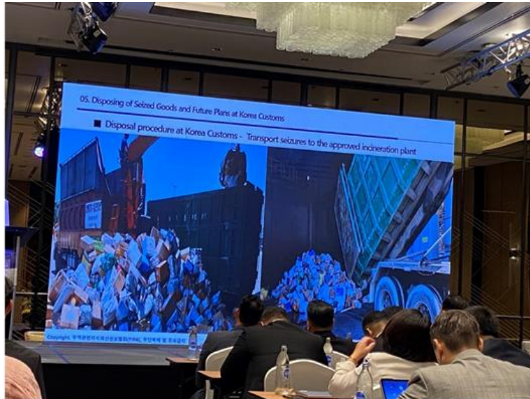
說明：KCS 銷毀查扣仿冒品的照片。

零件後回收再利用，TIPA 正在向世界各國海關募集相關意見及案例，期待於 2024 年可以試運行。