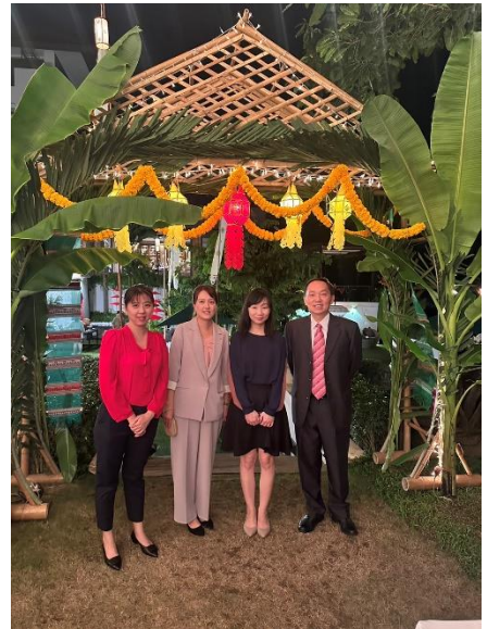
說明：臺灣本次參加的執法人員合影。