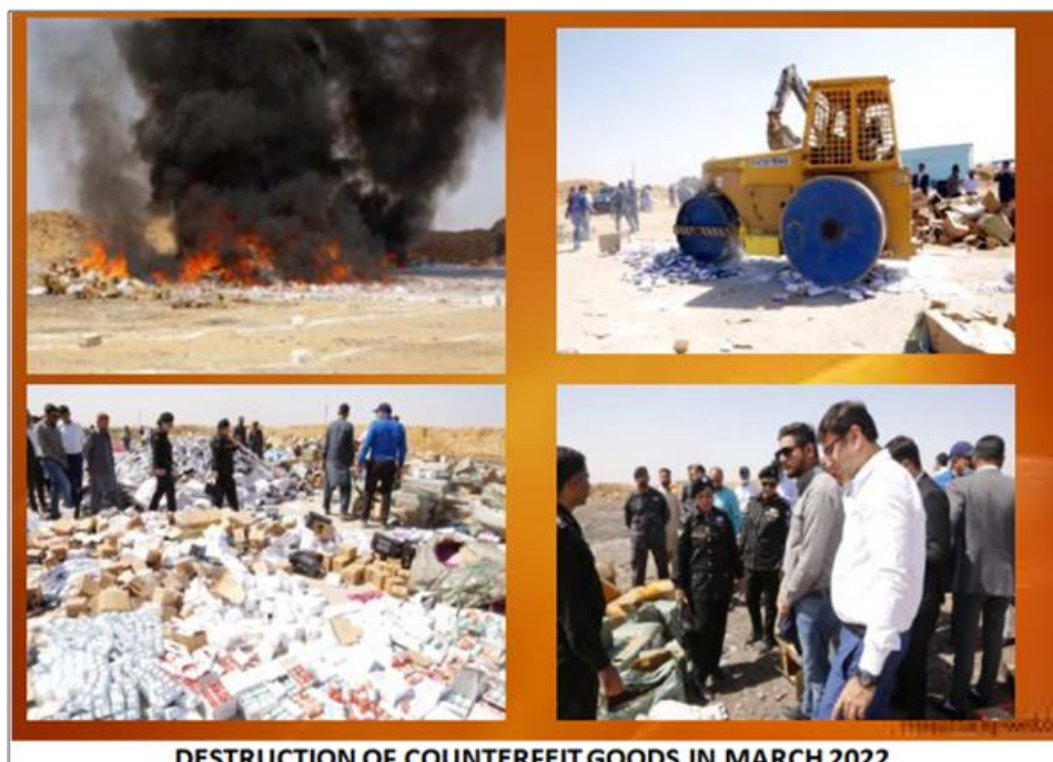
說明：巴基斯坦海關於 2022 年銷毀仿冒查扣物之照片。