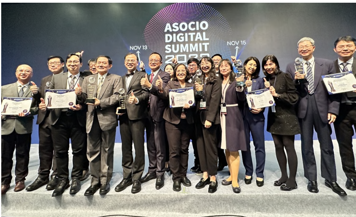
圖 6 臺灣獲獎者合影