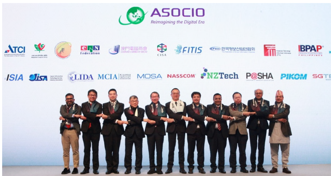
圖 3 各國與會成員代表數位亞洲倡議剪影