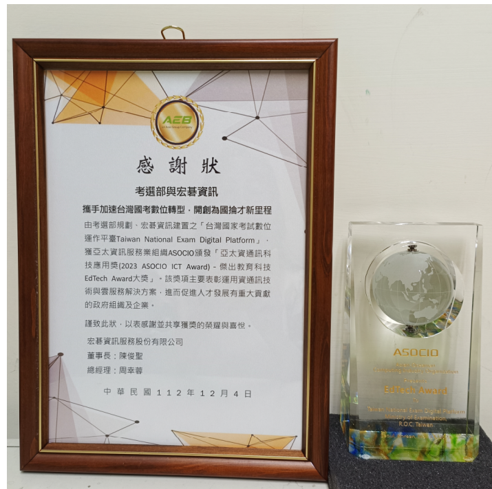
圖 9 宏碁資服致贈感謝狀