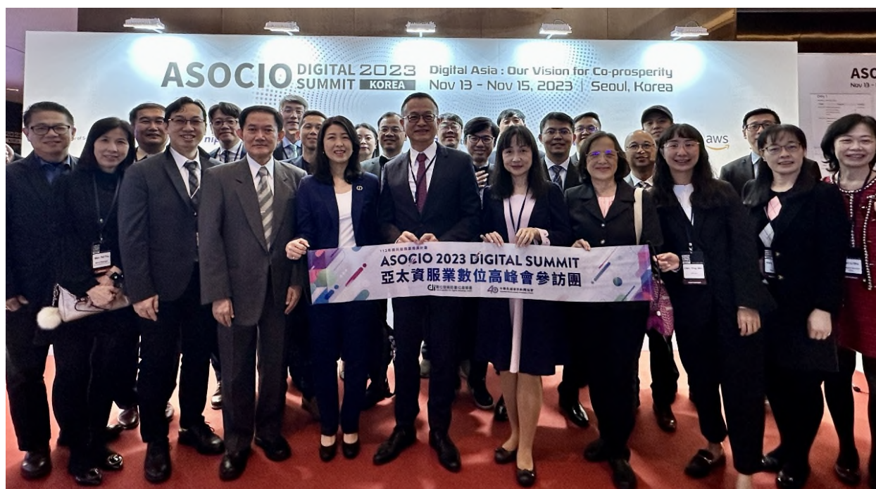
圖 4 數位高峰會臺灣參訪團剪影

依據韓國主辦單位韓國資訊產業聯合會(Federation of Korean Information Industries, FKII)統計本次會議計有220名國內外IT專業人士參加，我國以臺灣軟協為窗口，規劃亞太資服業數位高峰會參訪團，帶領國內獲獎單位及資服產業人員與會(詳圖4數位高峰會臺灣參訪團剪影)。