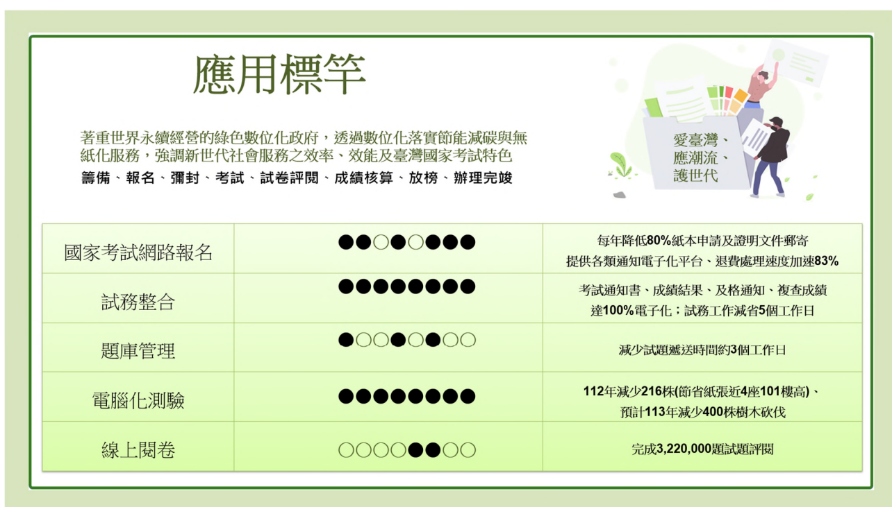
圖 2 臺灣國家考試數位運作平台實績表現

(4) 線上閱卷平均完成一份閱卷時間所提升效率約 50%，迄今完成 4,980,000 張試卷掃描、服務 3,200 人次閱卷委員，完成 3,220,000 題試題評閱。