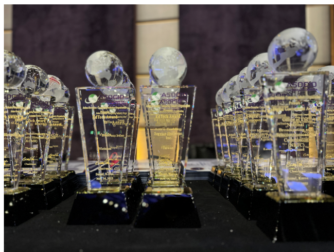
圖 7 考選部獲獎剪影