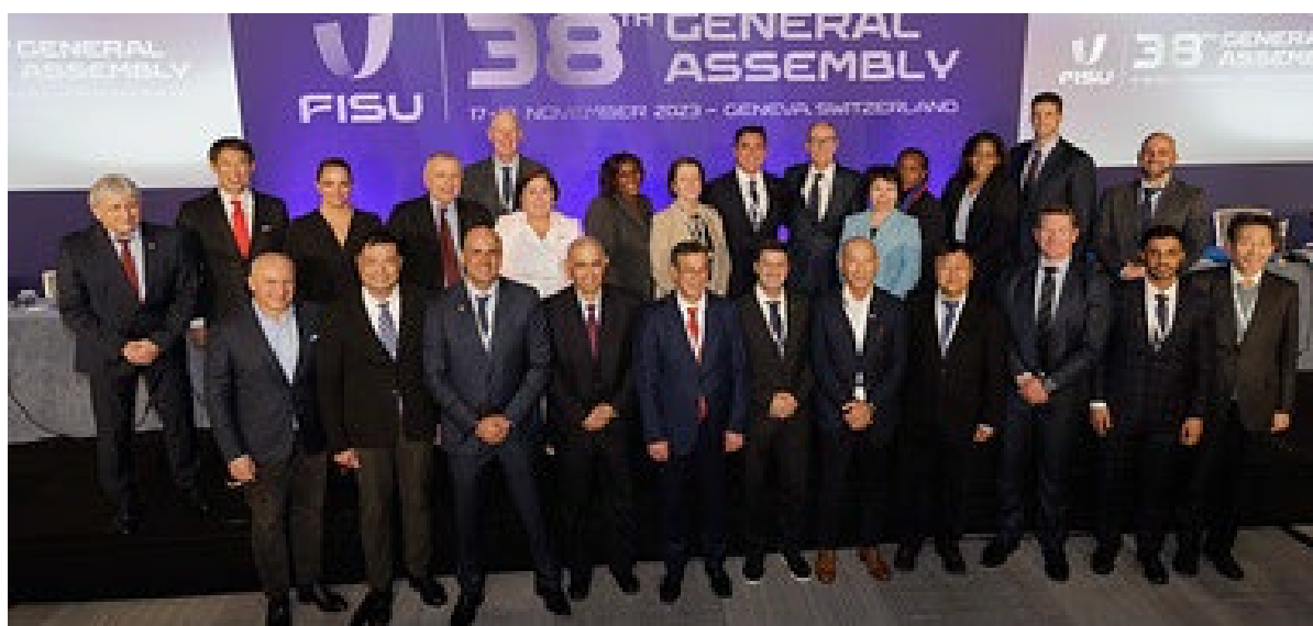
新任 FISU 執委會成員合影