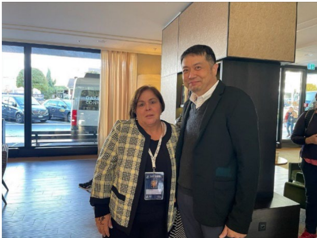
向哥斯大黎加代表拜票