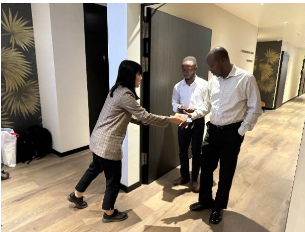
本團同仁於11月18日早餐時間發送文宣小物（二）