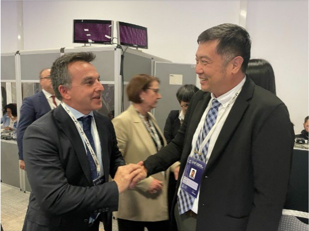
向西班牙代表拜票