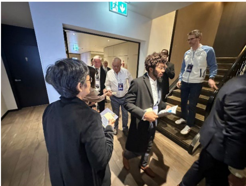
本團同仁於11月18日早餐時間發送文宣小物（一）