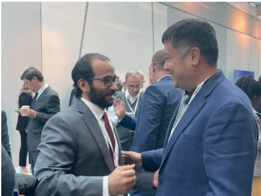
向沙烏地阿拉伯代表拜票