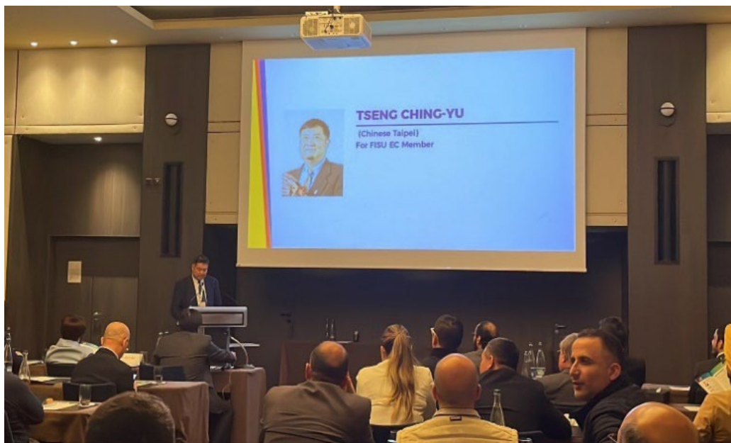
曾執行委員在亞洲會員大會上台發表