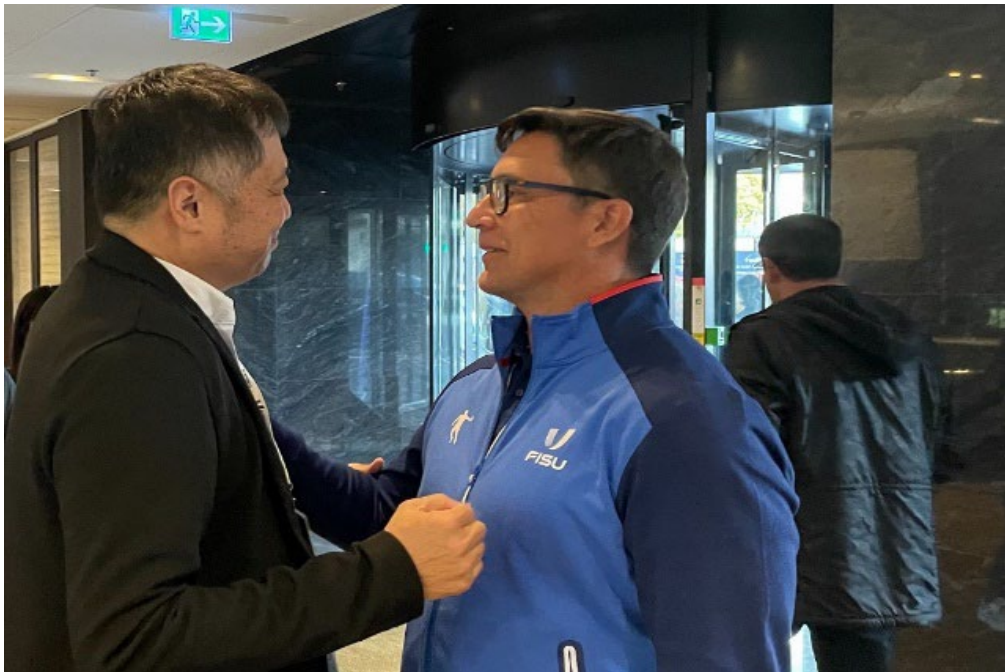
曾執行委員向巴西籍副會長拜票