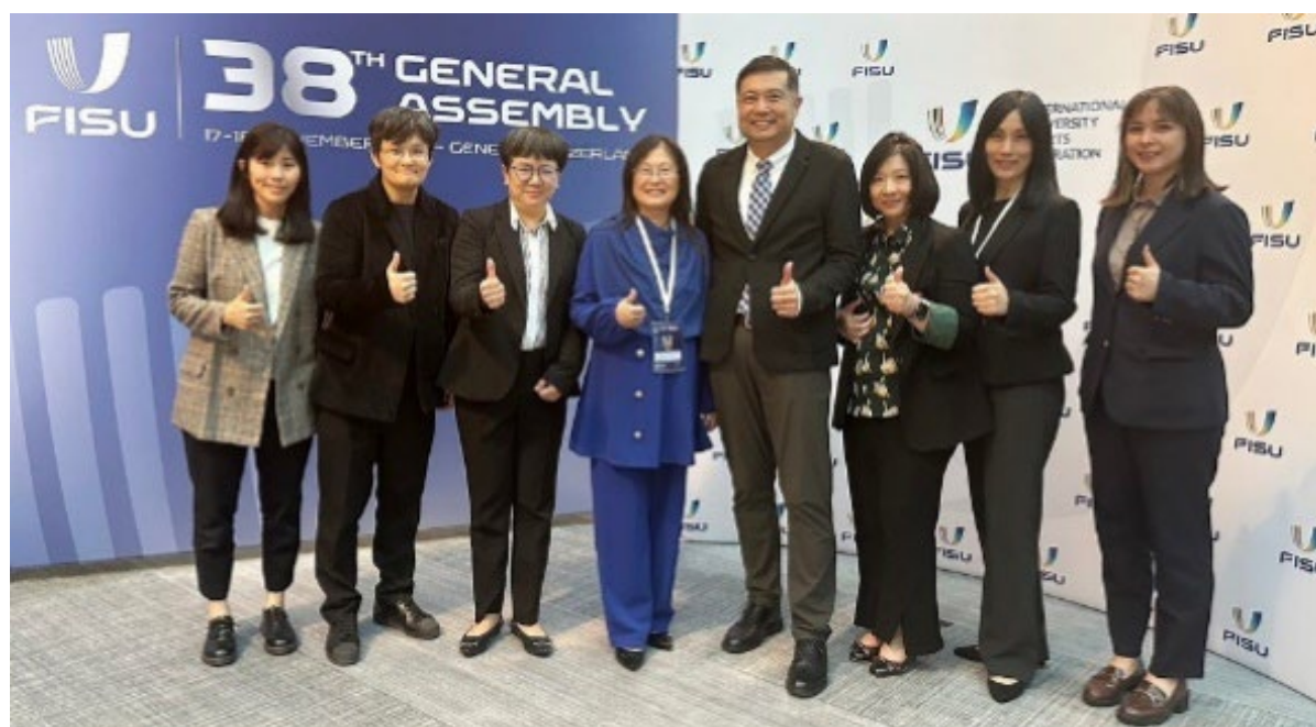
本團一行 8 人選後合影