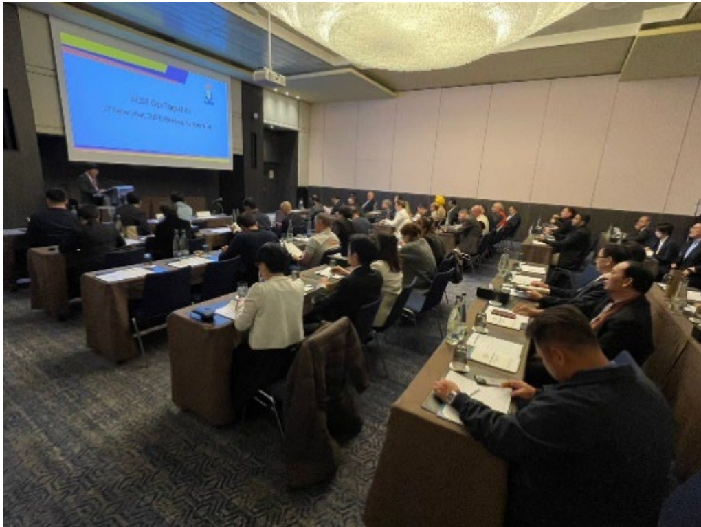
亞洲團結大會現場