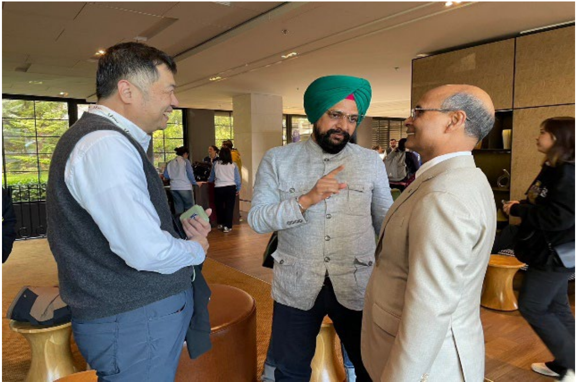
曾執行委員向印度、孟加拉會員代表拜票