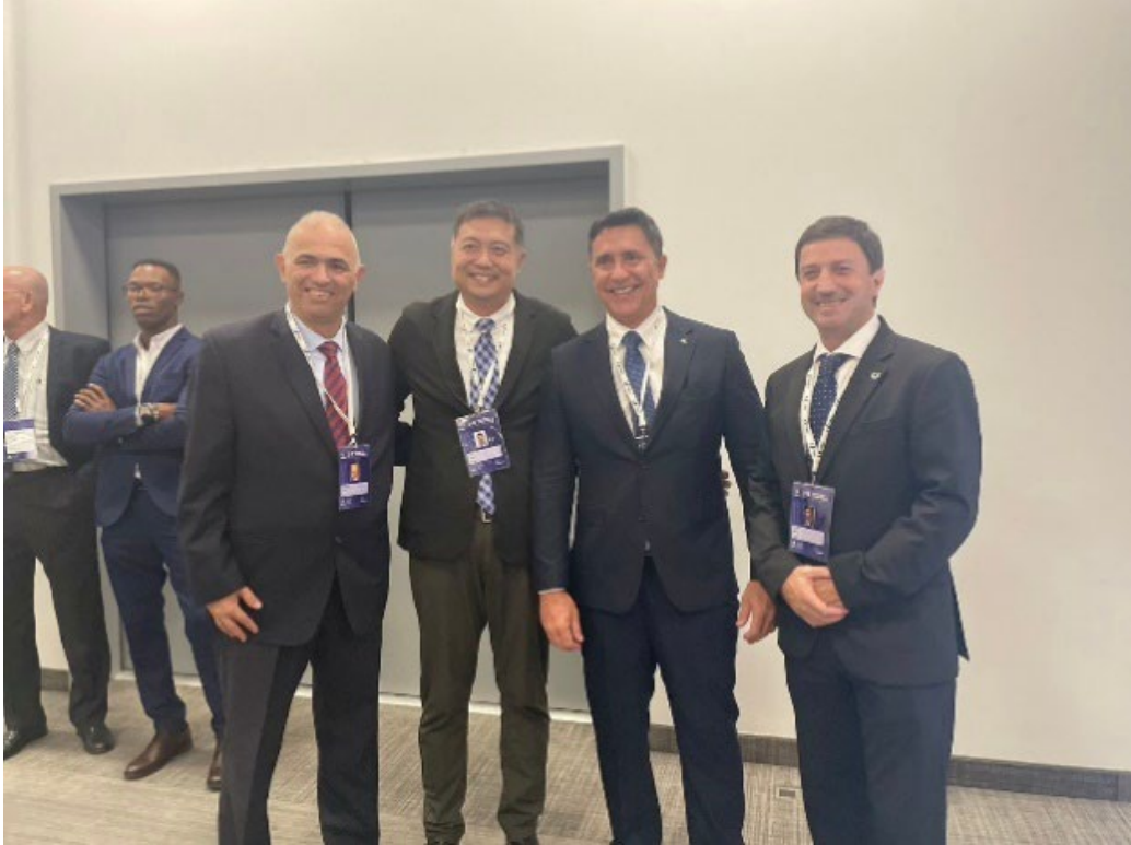
與黎巴嫩、巴西、葡萄牙代表合影