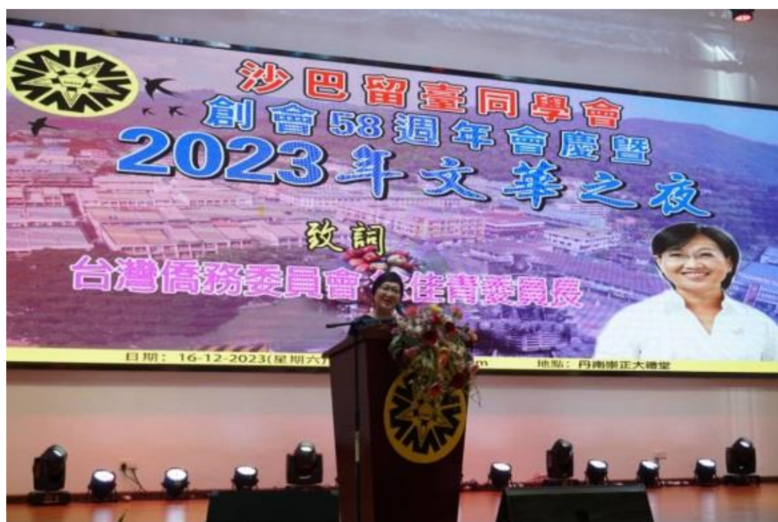
12月16日出席沙巴留臺同學會「創會58週年會慶暨2023文華之夜」致詞