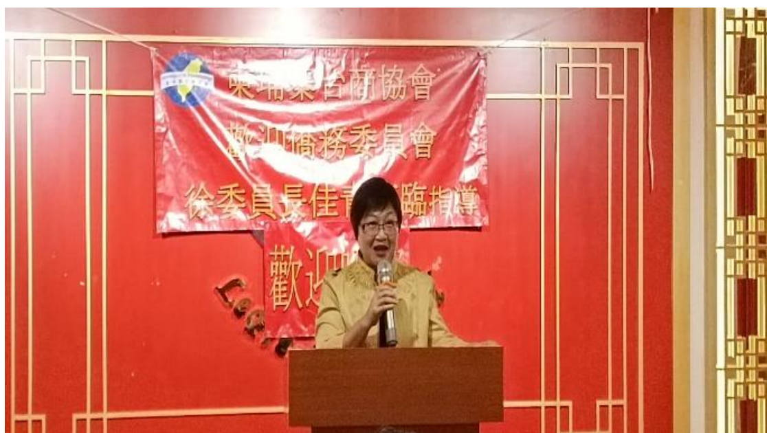
12月13日出席柬埔寨台商協會歡迎晚宴致詞