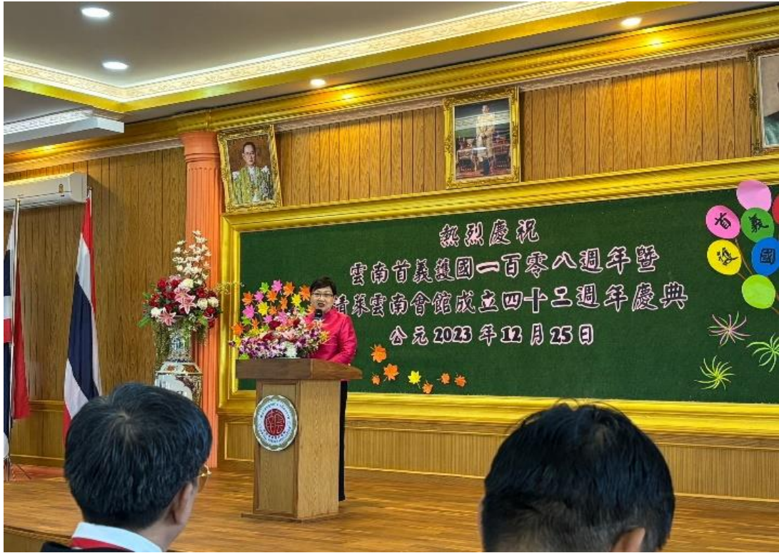
12月25日出席清萊雲南會館首義護國暨會長交接典禮致詞