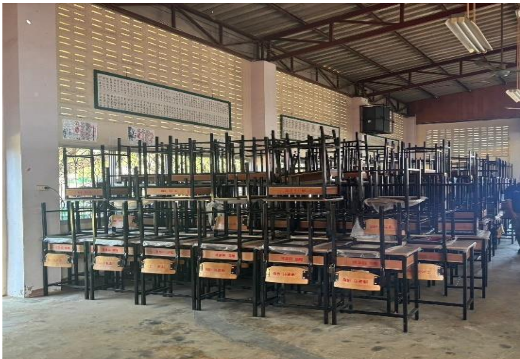
12月26日參加「臺灣心 泰國情，送課桌椅到泰北」清邁場活動