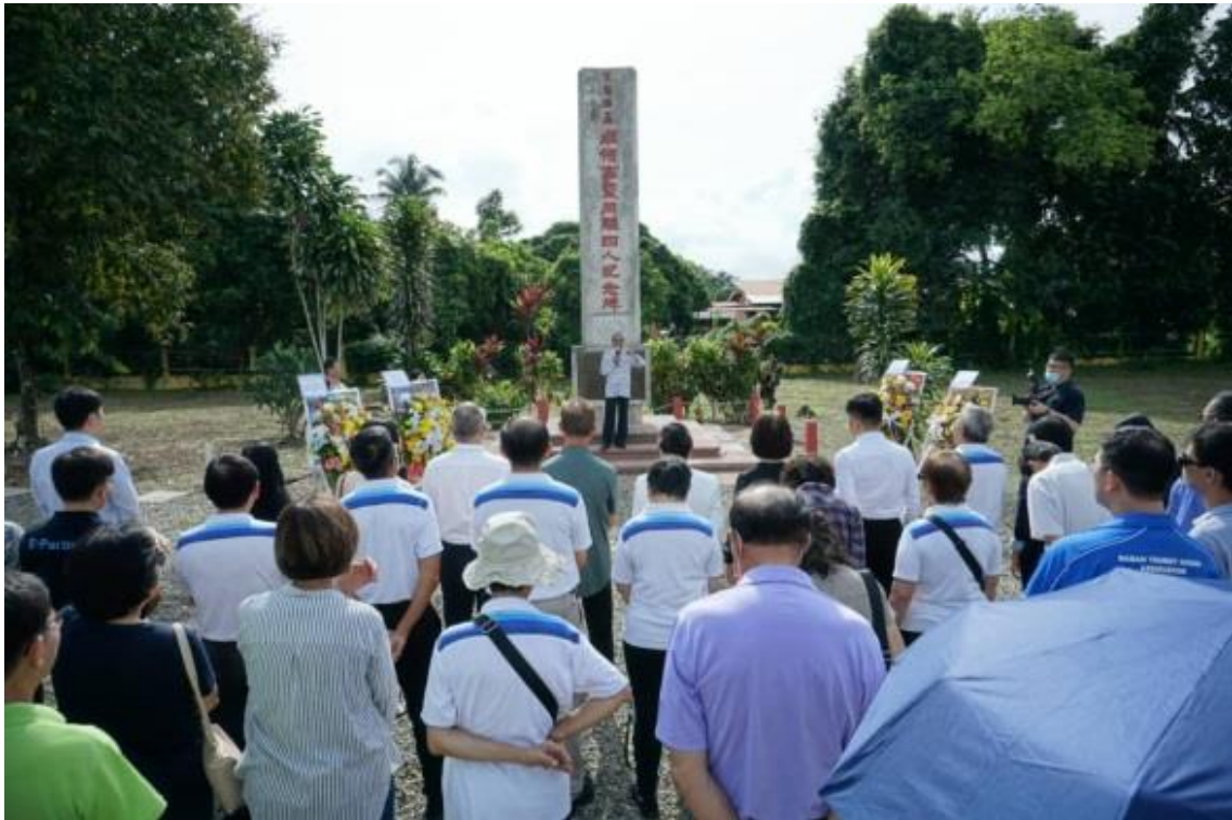
12月16日出席「卓還來領事暨二戰殉難英雄紀念碑公祭儀式」