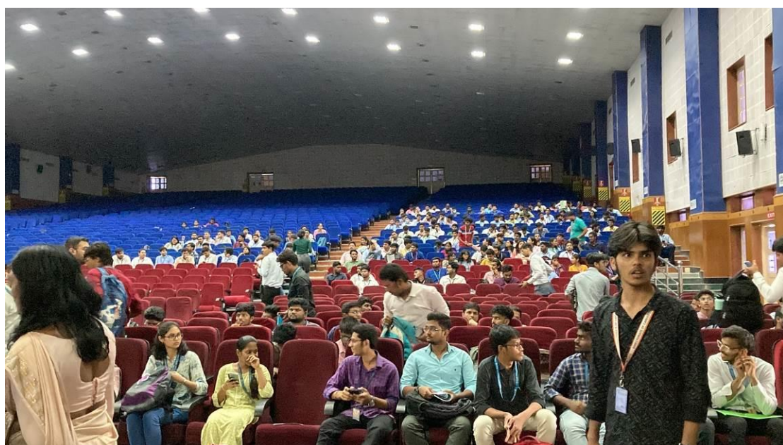
2023.10.12 SRM 校園徵才，共吸引超過 450 位人才至現場面談與投遞履歷