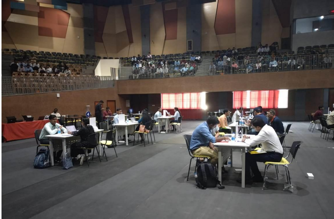
2023.10.11 VIT 校園徵才，吸引逾 4 百位學生到場面談，現場氣氛熱鬧非凡