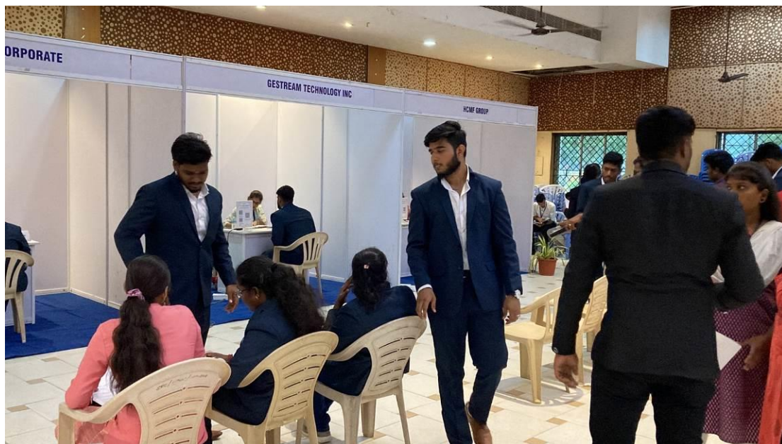
2023.10.13 SEC 校園徵才，為參加企業搭建專屬攤位，人才於攤位前方等候面談