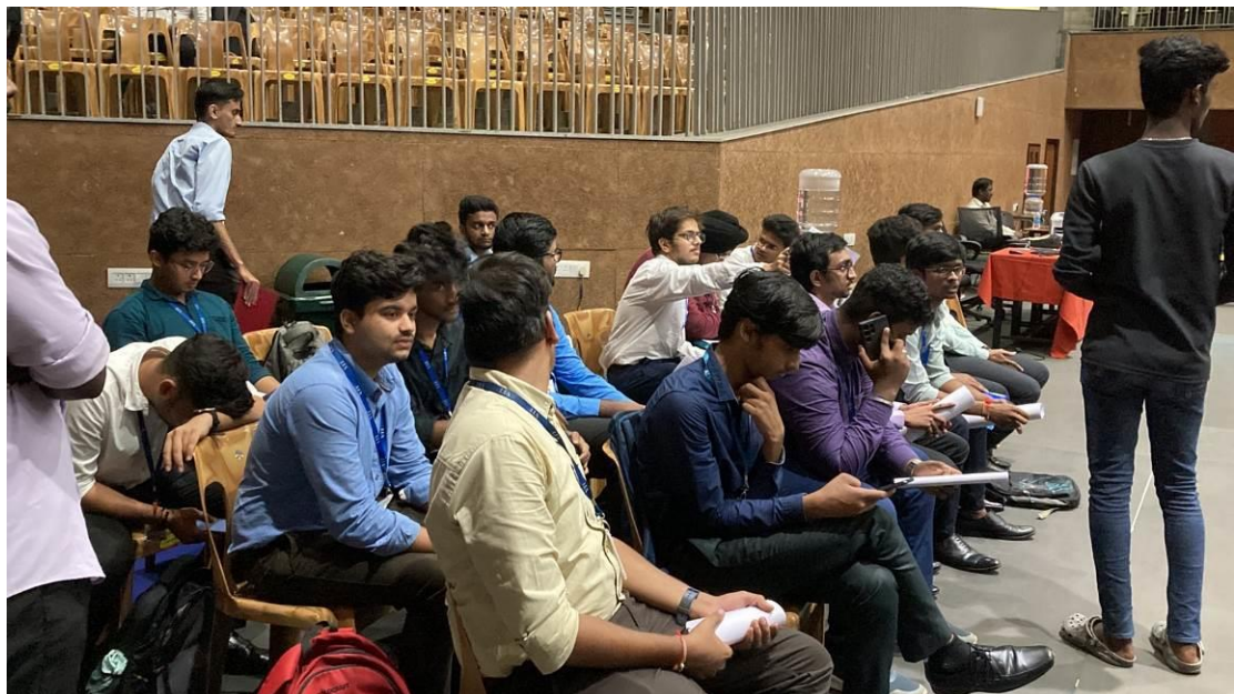
2023.10.11 VIT 校園徵才，人才於活動現場排隊等候面試盛況