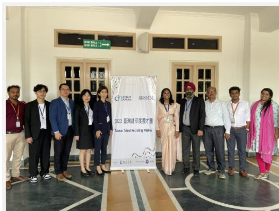
經濟部辦理2023印度攬才團。

(記者廖家寧 / 台北報導) 為延攬海外專業人才，經濟部委託外貿協會籌組「2023年印度攬才團」，與印度知名學府合作校園徵才活動，延攬148名技術、研發、資訊及軟體開發等理工人才為我企業所用。