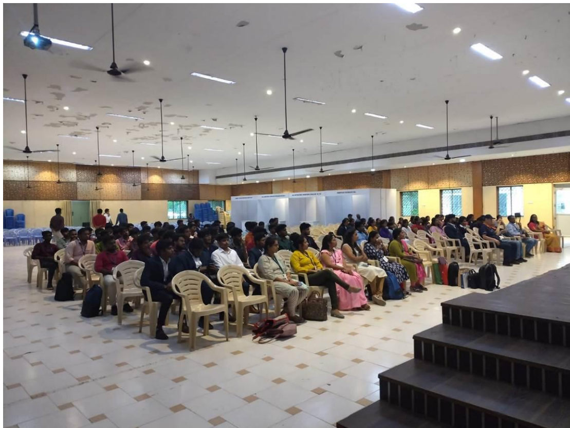
2023.10.13 SEC 校園徵才，企業說明會介紹職缺與徵才條件，台下座無虛席