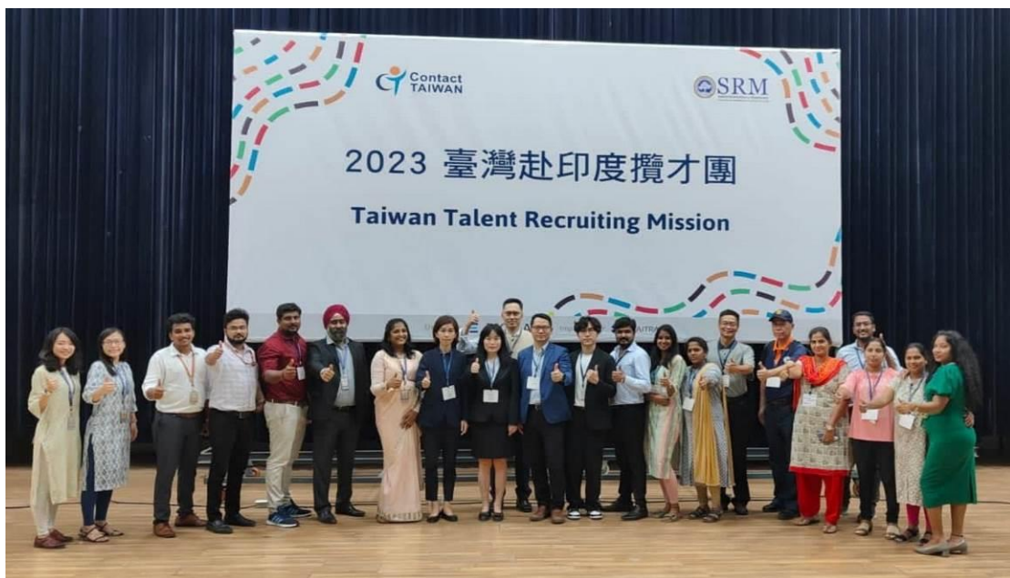
2023.10.12 SRM 校園徵才，與校方國際事務代表及工作人員合影