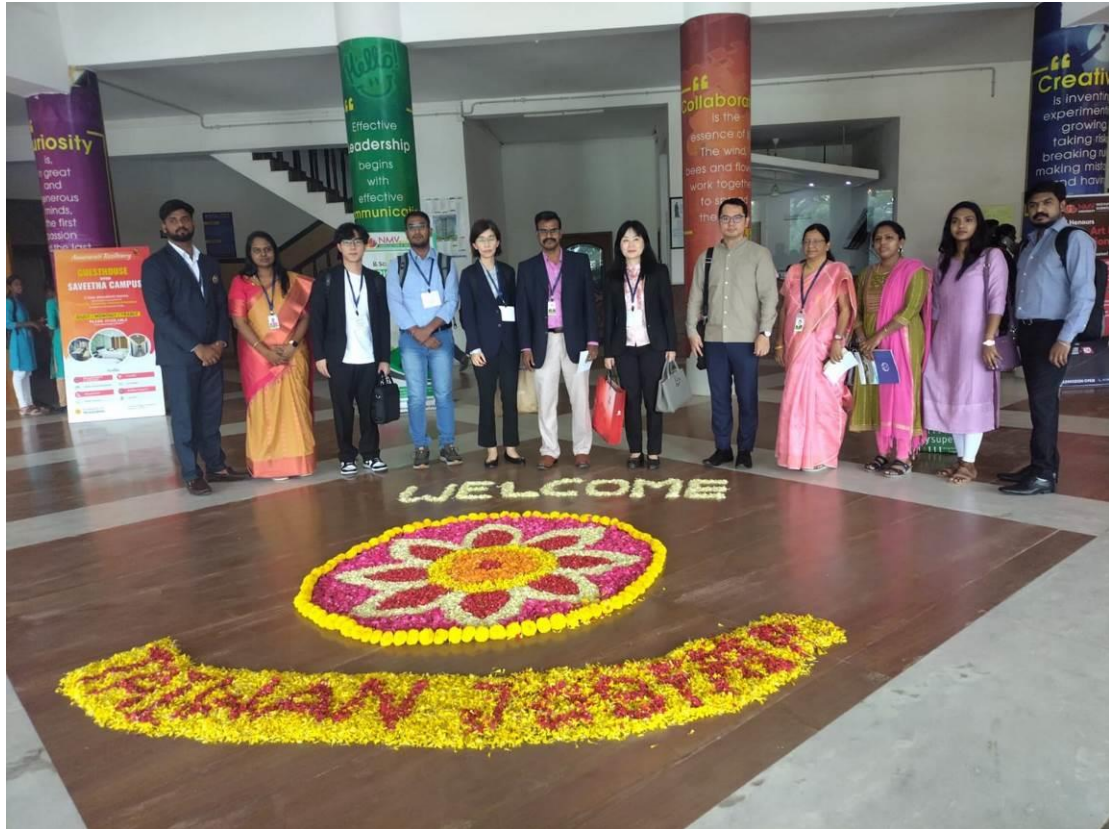
2023.10.13 SEC 校園徵才，活動前拜會校方代表受到熱烈歡迎，並分享企業求才注意事項與臺灣最新攬才政策