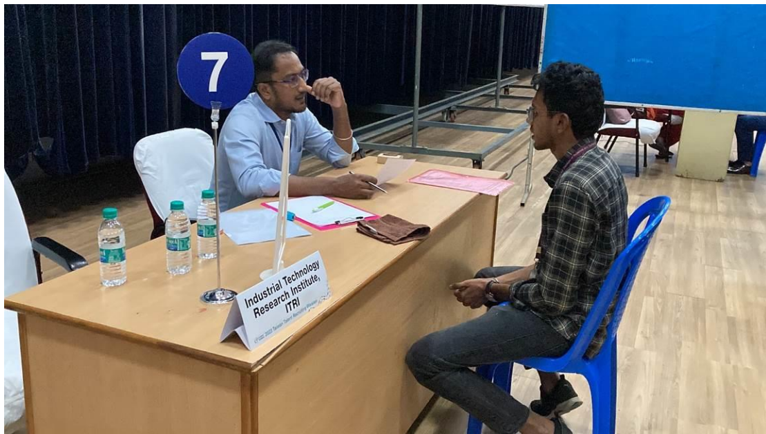
2023.10.12 SRM 校園徵才，學生與企業一對一媒合，積極展現自我