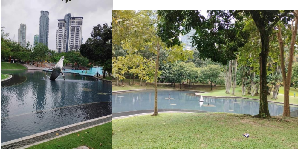
民眾於公園內休憩