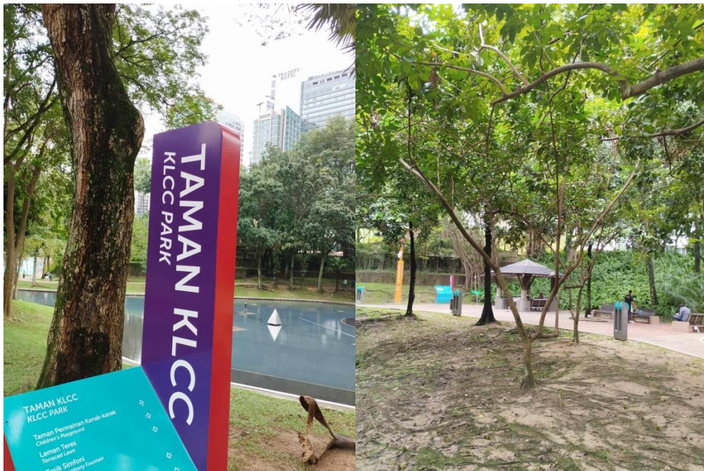
公園鄰近雙子星塔