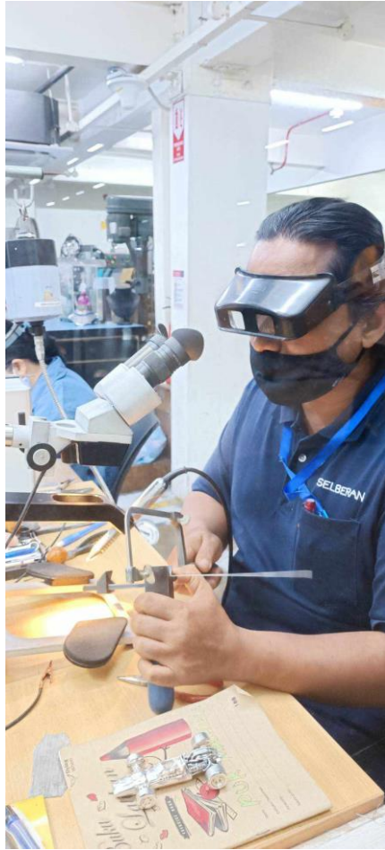
精美錫製品的切削殘塊殘絲皆重複溶蝕再製