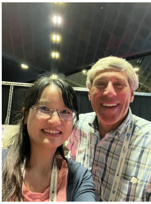
圖五、與來自國際知名洗髮精的研發部主管交流關於洗髮精成分對頭皮狀況的影響。

電子看板旁是休息區，有許多開放式的座位，我剛好跟來自知名去屑洗髮精的研發主管在同一桌，期間我們也討論了洗髮精對於頭皮屑甚至是脂漏性皮膚炎的治療效果和有效成分分析，以及不同廠牌的潤髮乳是否會影響到其有效物質的療效。（圖五）