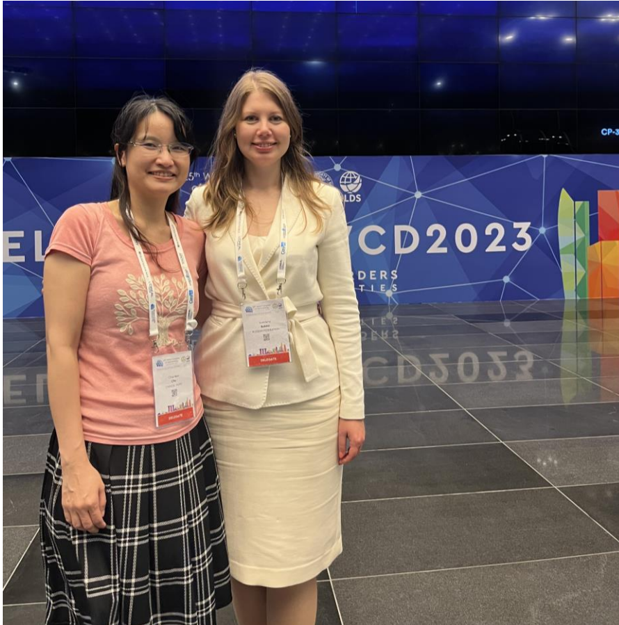
圖九，會議中與來自俄羅斯的醫師合照及研究分享

在會議中最美好的就是可以與來自不同國家的皮膚科醫師建立起友誼，圖八是在大會晚會所認識來自俄羅斯的皮膚科醫師，也把很多時間投入在皮膚科的基礎與臨床研究中，希望以後有機會可以有機會一起合作。