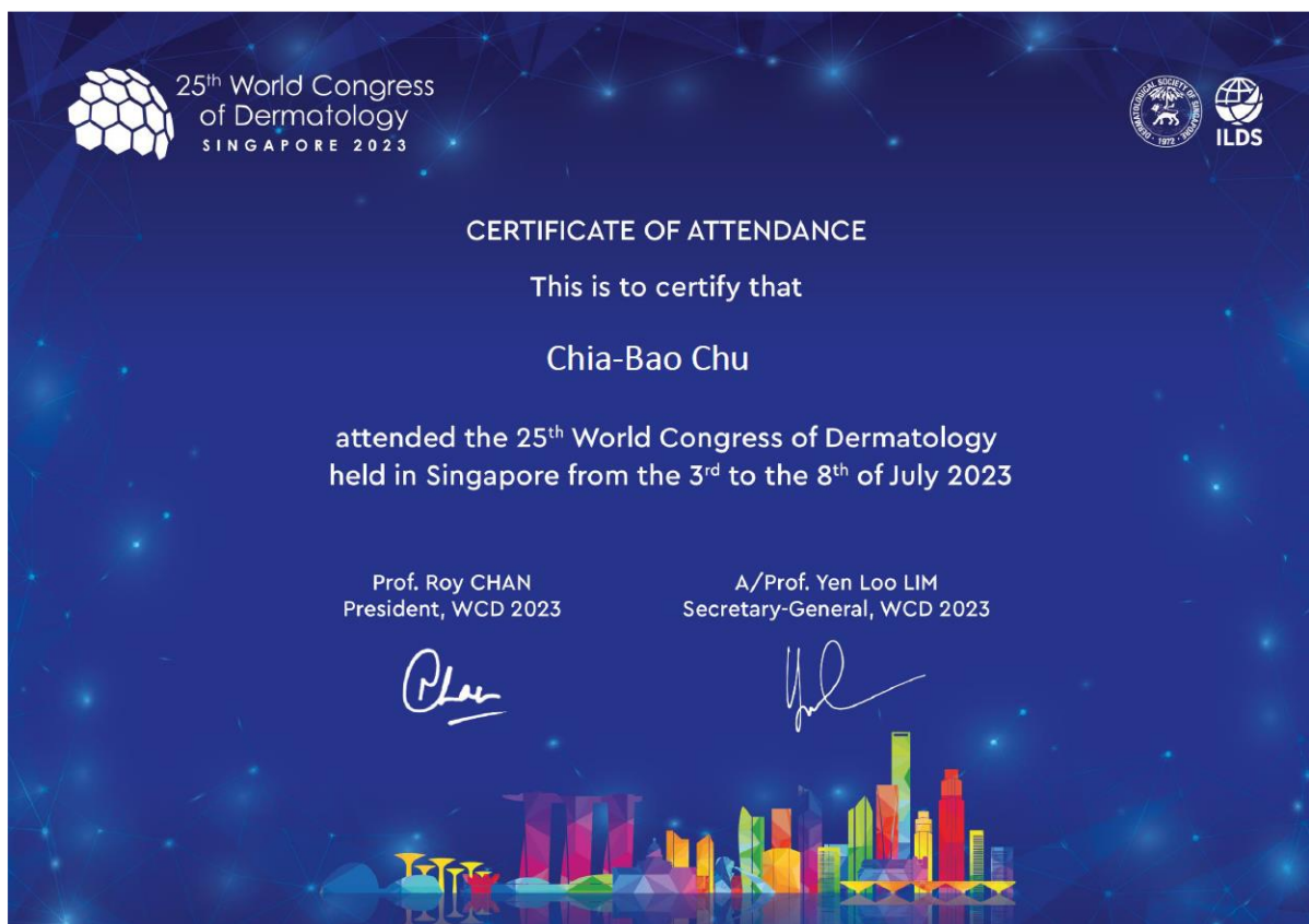
圖一、WCD 會議的參加證明。