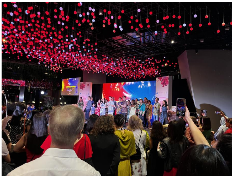
圖七、世界皮膚科醫學大會的晚會，可以遇到來自不同大洲的各國皮膚科醫師。

會議的倒數第二天晚上在濱海灣花園 Garden by the bay 舉辦雞尾酒晚會，主辦單位新加坡的皮膚科醫學會帶來許多表演，最後一個表演是大合唱，台上有許多皮膚科醫師穿著新加坡當地的服飾一起表演(圖七)。晚會有大會還有提供燈光音樂秀和無人機的表演(圖八)。