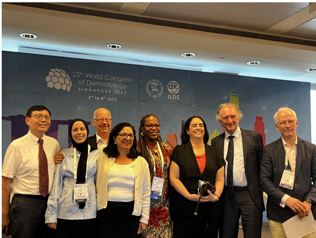
圖三、來自世界各地的化膿性汗腺炎專家齊聚一堂，分享從轉譯醫學、機轉、流行病學、診斷及臨床處理。其中一個演講者分享他們目前組織全世界超過二十個國家，將化膿性汗腺炎患者的臨床資訊和生物檢體來建議一個全球資料庫，會議中也說明了目前最新的整理和發現，將會讓此疾病的病因和治療有更進一步突破。

在化膿性汗腺炎的相關演講中，可以看到來自每過、英國、德國等等國家的化膿性汗腺炎專家(圖三)匯聚一起討論，而從他們的討論中也可以學到很多新知，並且知道區域的差異。其中也有專長在皮膚外科處置的醫師在化膿性汗腺炎的討論中分享他治療經驗中覺得對化膿性汗腺炎很有效的開刀方式(Deroofing surgery)，在會議中也透過錄影撥放的方式來一步步跟大家說明細節還有合適的處置時機，以及治療後的成效。