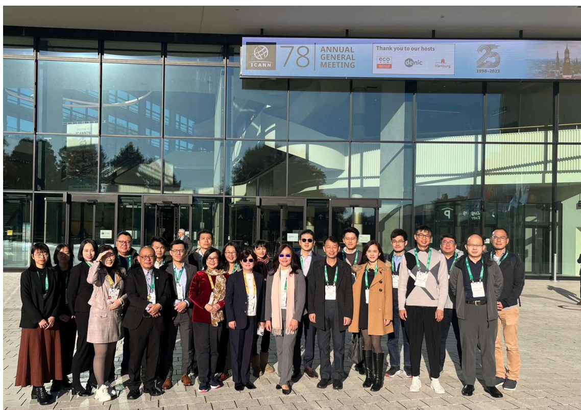
圖 3 我國代表團合影

我國內現亦面臨資通安全管理法修法階段，一面藉著參考國際制定的法規範本，一面藉著辦理國內各項說明會方式收集各方意見，以找出適合我國的合理性規範。