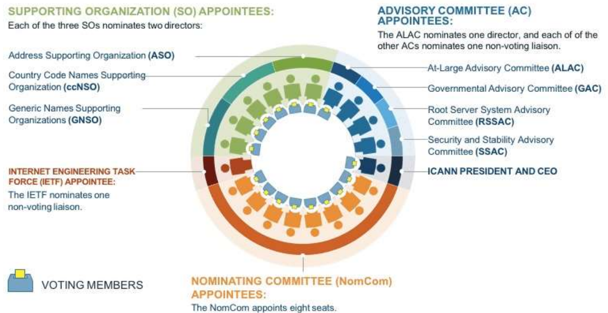
圖 1 ICANN 多方利害關係人參與架構圖

ICANN 多方利害關係人參與架構，可藉由 ICANN 董事會組成理解（如下圖 1）：