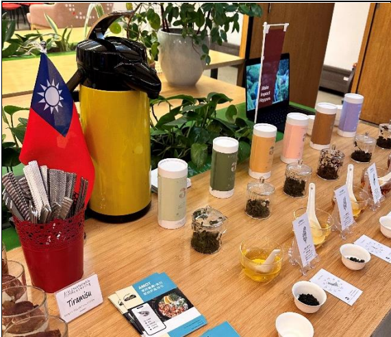
現場臺灣社創展示攤位