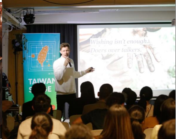
澳洲代表分享組織工作