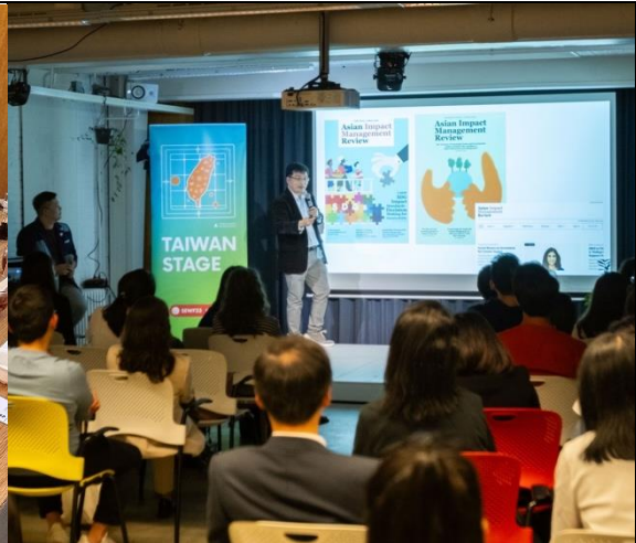
臺灣代表分享組織經驗