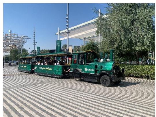
綠區的電動遊園車