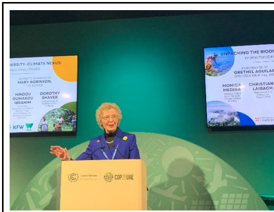
聯合國元老院主席、前愛爾蘭總統 Mary Robinson 演講