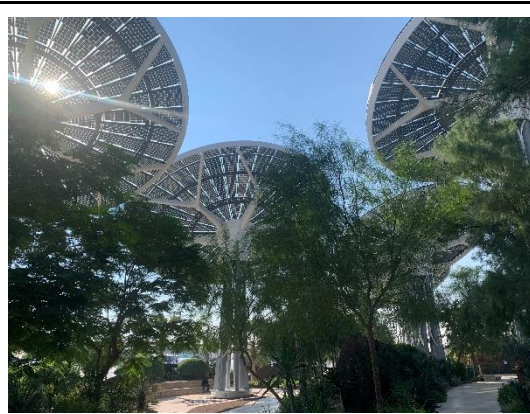
綠區永續館外圍以蘇庫特拉龍血樹造型為概念設計的太陽能收集裝置