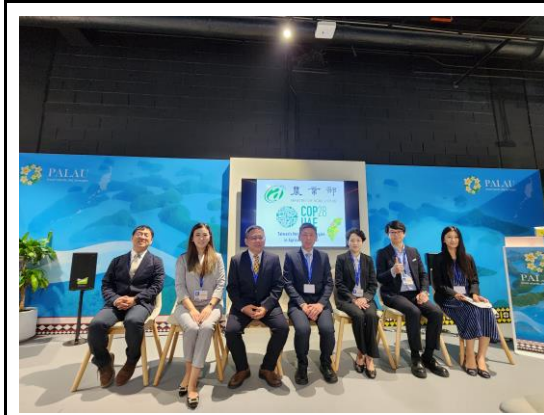
結合友邦國家帛琉展館辦理響應論壇與會人員合影