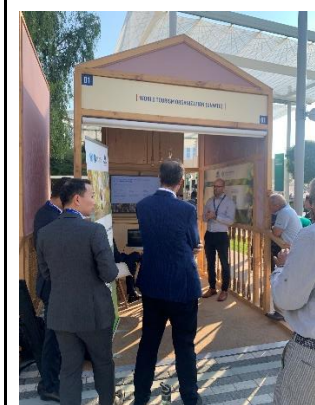
藍區世界旅遊組織 (UNWTO) 展位介紹以 AI 工具監測並協助改善食物浪費