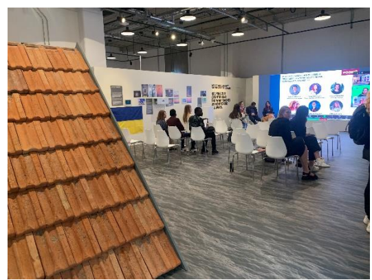
烏克蘭主題館的洪水意象