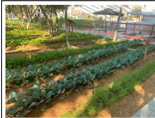
綠區的博覽城農場展示