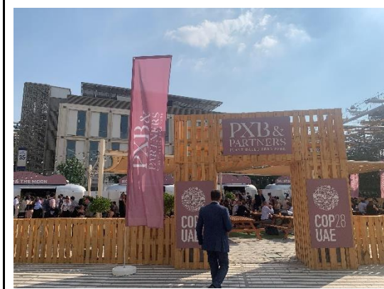
藍區會場內的素食園區 (plant based food park)