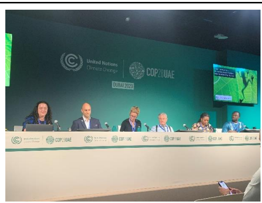
探討生物多樣性於韌性建構與賦予減緩氣候變遷影響的論壇