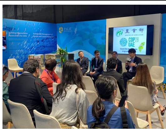
結合友邦國家帛琉展館辦理響應論壇引起國際與會聽眾熱烈迴響，交流討論成果豐碩