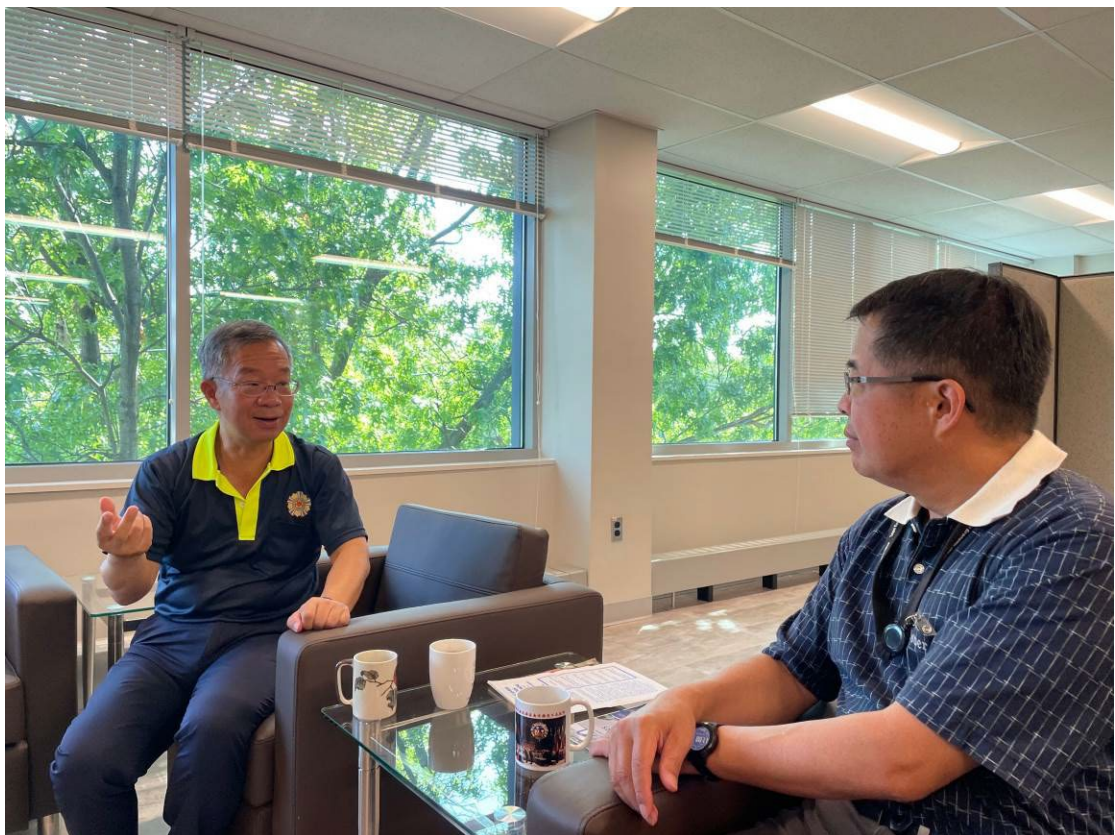
簡主任秘書（左）視導退輔會駐美榮光組