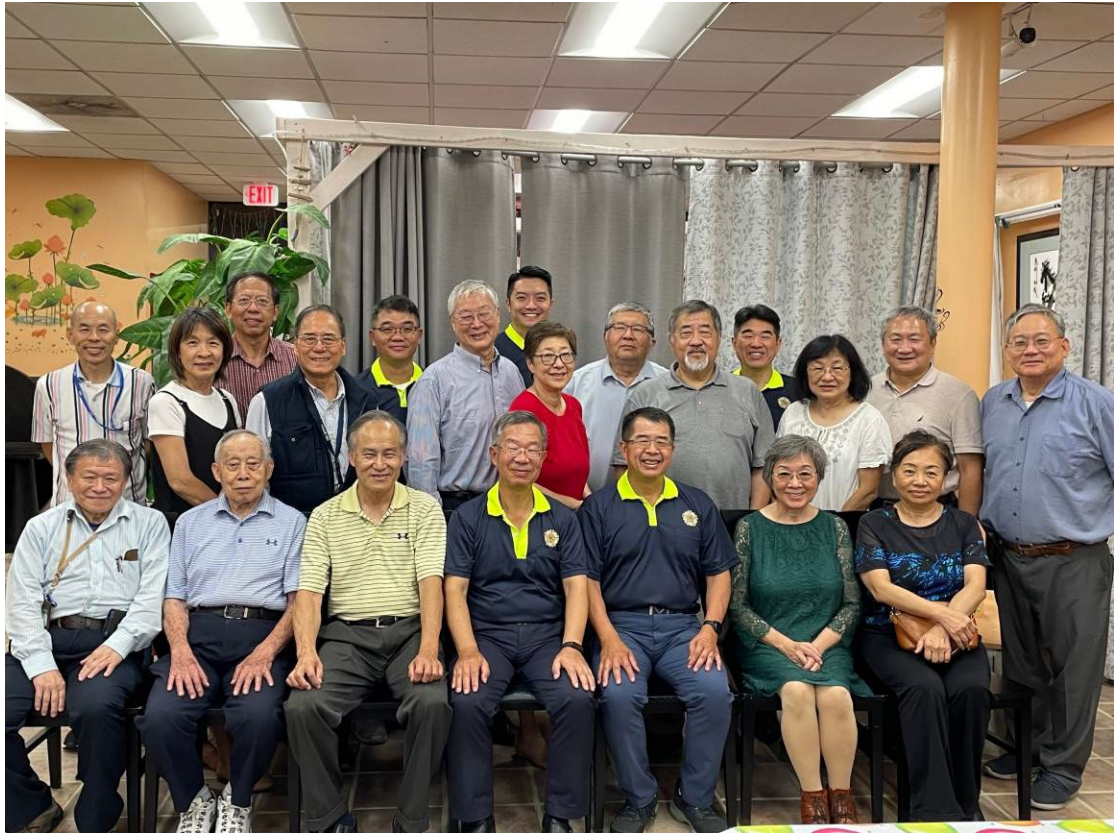
簡主任秘書（坐者左 4）訪視華府榮光聯誼會成員