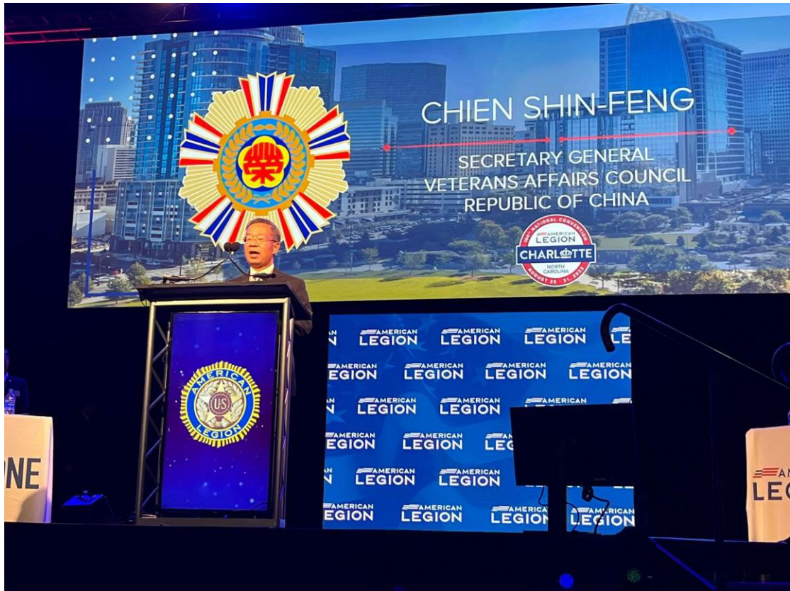
美國退伍軍團協會聯合開幕大會邀請簡主任秘書致詞（立者）