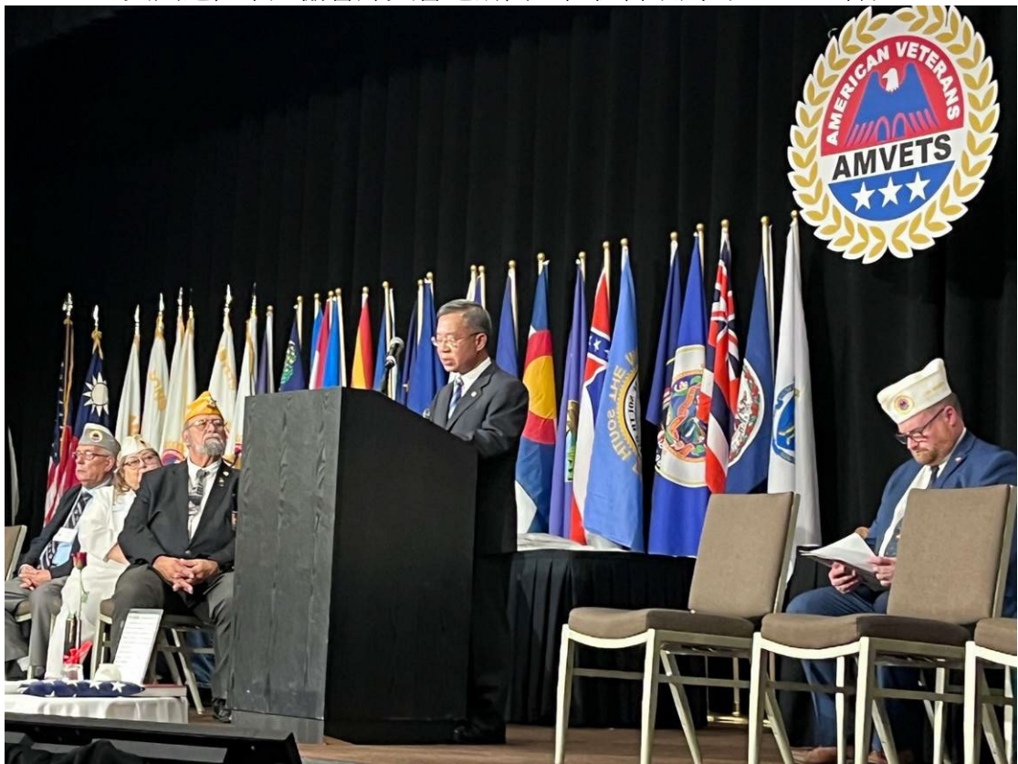
美國退伍軍人協會聯合開幕大會演奏中華民國國歌及陳列中華民國國旗