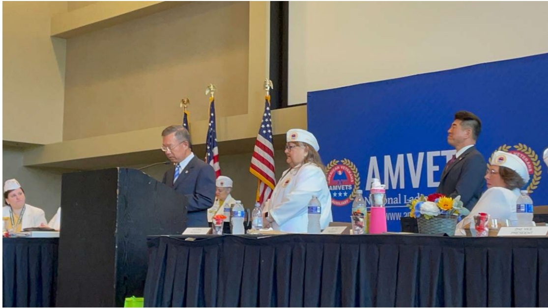
美國退伍軍人協會婦女會邀請簡主任秘書致詞（左 1 立者）