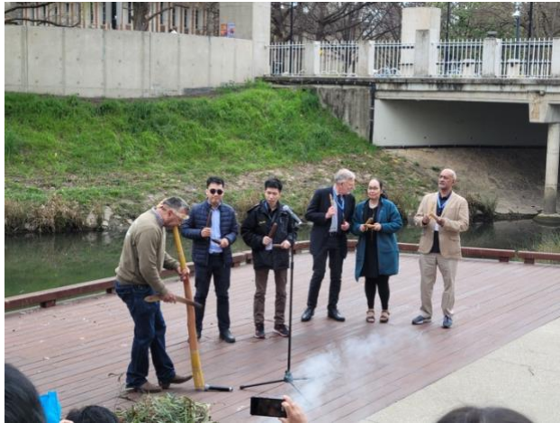
開幕典禮之澳洲原住民祈福典禮。