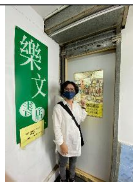
圖：香港樂文書店是最早引進臺版書者