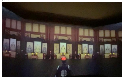
圖：「龍顏鳳姿—清代帝后肖像」展中 3D 動畫再現清代帝王、帝后肖像的祭祀儀軌