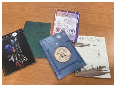
圖：香港藝術館以精美的贈閱導覽手冊取代展覽圖錄

第三，臺版書在香港書店佔有重要位置。香港習慣閱讀繁體字，在本次參訪的 4 間書店中，相較於簡體字圖書，臺版的繁體字圖書更為普遍。香港著名的大業藝術書店，更展銷為數眾多的國立故宮博物院出版品，可見需求。未來本館規劃出版品時，可將香港市場納入考量。