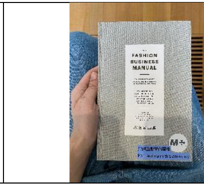
圖：「宋懷桂：藝術先鋒與時尚教母」展覽一隅及展中提供閱覽的書籍