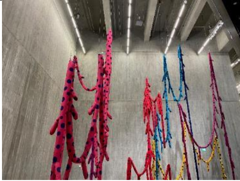
圖：草間彌生「神經的死亡」一隅