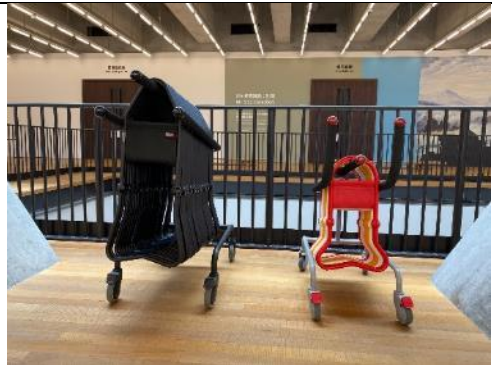
圖：節約空間的椅子