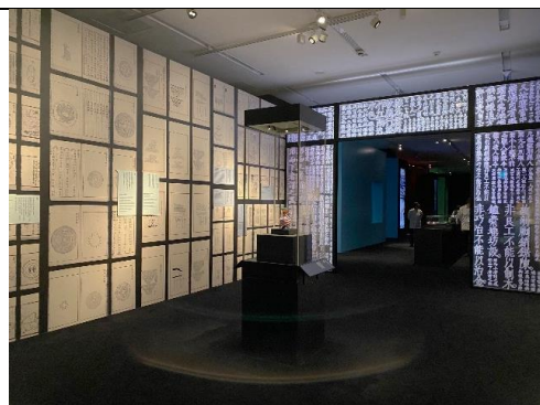
圖：「器惟求新一當代設計對話古代工藝」展場一隅，展示設計視覺效果強烈