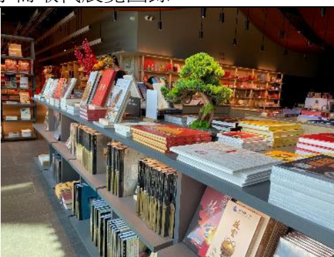
圖：香港故宮文化博物館商店書籍一隅