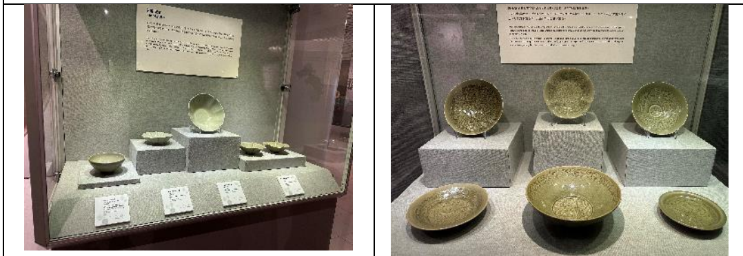
圖：「青妝泯火：上善堂藏耀州窯瓷器」展場一隅