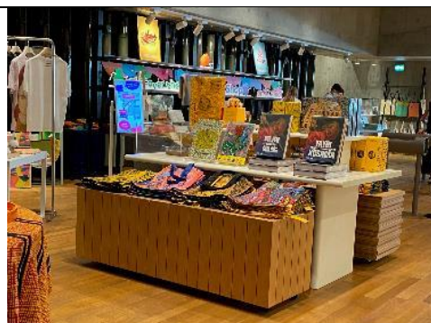
圖：M+博物館商店展陳一隅