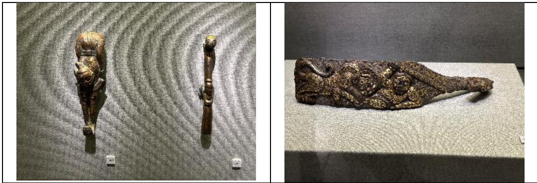
圖：「霜雪明金玄鈎沉：德能堂藏華夏早期帶鈎」展場一隅