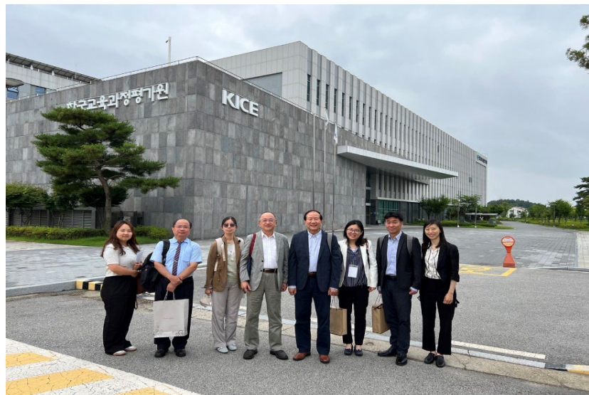
圖四：本院與我國駐韓代表處人員於KICE大門合影留念