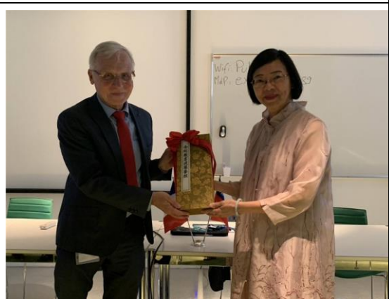
國圖致贈法蘭西學院國寶等級復刻書 金剛般若波羅蜜經