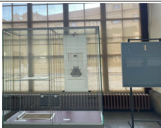
「文明的印記：古籍文獻展覽」展出國圖珍藏古籍復刻本