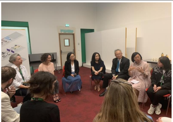
兩館交流座談分享經驗