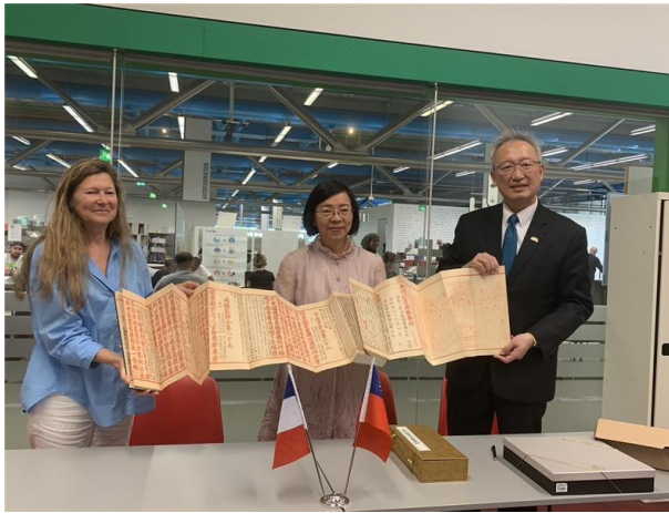
國家圖書館以國寶級藏品復刻書金剛般若波羅蜜經作為象徵致贈龐畢度公共資訊圖書館