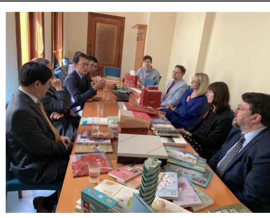
布拉格市立圖書館與國家圖書館兩館人員進行座談交流