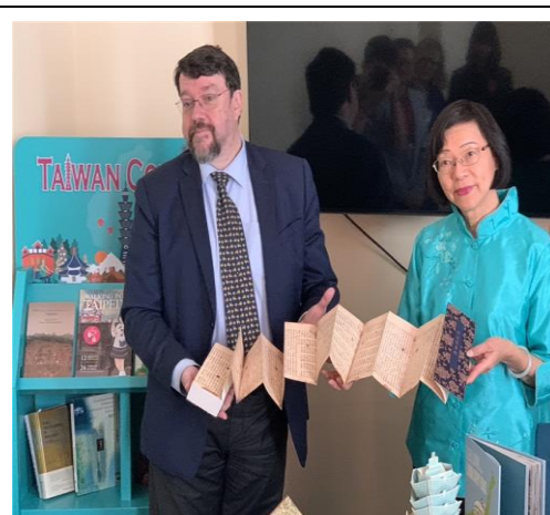
國圖致贈布拉格市立圖書館國寶級文獻復刻書-妙法蓮華經