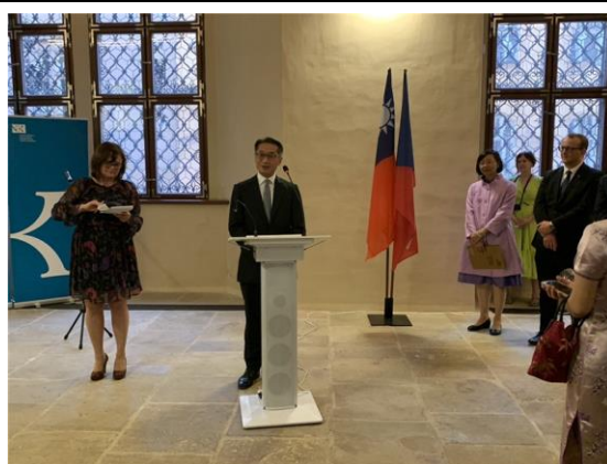
我國駐捷克代表處柯良歡大使致詞