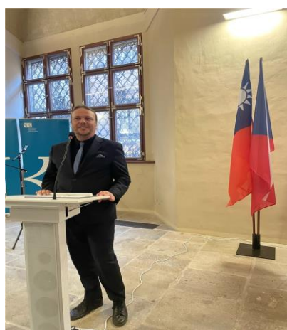
捷克文化副部長致詞