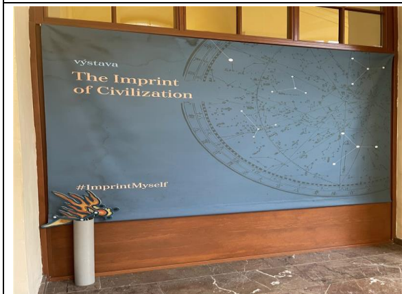
「文明的印記：古籍文獻展覽」於捷克國家圖書館展出