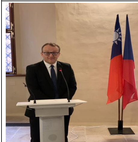
捷克國家圖書館館長致詞