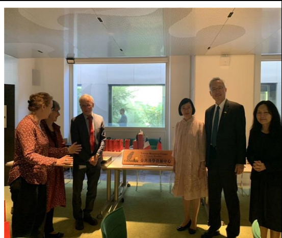
法蘭西學院臺灣漢學資源中心揭牌啟用儀式