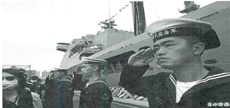
敦睦遠航訓練支隊在出航前，曾停靠台中港開放參觀。

傳出本次敦睦艦隊自馬紹爾群島返航途中，亦有循慣例前往南沙太平島及東沙島海域巡航，並依規劃與當地海巡官兵交流，或進行聯合操演，惟此事涉及敏感的南海主權議題，軍方並未證實。