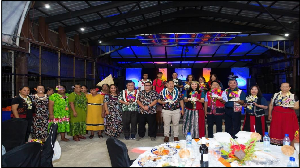
圖：馬國內政及文化部部長(中)致贈烏賈島礁（部長家鄉）婦女手工編織品。