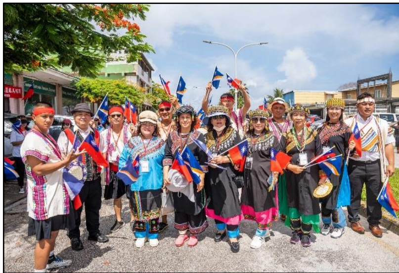
圖:列隊遊行大合照

並且分別於下午 1 時及 16 時參與傳統剝椰子殼競賽及傳統樂舞展演-malastapang(報戰功)，由長者領導，男子們圍成一圈，輪流向親族展現自己的功績與狩獵技巧，每喊一句，底下的族人，也會用熱烈的態度來回應，亦向祖靈稟告。