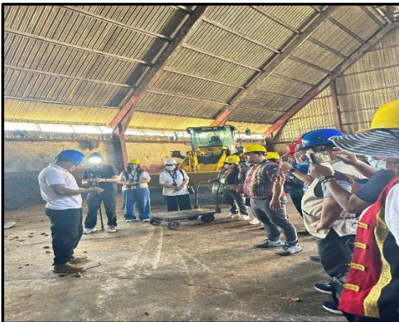
圖:Eugene Wase 執行長(左)導覽解說。

由於當天參訪時，工廠正在作業，無法靠近相關設備，執行長為讓團員更能親身體驗椰子本身，先行展演示範如何用特製工具剝椰子殼，隨後邀請團員們加入體驗剝子殼的樂趣。