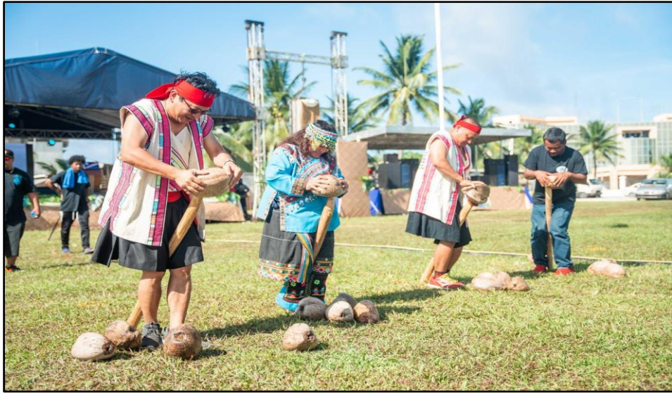
圖：團員參與剝椰子殼比賽