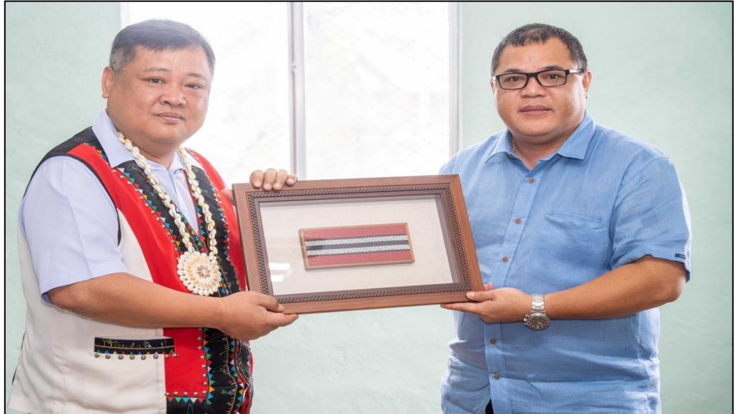
圖：內政及文化部部长 Ota Jacob Kisino（右）及原民會邱副處長文隆（左）致贈禮品。

葉、林投果葉等植物纖維編織各式工藝品，與臺灣原住民族傳統編織工藝品有著異曲同工之妙。編織中心現場有 2 為編織工藝師，邀請團員體驗手工編織的樂趣。