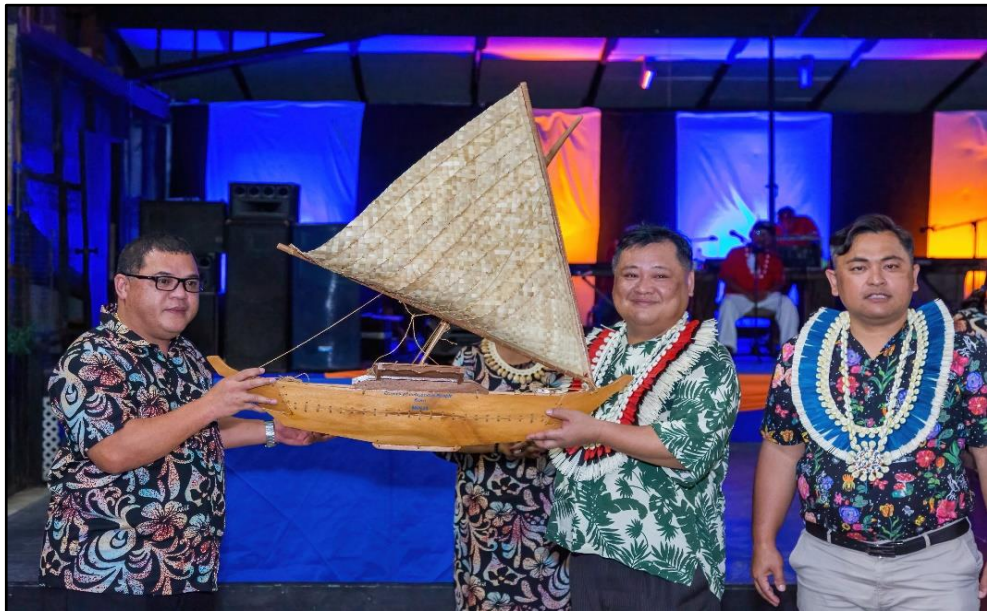
圖：馬國內政及文化部部長（左）致贈木雕獨木舟模型