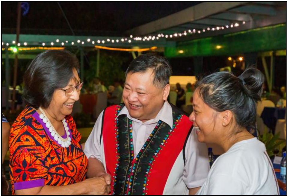
圖：前駐臺灣馬紹爾大使 Neijon Rema Edwards(左) 與原民會邱副處長文隆相談甚歡。

席間交談中，部長提到因我國原住民族與馬國族群同為南島語族一環，雙方在血緣、語言及文化上有很深的連結，希望臺馬雙方能有更多元的合作方式，期盼能促成馬國與臺灣原住民族鄉鎮締結姊妹市之模式，積極推動各項地方產業的發展，加強彼此之間的交流。晚間，馬國邀請我方代表團一同共舞，透過現場 LIVE 演唱當地音樂，在座的每位嘉賓皆為此馬國音樂的律動擺動身體，為表達感謝之意我方代表團透過演唱布農族歌謠獻上最誠摯的祝福與感激。