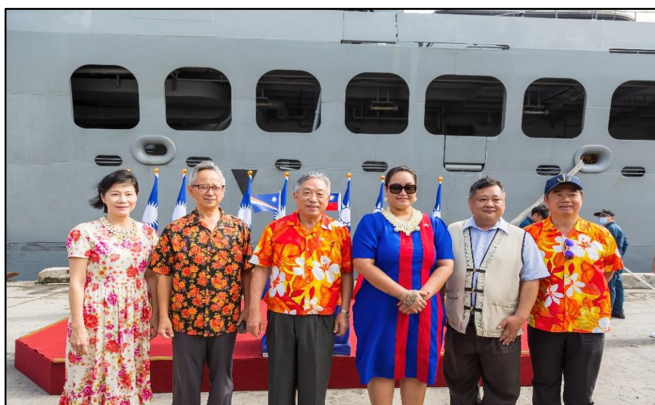
圖：(由左至右)夏大使夫婦、田政務次長中光、馬國外交部長 Kitlang Kabua(柯布雅)及本會邱副處長文隆。

於當日上午 9 時 20 分前往 Delap Dock(德雷普碼頭)，與外交部訪團一同參與歡迎敦睦支隊訪馬國典禮及捐贈儀式，本次敦睦支隊訪馬之目的為參加馬國 44 週年國慶及臺馬建交 25 週年紀念，展現我國對馬國的高度重視，並彰顯兩國邦誼緊密友好。歡迎典禮及捐贈儀式由外交部田政務次長代表致詞及捐贈籃球予馬方，且由馬國外交暨貿易部長 Kitlang Kabua(柯布雅)接受贈禮並表達感謝之意。