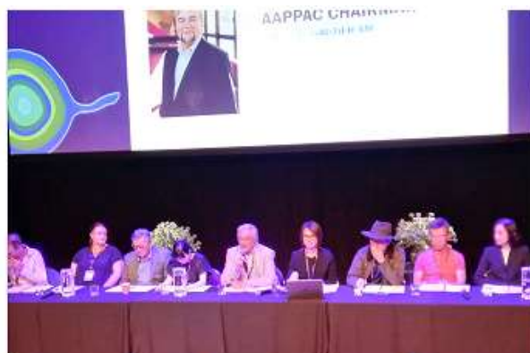
▲ AAPPAC 主席 Douglas Gautier AM 主持會議

本屆會員大會以結合線上、線下模式召開，會員代表不能親自出席會員大會者，可同步線上觀看會議進程。本次大會內容包括報告去年財務報告、新增會員、董事會成員名單，以及 2024 場館交流計畫；表決 2023-2024 年財務審計人員同意、AAPPAC 年費調整等事項，並確認 2025 年 AAPPAC 年會主辦單位為韓國大田藝術中心、2026 年 AAPPAC 年會主辦單位為香港西九文化區。