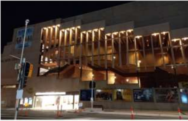
▲夜幕裡燈火通明的QPAC中心