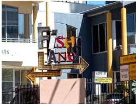
▲魚巷(Fish Lane)招牌及方向指引