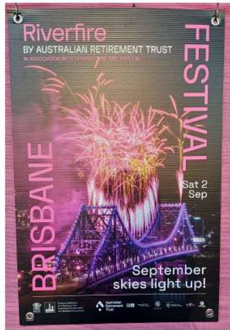
▲藝術節開幕表演海報