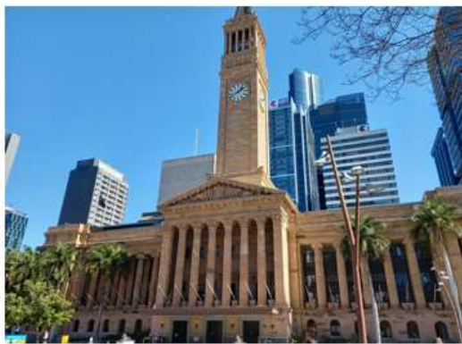
▲站在喬治國王廣場上，拍攝布里斯本市政廳正門外觀

布里斯本市政廳(Brisbane City Hall)興建於 1920 年至 1930 年間，是當時澳大利亞第二大巨資建設項目，僅次於雪梨港灣大橋。市政廳外觀是具有義大利文藝復興風格的稜柱型塔式建築，用棕黃色砂石建成，高 92 米，充滿古典氣息，走進門廳後能看到高聳的拱形天花板、寬闊的大理石樓梯、大型吊燈、馬賽克瓷磚地板和彩繪玻璃窗，建築整體相當宏偉而莊嚴肅穆。布里斯本市政廳是當地重要地標，於 1978 年被列入澳洲國家遺產名錄。