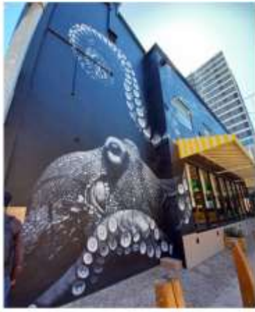
▲魚巷內建築外牆一樓裝飾繪畫