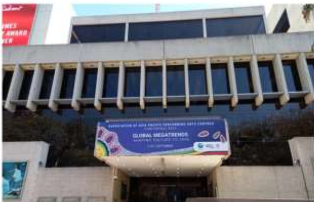
▲本次年會地點克雷蒙劇場入口

本次會議的地點安排在 Cremorne Theatre 克雷蒙劇場，這是昆士蘭表演藝術中心的小型表演場地（多功能廳），可容納 277 席，適合舉辦小型活動或私人活動，如電影、小型音樂會、戲劇表演、講座及會議等活動，讓觀眾可以近距離欣賞舞台演出。克雷蒙劇场的正門口，正對布里斯本河，可遙望對岸的市中心區，河邊上可以看到美麗的藝術裝置「布里斯本標誌」（Brisbane Sign）。