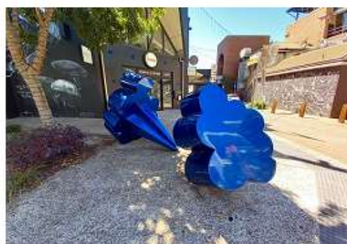
▲魚巷街道上隨處可見裝置藝術