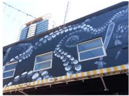
▲魚巷內建築外牆二樓裝飾繪畫