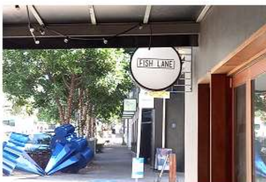
▲魚巷(Fish Lane)招牌，巷道上的裝置藝術

魚巷是一條平坦而相當狹長的道路，路面上有魚鱗片設計，道路兩旁多為小酒館與餐廳。魚巷為步行街，也能讓汽車行駛。早期是當地人通往河畔碼頭的重要幹道，於 1885 年被正式命名為蘇打水巷(Soda Water Lane)，其名源自早期巷內一家蘇打水公司。1904 年被重新命名為魚巷(Fish Lane)，以紀念當地著名的政治家 George Fish。2006 年，魚巷在當地政府支持下，開始由民間領頭，結合政府或企業相關資源進行整體規劃，將之打造成為一個社造共創基地，現在此地是一個充滿活力和創意的街頭藝術區。巷道內的牆壁上佈滿了各種風格主題的壁畫和雕塑等公共藝術景觀，展現城市的文化氣息。