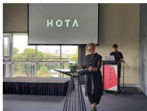
▲工作人員為參訪者進行場館介紹與解說