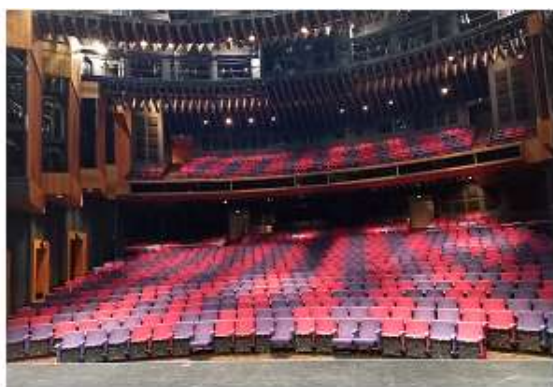
▲HOTA 室內劇場的觀眾席

1996 年園區增加了餐廳，並於 2014 年改名為 HOTA 藝術之家。就筆者看來，HOTA 發展成功最重要的背景因素有二，其一為 1993 年時，黃金海岸市議會將屬於政府的文化中心改制成立了有限公司，雖然市議會是唯一股東，但因此 HOTA 得以更自由及積極的爭取各種經費的來源與捐助，並可有更自由的發展。而另一攸關 HOTA 發展的事件，則是於 2014 年黃金海岸市政府通過了一份文化園區發展計畫，規劃了 HOTA 區域成為該市的主要文化區域，及該區域未來的發展。接下來也依此發展計畫，HOTA 興建了絕佳的戶外劇場、跨湖觀光路橋、及重要的 HOTA 美術館，而至今天的規模。HOTA 的發展令筆者想到國內各表演藝術行政法人機構，有著異曲同工之處。然而國內之機構在靈活性及內容的豐富度上似乎未及 HOTA，而政府在成立行政法人後，似乎也未能有持續協助其發展的相關計畫，實為可惜。