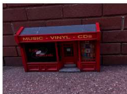
▲魚巷街角邊的裝置藝術