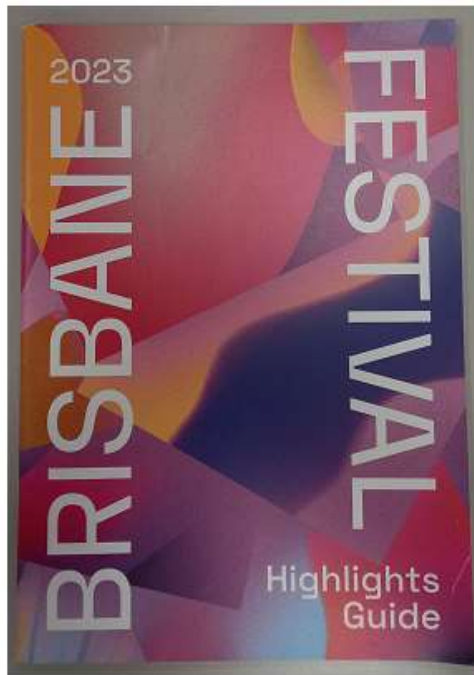
▲2023 布里斯本藝術節節目手冊