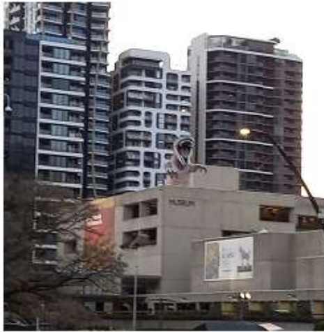
▲昆士蘭博物館正舉辦恐龍主題特展，展館建築上方擺放一座頭部跟上肢能上下擺動的恐龍裝置藝術