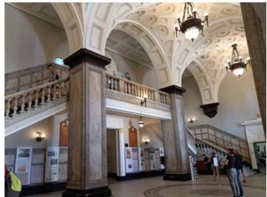
▲布里斯本市政廳一樓大廳