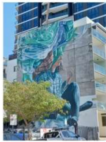
▲魚巷內建築外牆的裝飾繪畫