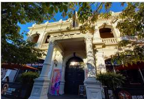
▲公主劇院 (Princess Theatre) 正門口