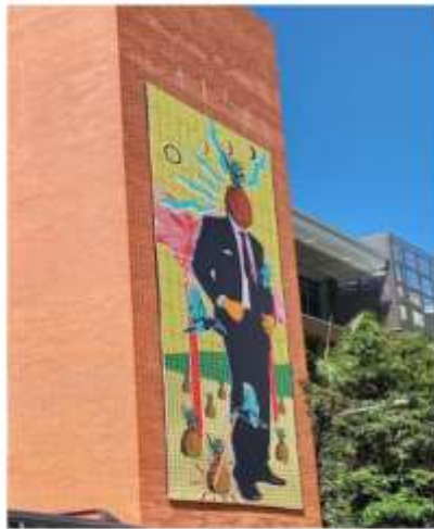
▲魚巷內建築外牆的裝飾繪畫