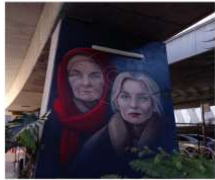
▲魚巷與高架橋下橋柱的裝飾繪畫