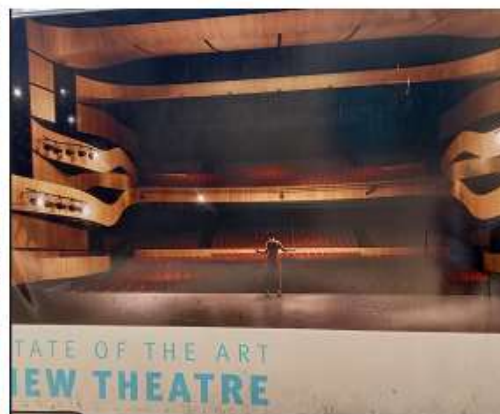
▲QPAC 正在興建中的新場館內部示意圖，拍攝於施工地圍籬背板。