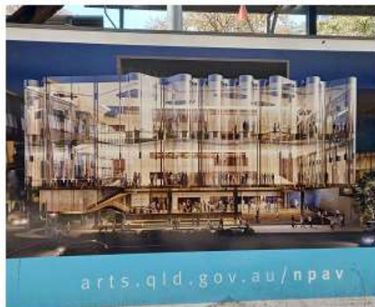
▲QPAC 正在興建中的新場館外觀示意圖，拍攝於施工地圍籬背板。

生活空間相互結合，並能邀請街上的路人與其中發生的藝術活動一起互動，展現社區參與精神。目前昆士蘭表演藝術中心每年約有 130 萬名觀眾，未來新劇院啟用後，將可使該中心每年增加 30 萬名遊客，並使昆士蘭表演藝術中心將成為澳洲最大的表演藝術中心。