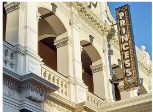
▲劇院上方的招牌上，標示該劇院建1888年