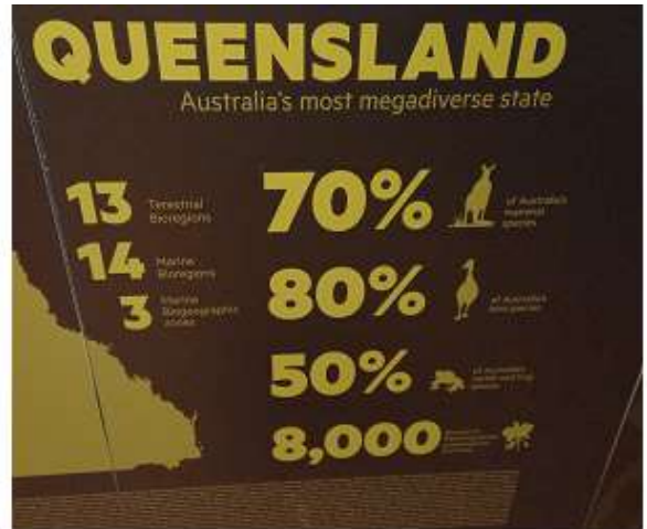
▲博物館內介紹澳洲物種的展示板