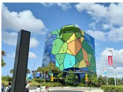
▲HOTA 藝術之家的建築外觀

HOTA, Home of the Arts (藝術之家) 位於澳洲昆士蘭州黃金海岸市中心，為一知名之文化藝術中心，其園區內擁有千人劇場、黑箱劇場、電影院、戶外劇場、美術館、咖啡廳、餐廳、湖泊、公園等等。其辦理的活動包括美術、戲劇、舞蹈、音樂、電影、展覽等各式表演及視覺藝術，另外則有藝術教育及社區發展等活動。其組織發展的理想是「抓住你的想像力」；使命是成為一個藝術、娛樂、文化、生活交會的指標景點；價值則在於藝術、市民、好奇、正直、慷慨。HOTA 於 1976 年以身為黃金海岸市政府的市民中心開幕，到 1986 年擴大為娛樂文化中心，再改名為黃金海岸藝術中心，並