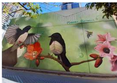
▲魚巷內建築外牆的裝飾繪畫