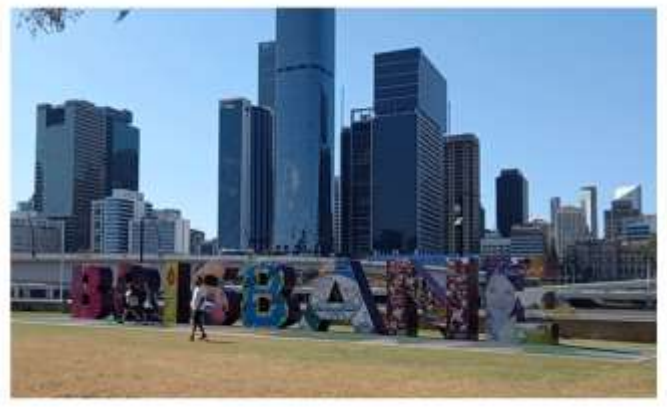
▲著名地標「布里斯本標誌」(Brisbane Sign)