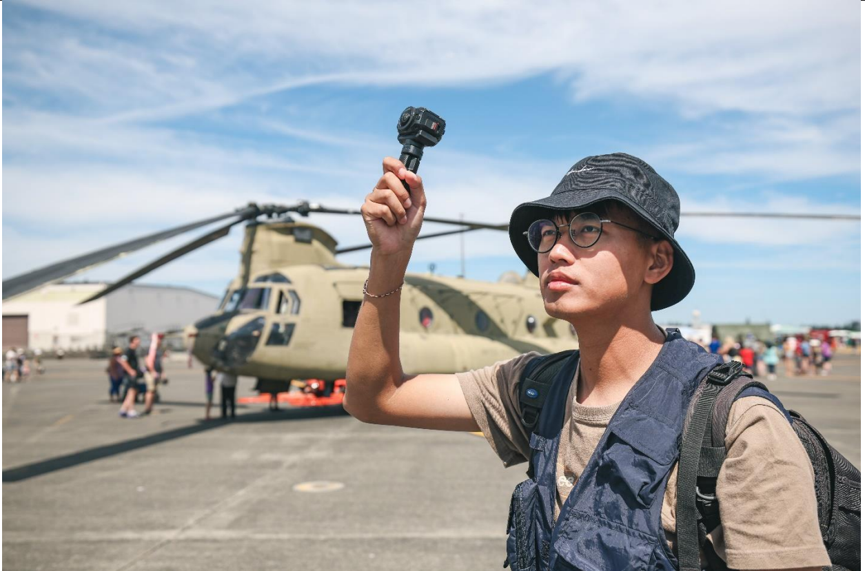
採訪團隊於美國路易斯-麥考德聯合基地開放中以 Insta360 全景相機及 GoPro 捕捉現場畫面