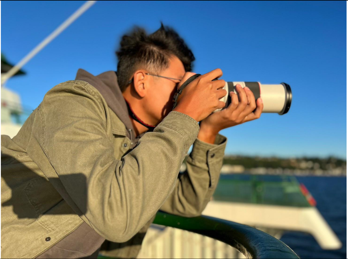
採訪團隊於布雷默頓港拍攝海軍特納喬伊號照片。