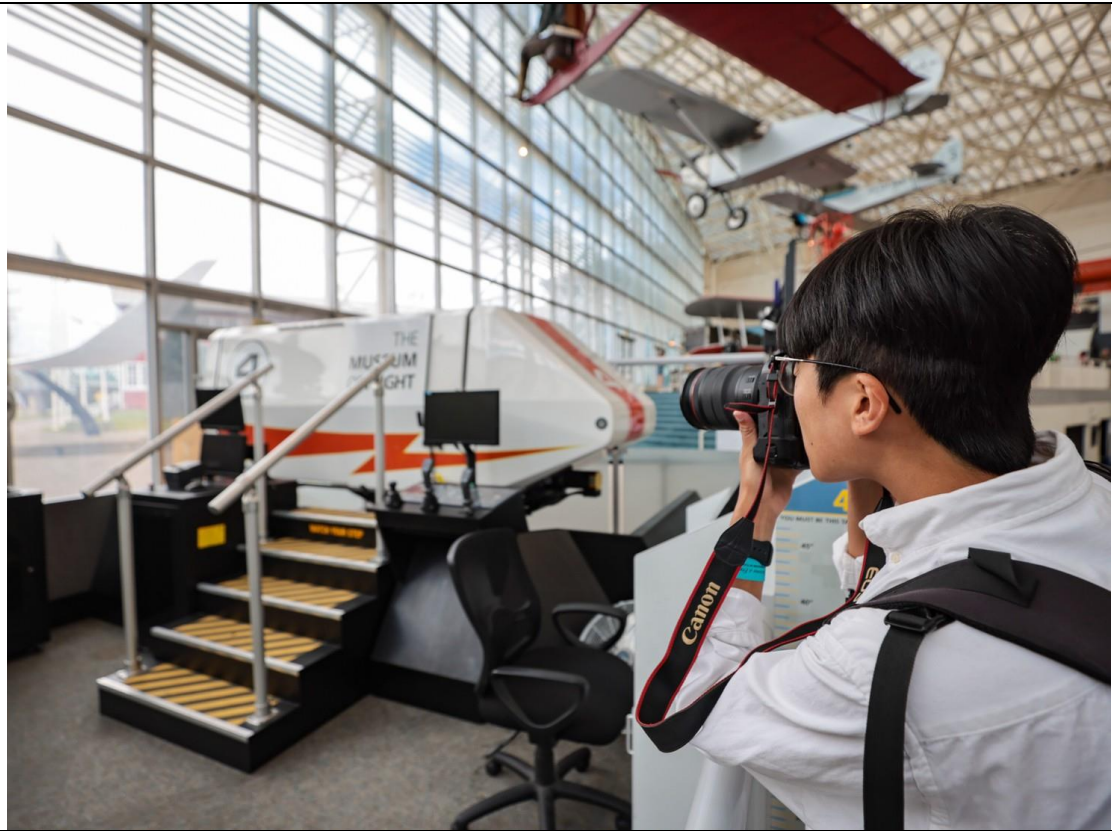
採訪團隊於西雅圖航空博物館中拍攝各式武器陳展照片。