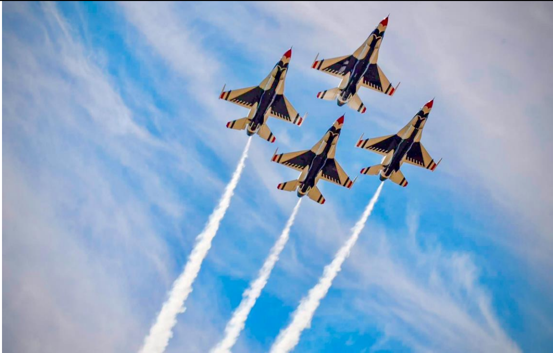
「雷鳥」特技小組進行空中動態操演，飛行技術精湛。