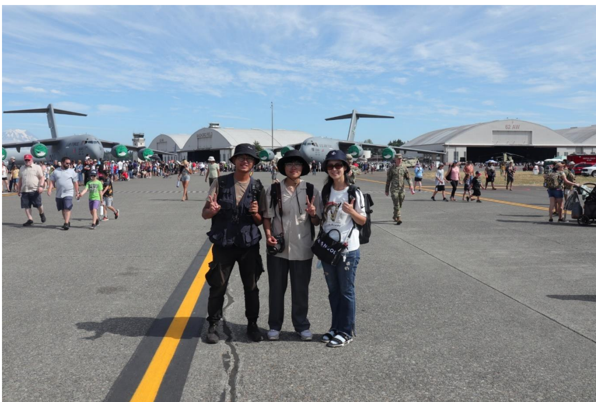
採訪團隊於美國路易斯-麥考德聯合基地開放中合影留念。