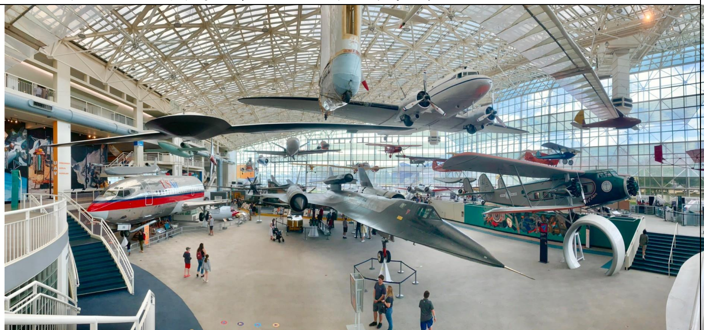
西雅圖航空博物館讓民眾觀賞各式航空武器。