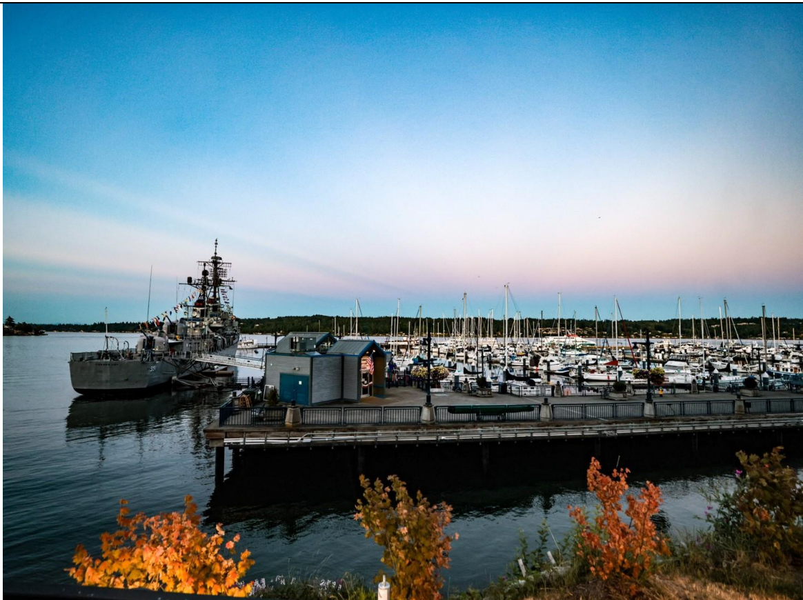
海軍特納喬伊號博物館船，讓民眾回顧其昔日風光。