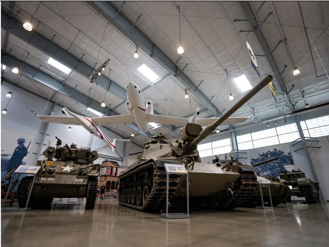
西雅圖飛行遺產博物館陳展各式軍事武器，讓民眾探索戰爭歷史。