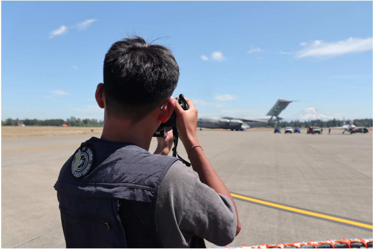
採訪團隊於美國路易斯-麥考德聯合基地開放中拍攝動態表演照片。