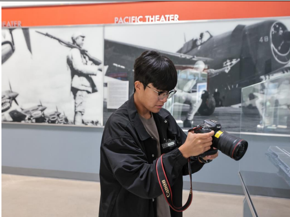
採訪團隊於西雅圖飛行遺產博物館中拍攝各式武器陳展照片。