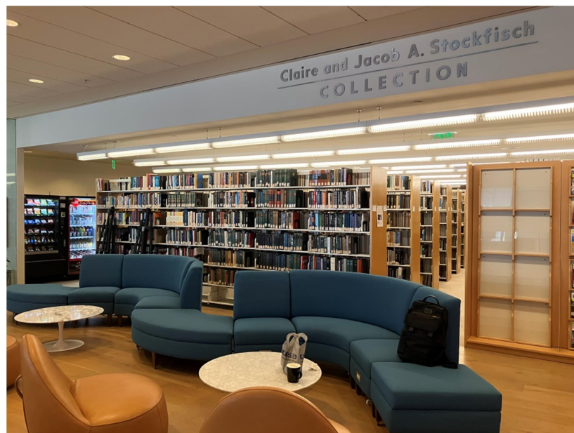
蘭德加州總部圖書空間一隅