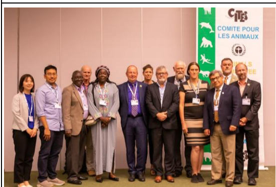
第 32 屆動物委員會委員