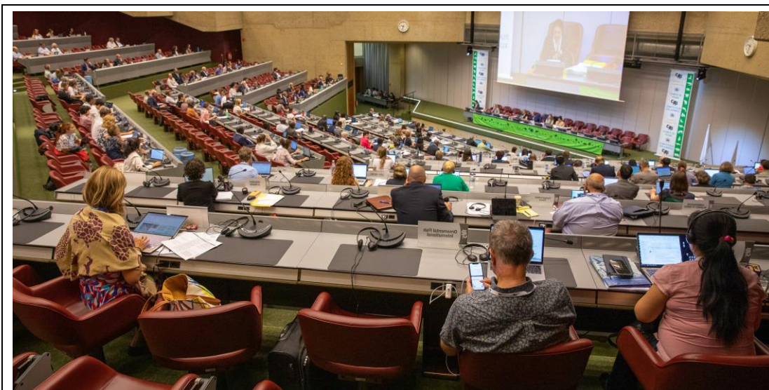
第 32 屆動物委員會會場