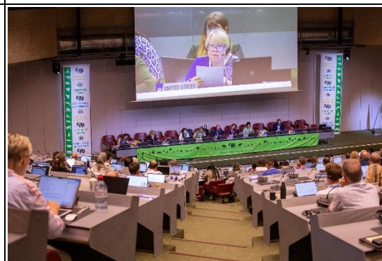
議案討論情形（美國代表發言中）