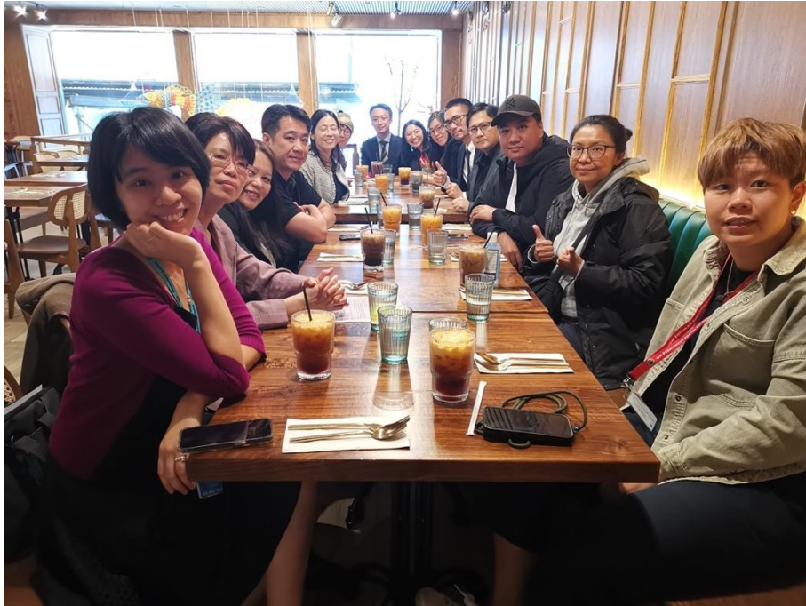
經文處及臺灣團隊工作餐會