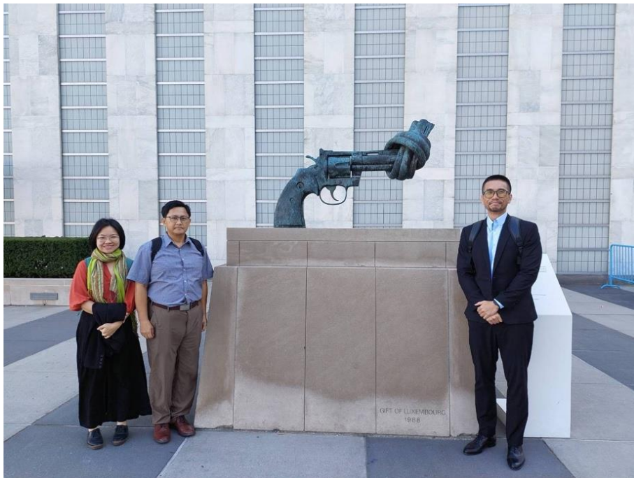
聯合國紐約總部反暴力雕塑