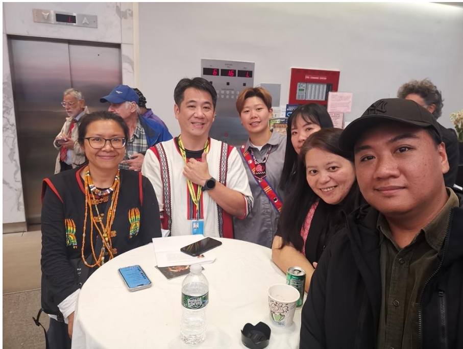
臺灣原住民族志願服務交流協會