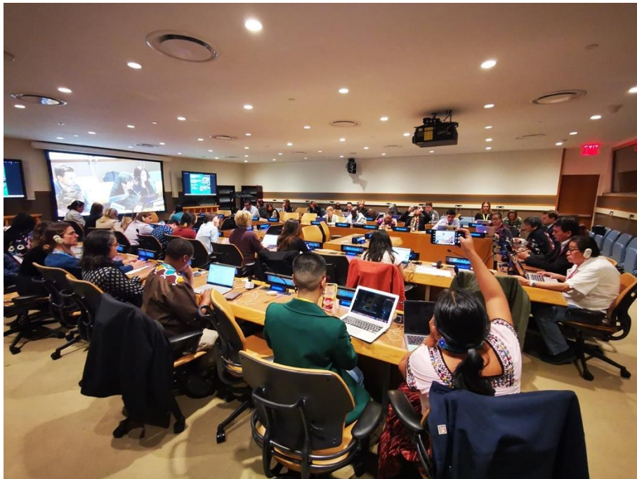
總部平行會議現場