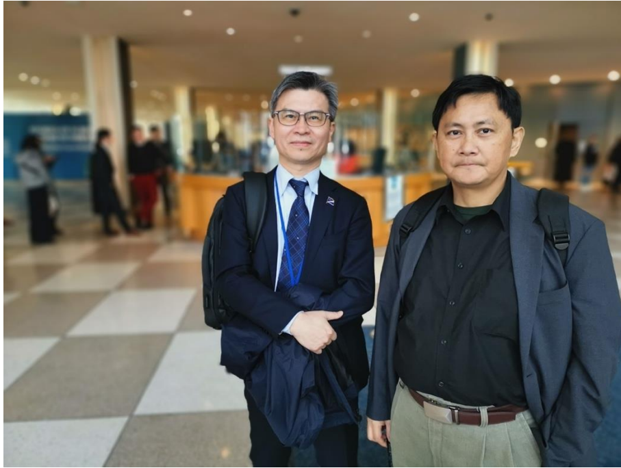
聯合國紐約總部大廳