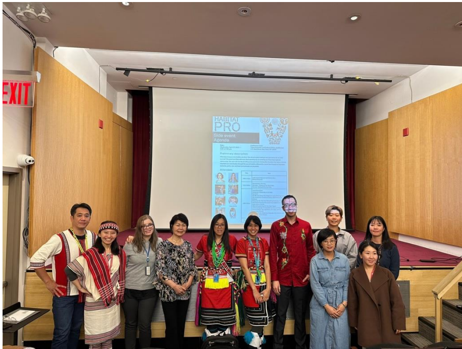
我國團員與 Habitat Pro 共同舉辦之周邊會議