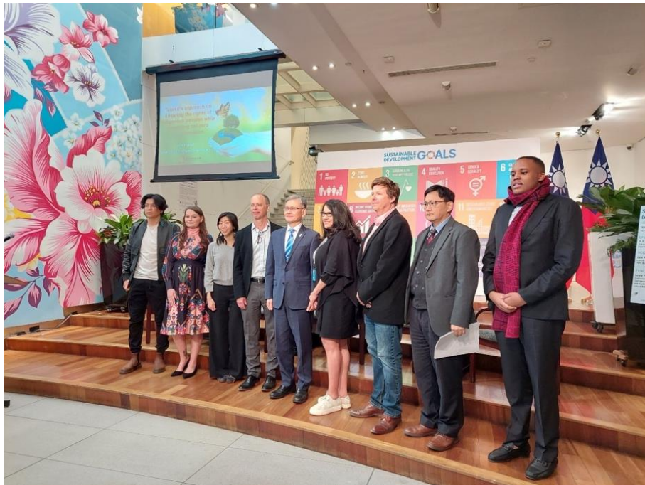
研討會與談學者專家合影