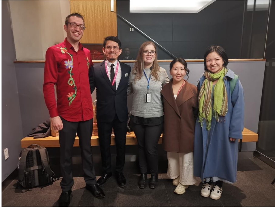
秘魯國際組織 Habitat Pro