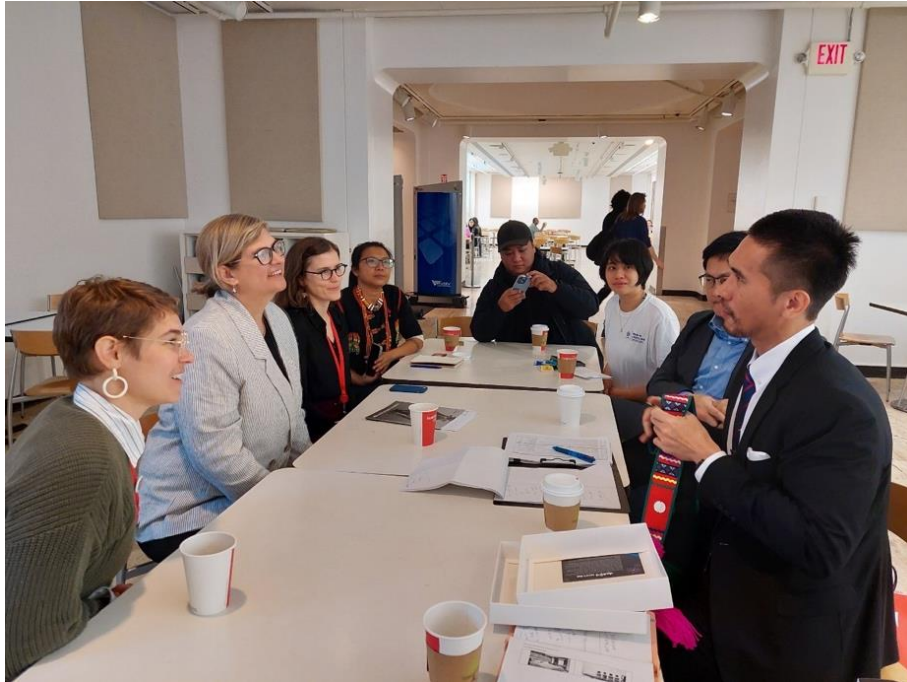
與館方團隊業務交流