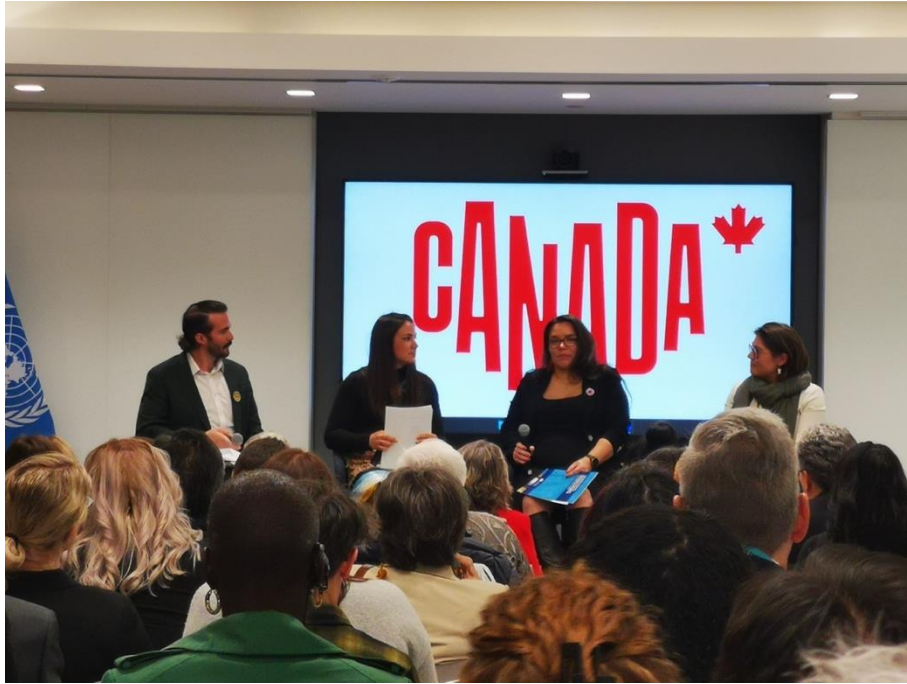
加拿大官方平行會議現場