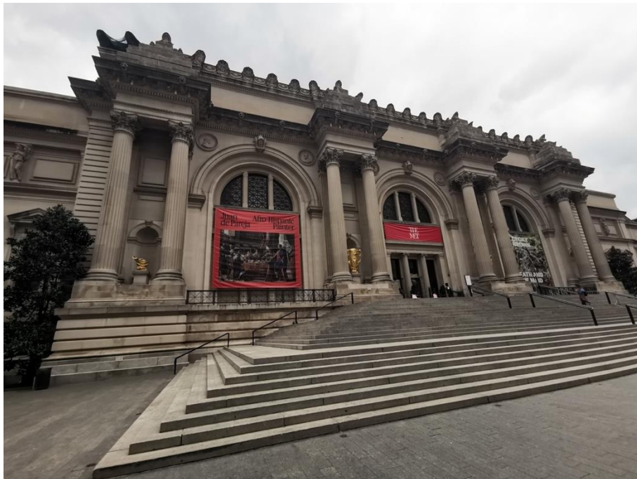
紐約大都會博物館正門