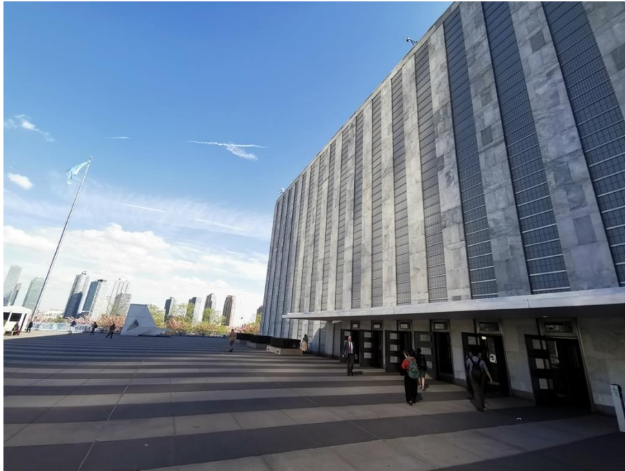
聯合國紐約總部廣場