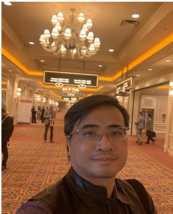
5 · 會場一角