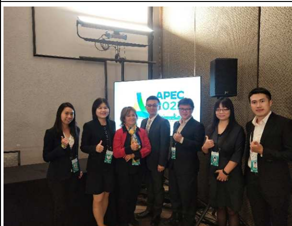
圖片19 我團與智利與會代表交流合影