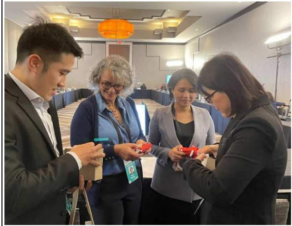
圖片4 致贈紀念品合影