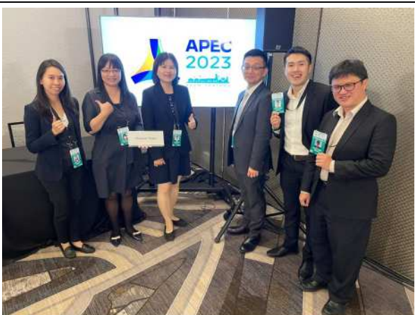
圖片18 我團團員合影