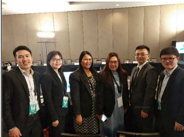
圖片8 我團與菲律賓代表團交流合影