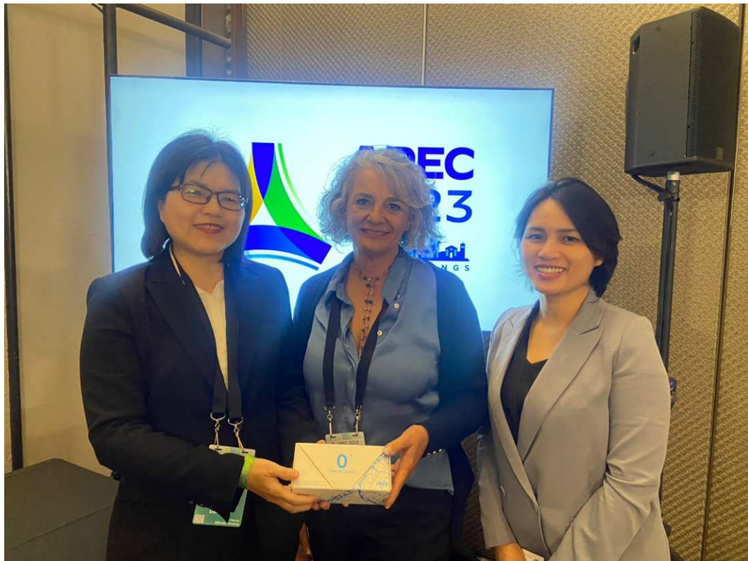
圖片2 致贈海廢再生紀念品予 OFWG 會議 M 主席及秘書處計畫主任