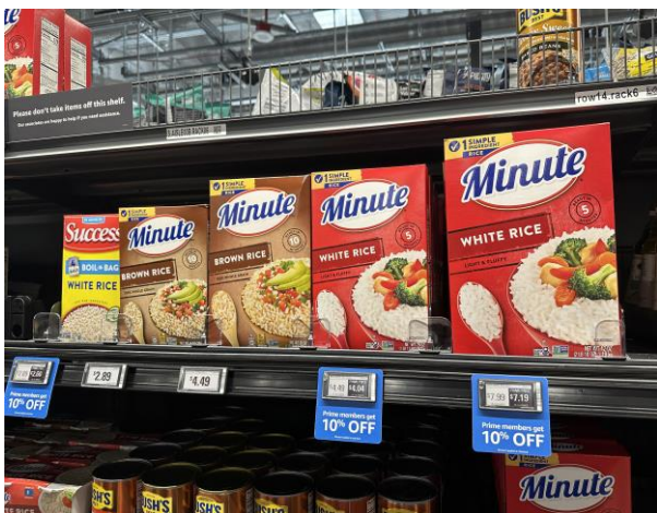
歐美地區常見之蒸穀米