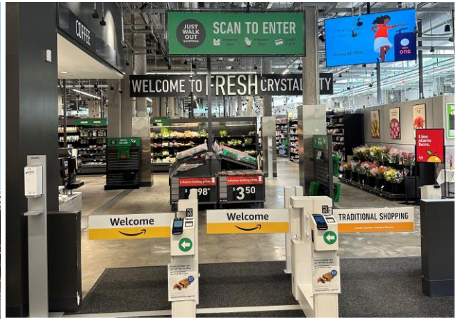
超市採無人結帳(just walk out)