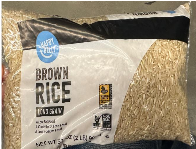
Amazon Fresh 之自有品牌