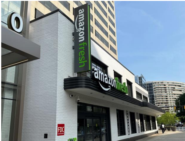
Amazon Fresh 生鮮超市