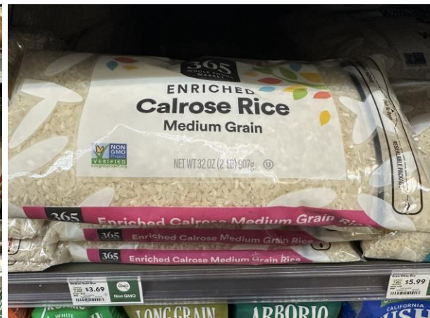
WHOLE FOODS 之自有品牌