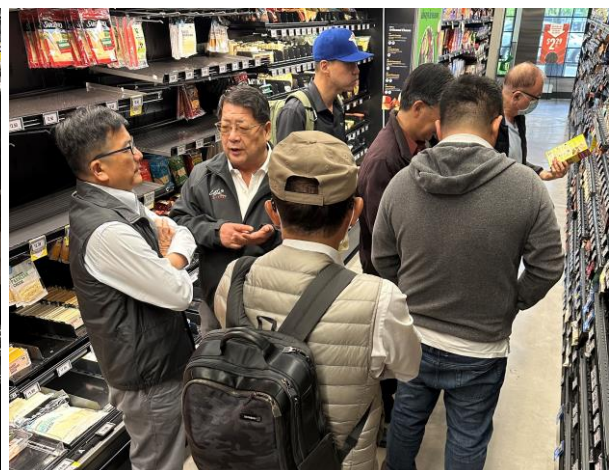
國內業者就美國末端通路市場熱烈討論