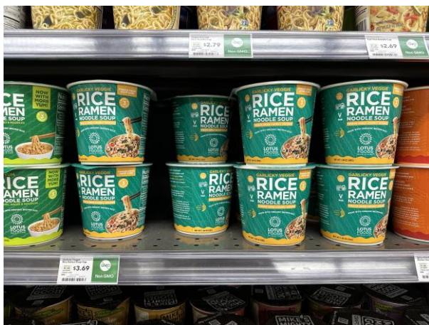
多元米食製品(米製泡麵)