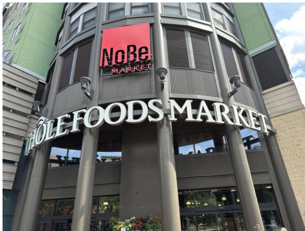
WHOLE FOODS 有機超市