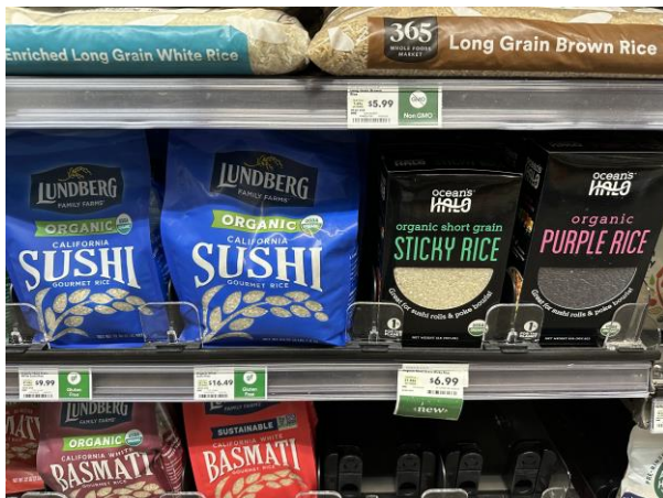
食米包裝方式多元