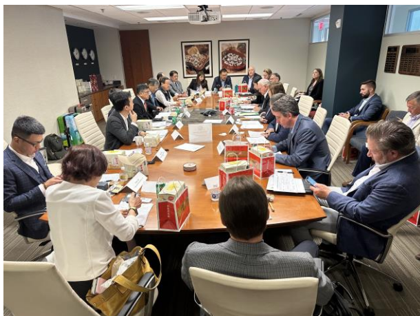
第 8 屆臺美稻米技術諮商會議情形