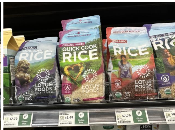
各式東南亞地區進口米