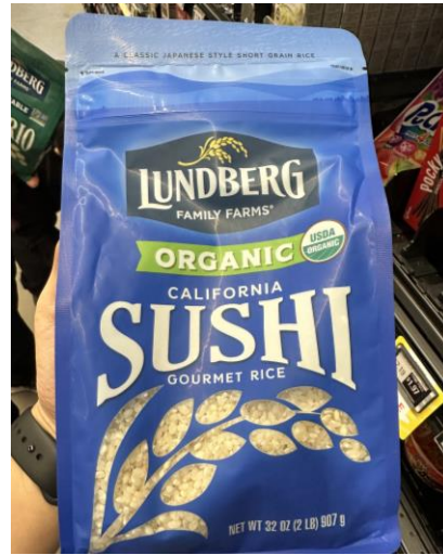
有機加州 Calrose 稈型中粒米