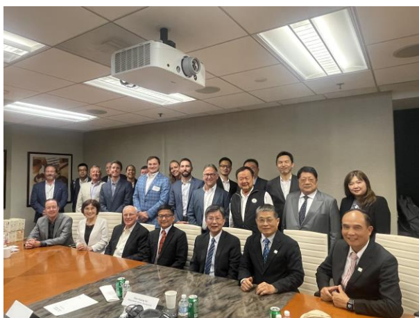
會後雙方與會人員合影