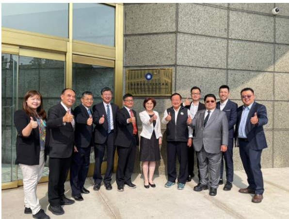
拜會駐美國代表處農業組