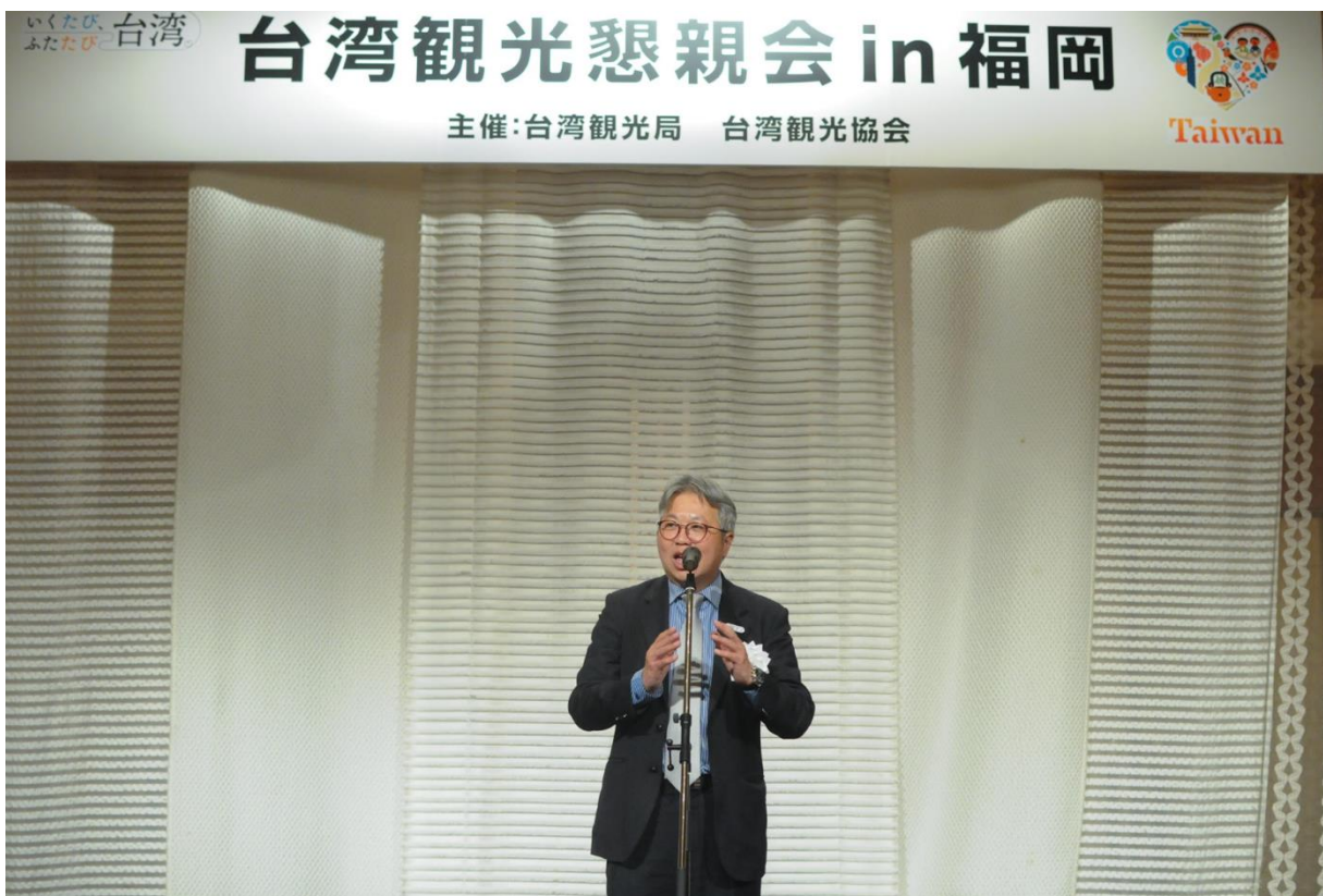
3月17日臺灣觀光懇親會，周副局長致開場歡迎詞