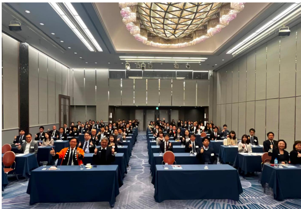
關西地區臺灣觀光推廣說明會，臺日業者大合照