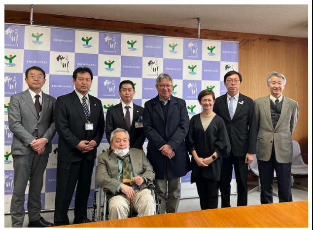
拜會福岡柳川市政府