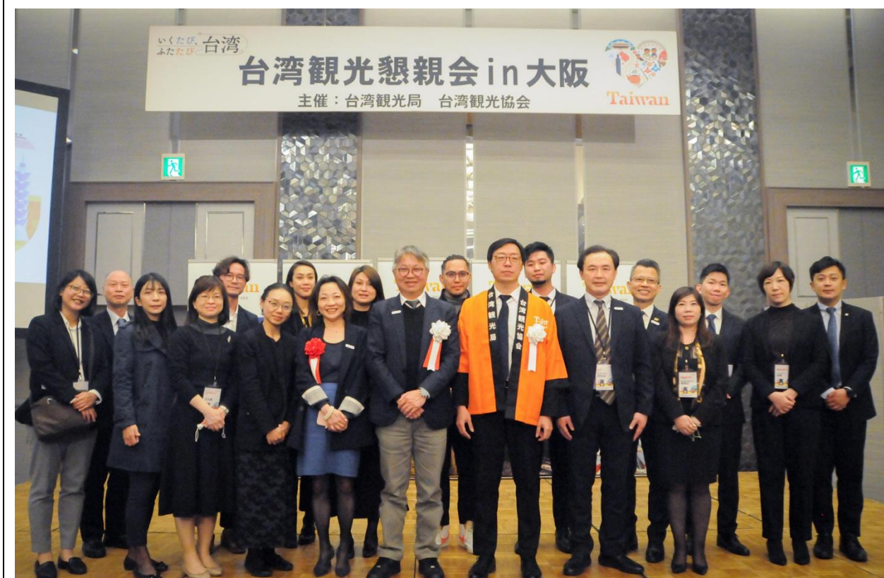
關西地區臺灣觀光懇親會臺灣代表團大合照