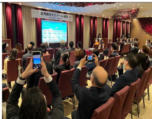
九州地區業者仔細閱讀臺灣觀光文宣及聽取臺灣最新觀光資訊簡報