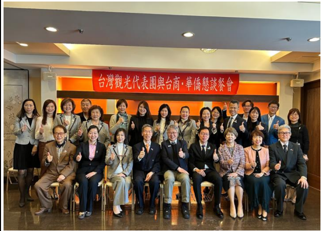
臺灣觀光業者與關西僑界/台商組織 意見交流會