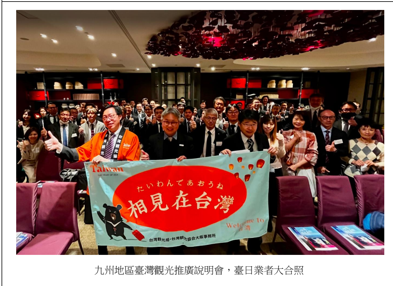
九州地區臺灣觀光推廣說明會，臺日業者大合照