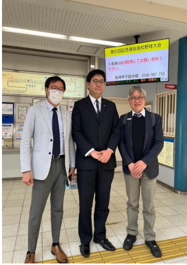
與阪神電車運輸部交流研商合作事宜