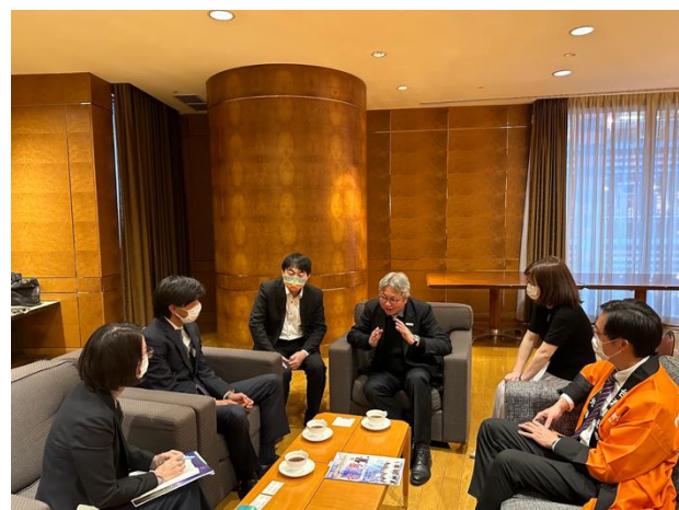
福岡每日新聞專訪周副局長