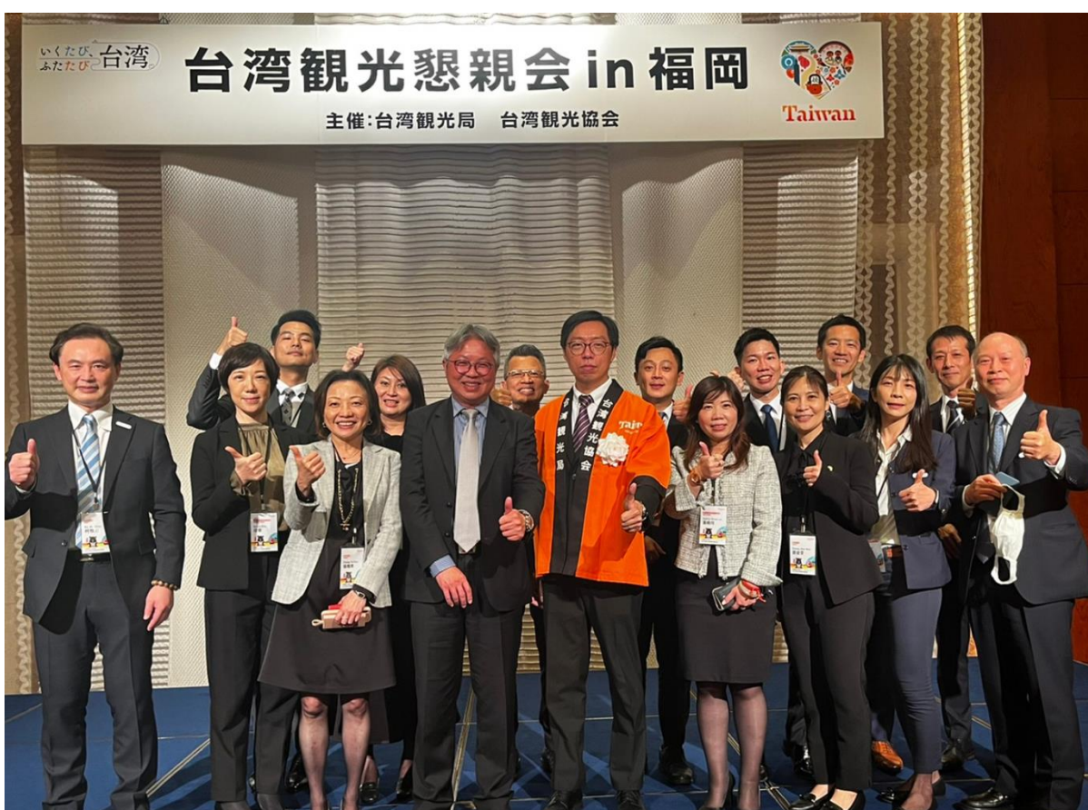
3月17日臺灣觀光懇親會臺灣代表團大合照