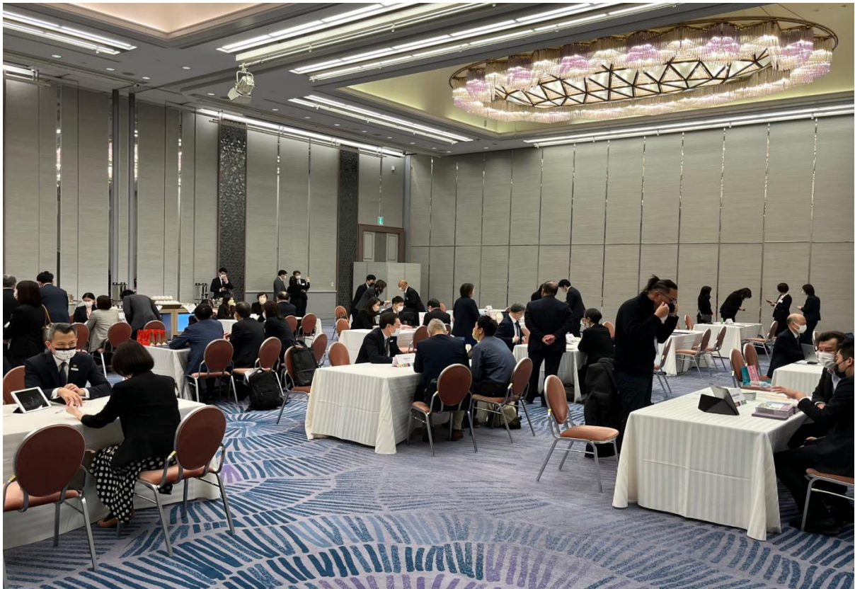
關西地區商談會臺日業者交流熱絡