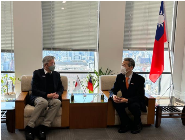
拜會外交部駐大阪經濟文化辦事處 向明德處長