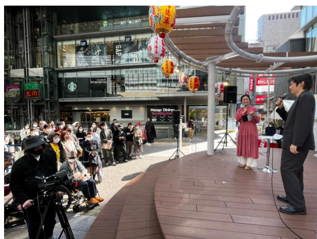
大阪 Roadshow 活動吸引眾多日本民眾停駐