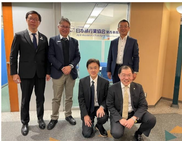
拜會 JATA 日本旅行業協會關西支部