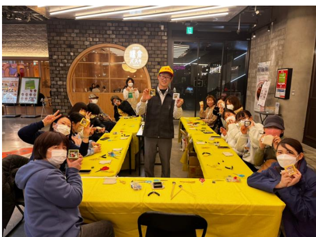
DIY 體驗活動廣受日本民眾好評