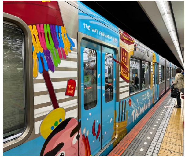
視察阪神電鐵臺灣觀光彩繪列車