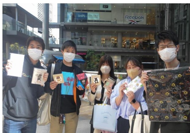
日本民眾開心展示活動抽中之臺灣禮品