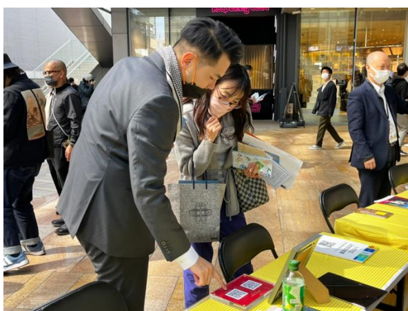
臺灣業者向日本民眾介紹 臺灣最新觀光資訊