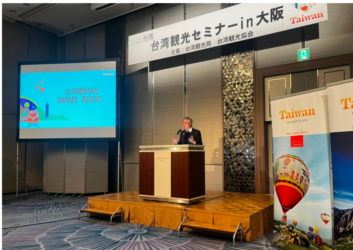
關西地區臺灣觀光推廣說明會，周副局長開場致詞