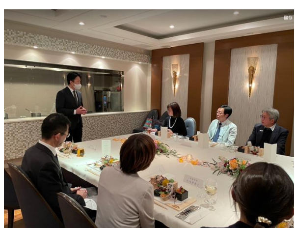
與 DMO 神戶觀光局交流餐會