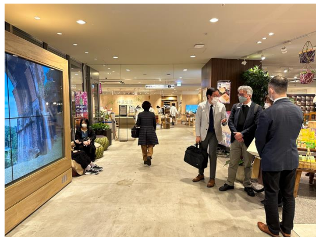
視察與大阪近鐵百貨異業合作之 臺灣觀光資源專區