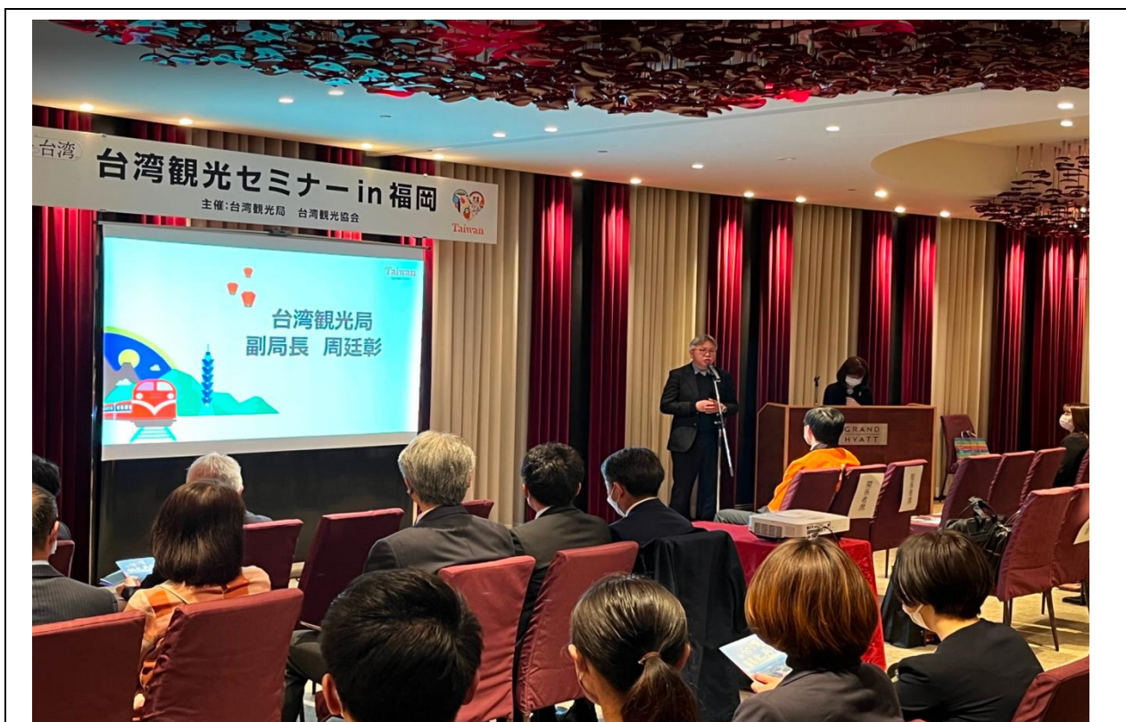
九州地區臺灣觀光推廣說明會，周副局長開場致詞