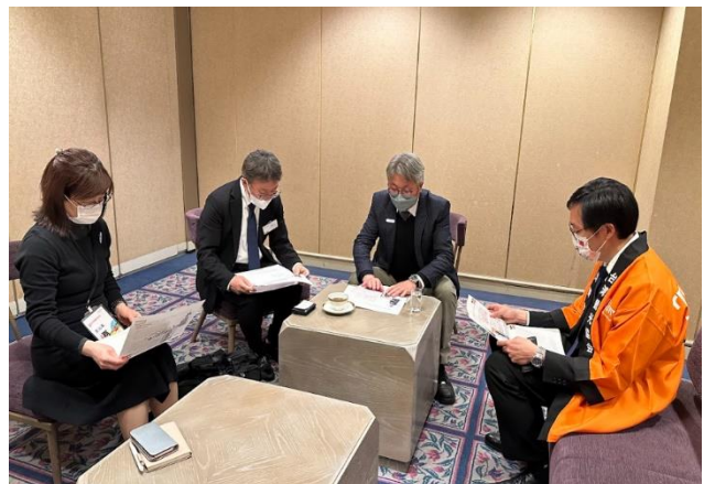
朝日電視台拜會周副局長研商合作推廣事宜