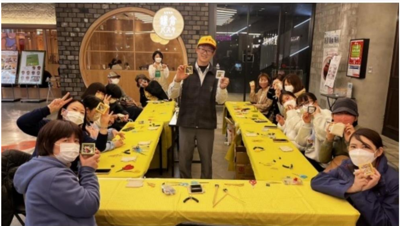
觀光局赴大阪推台灣旅遊。

責任編輯 林弘笙 報導 發佈時間：2023/03/19 22:24 最後更新時間：2023/03/19 22:24