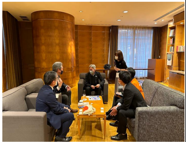
熊本縣廳空港促進部門（左） 拜會周副局長