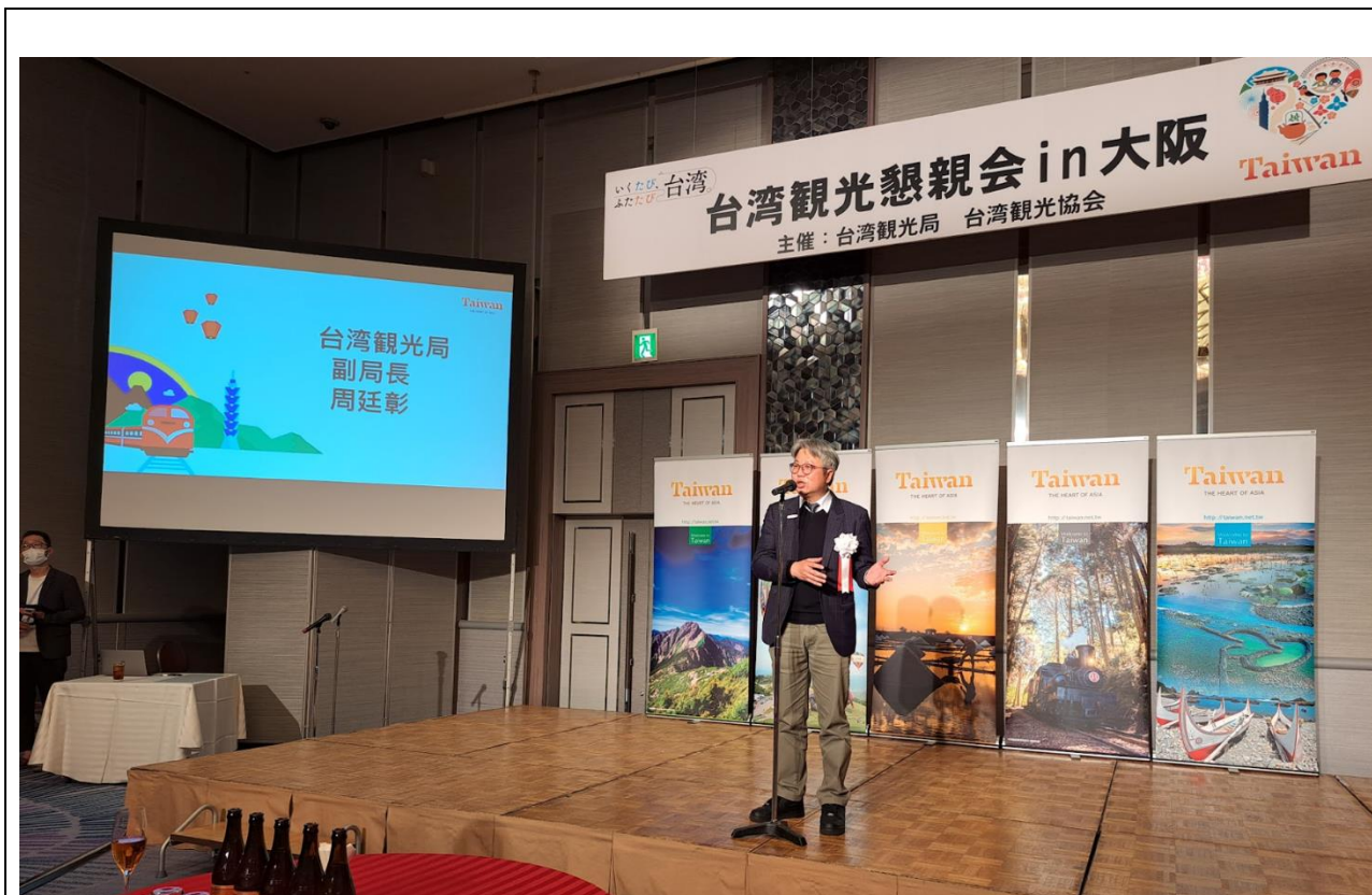
周副局長於關西地區臺灣觀光懇親會開場致詞