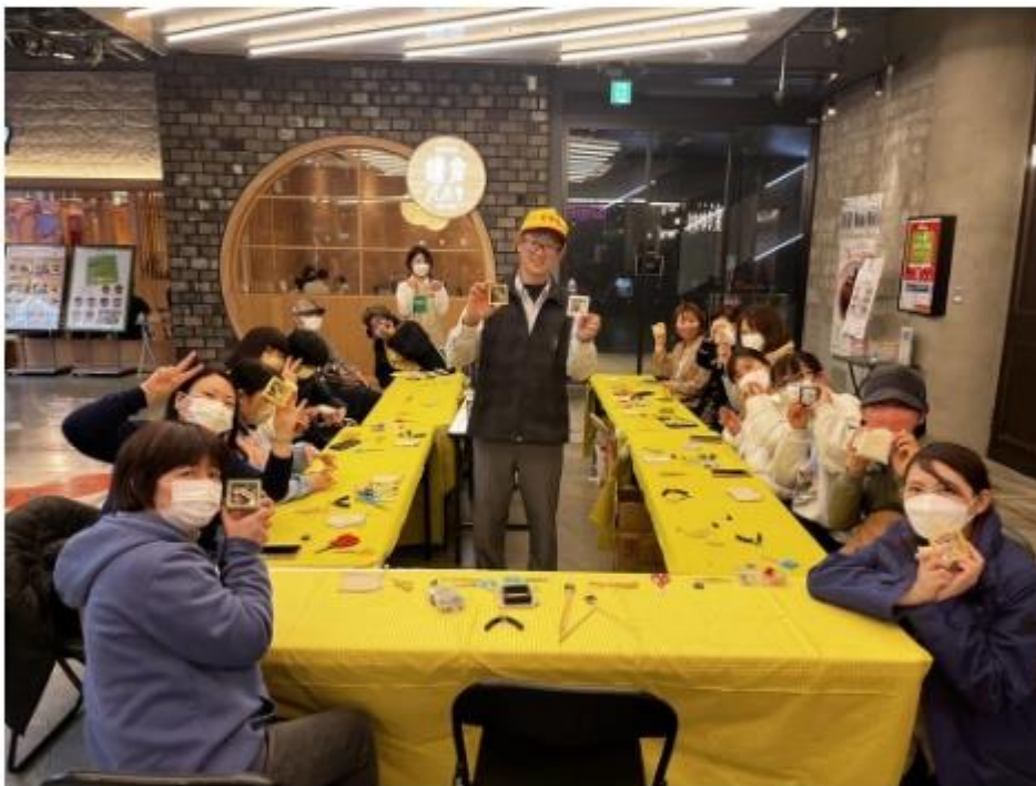
交通部觀光局赴日本推廣台灣旅遊，19日在西日本地區最大城市大阪舉辦活動，邀請日本民眾體驗宜蘭草編及南投竹編的DIY創作。 112年3月19日

4 (中央社記者汪淑芬台北19日電) 交通部觀光局赴日本推廣台灣旅遊，今天在大阪舉辦活動，現場體驗宜蘭草編及南投竹編的DIY創作，吸引日本民眾熱烈反應。