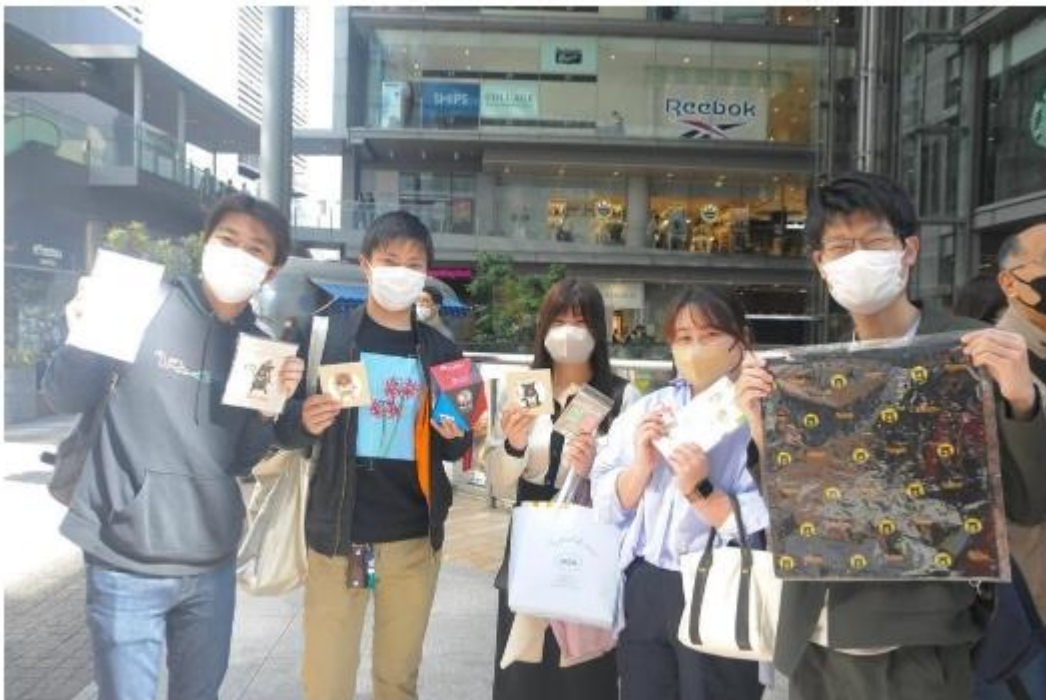
參加觀光局活動的民眾開心與拿到的小禮物合影。

依據2022年日本外務省統計顯示，日本30代青壯年護照持有率達34%，為所有年齡層最高。觀光局鎖定年輕客群，3月19日於大阪舉辦Roadshow活動，結合日本時下最風行的SDGs永續旅遊熱潮，現場舉辦宜蘭「永續稻草吊飾編織」和南投「窗花竹編杯墊」等DIY活動，現場日本民眾反應十分熱烈，排隊體驗台灣質感手創作品。