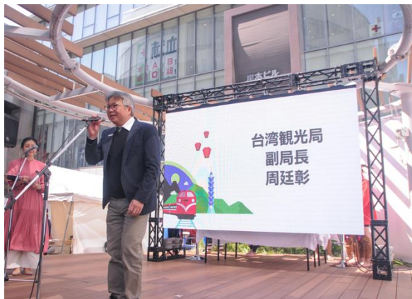
大阪 Roadshow 活動周副局長致詞