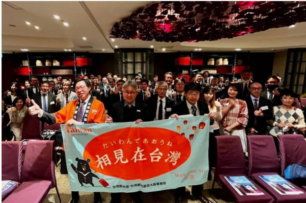
今於日本福岡舉辦的台灣觀光推廣會，向近60名日本旅行業者深入介紹疫後台灣最新山海旅遊及觀光圈資源。