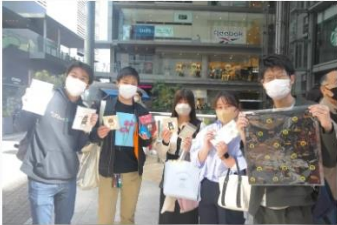
參加觀光局活動的民眾開心與拿到的小禮物合影。