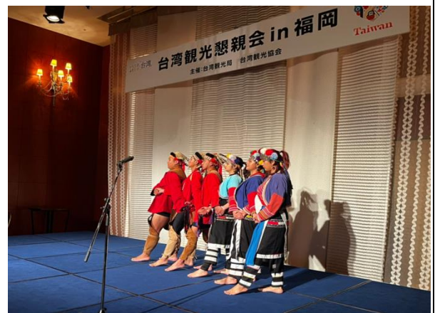
懇親會中，「BarMood」技藝高超的調酒表演及鄒族表演團體「跳動的山林」之熱情演出，獲得日本業者大力讚賞