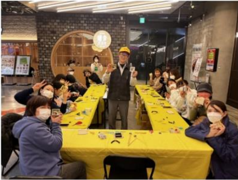
交通部觀光局赴日本推廣台灣旅遊，19日在距日本地最大城市大阪舉辦活動，邀請日本民眾體驗宜蘭草編及南投竹編的DIY創作。112年3月19日

(中央社記者汪淑芬台北19日電)交通部觀光局赴日本推廣台灣旅遊，今天在大阪舉辦活動，現場體驗宜蘭草編及南投竹編的DIY創作，吸引日本民眾熱烈反應。