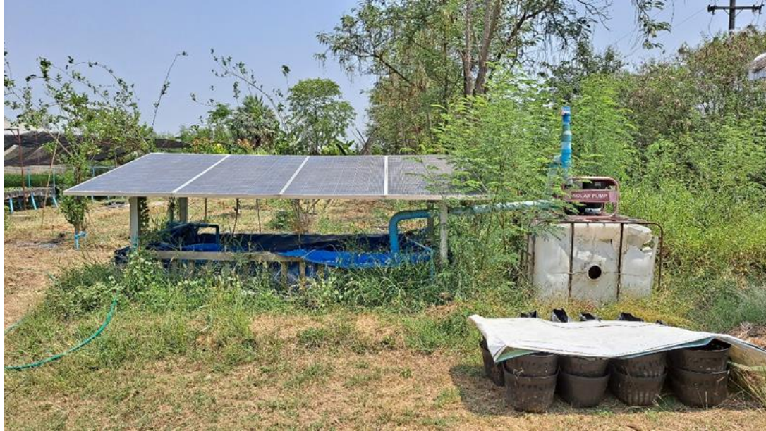
圖 11 農場在農地上架設小片太陽能板，發電主要用於抽取地下水馬達