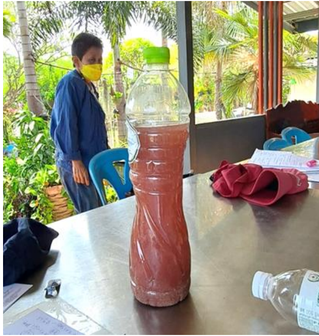
圖 9 農場自製之有機生物製劑，主要原料有蝦醬、雞蛋殼、雞蛋等，用於防治蔬菜病蟲害