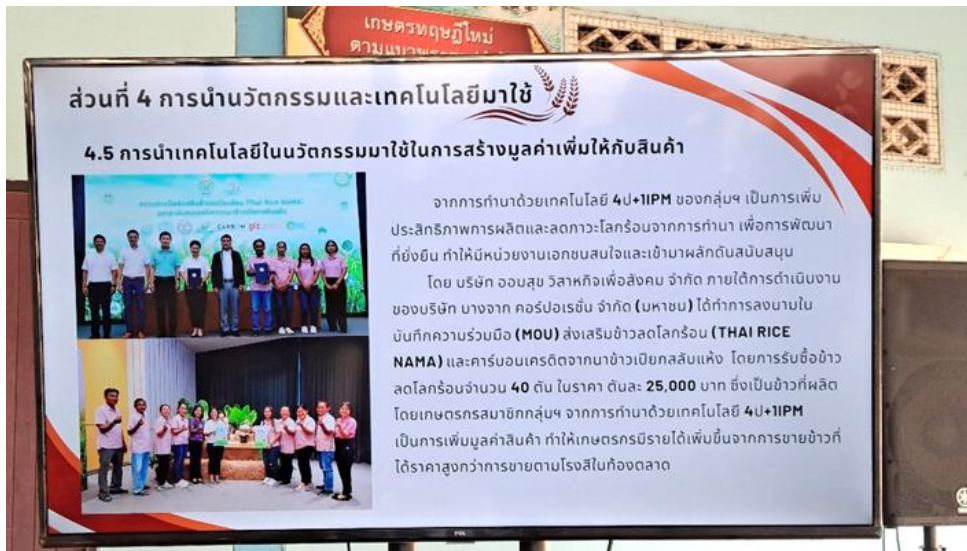
圖 21 Doem Bang 企業與社會企業合作，共同銷售稻米，多元銷售方式增加農民收入。