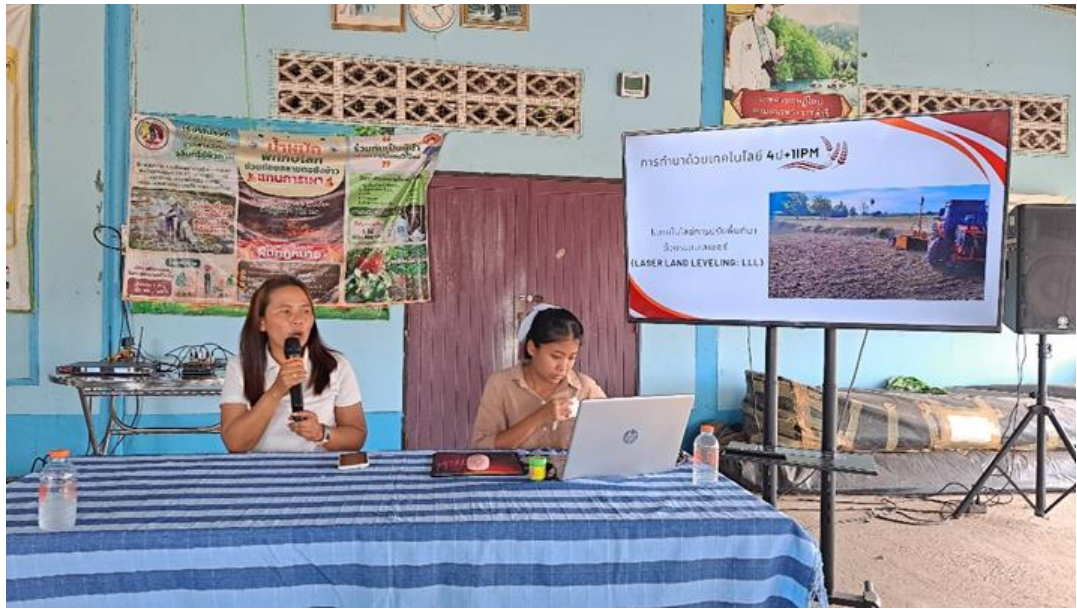
圖 15 採用雷射水平整地機 (Laser Land Leveling) 進行整地，土地平整的精度可達 \pm 2 公分。