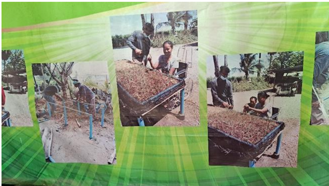
圖 8 高架種植友善身心障礙者