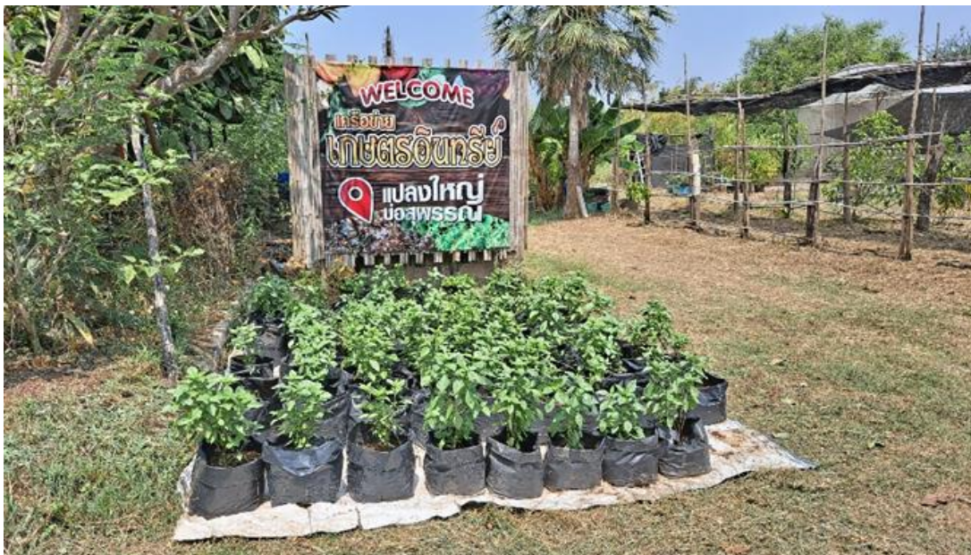
圖 12 農場有機蔬菜育苗