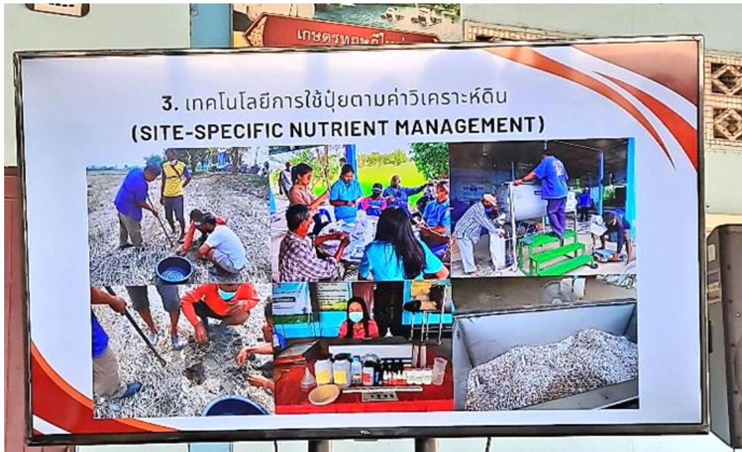
圖 18 了解田區土壤營養成分，進行合理化施肥，達最佳化管理