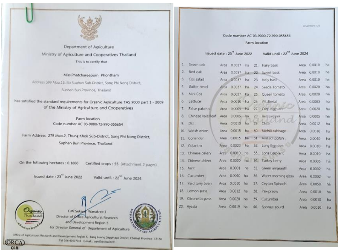
圖 10 官方有機農業認證證書，證書記載有效日期及農作物認證品項等