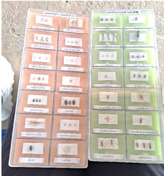
圖 17 製作昆蟲標本，易於農民辨別田間之益蟲或害蟲。