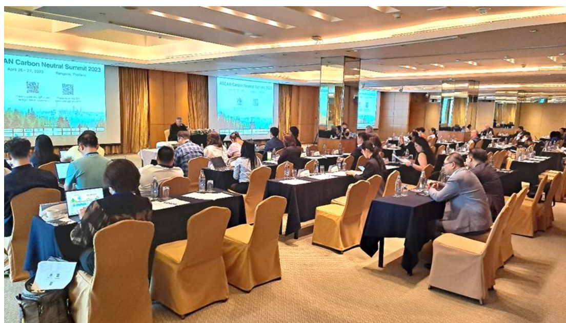
圖 2 東協碳中和高峰會會議