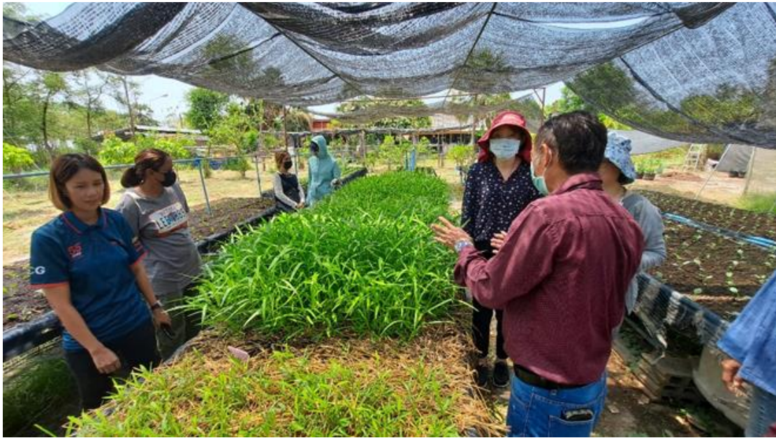
圖 7 有機蔬菜採高架種植，避免淹水並且友善種植人員長期採蹲姿的辛勞