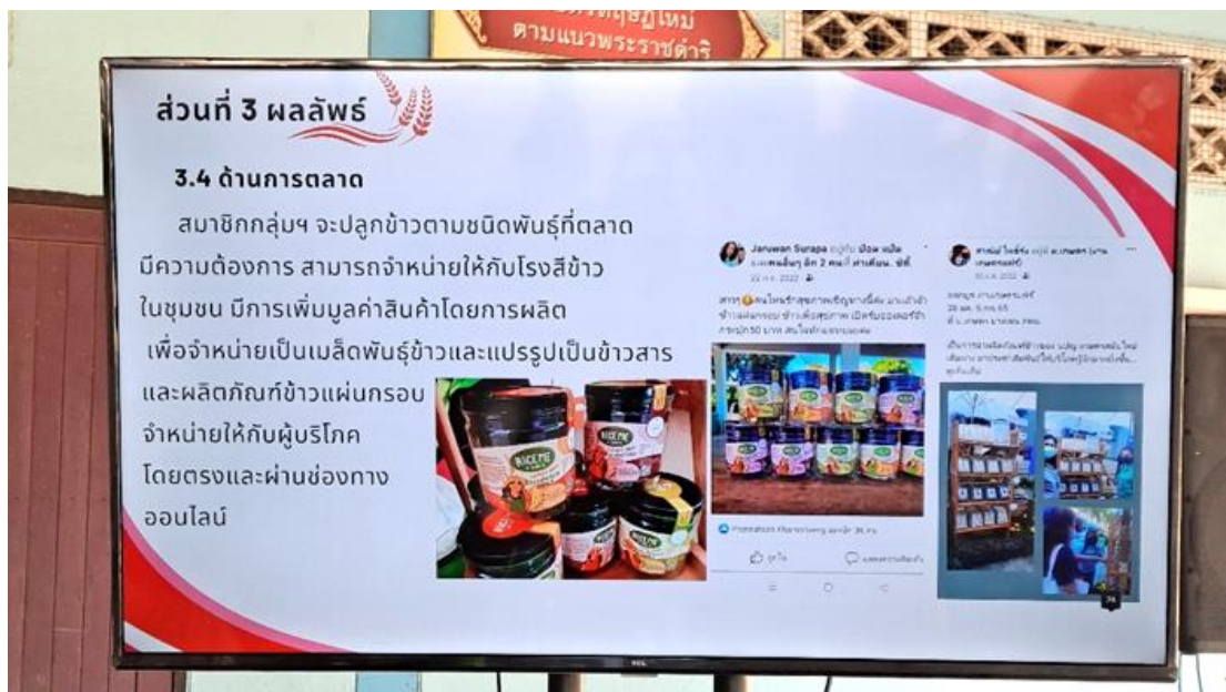
圖 20 Doem Bang 企業成立 RICE ME 品牌，開發許多米製品，於網路與實體店面銷售。