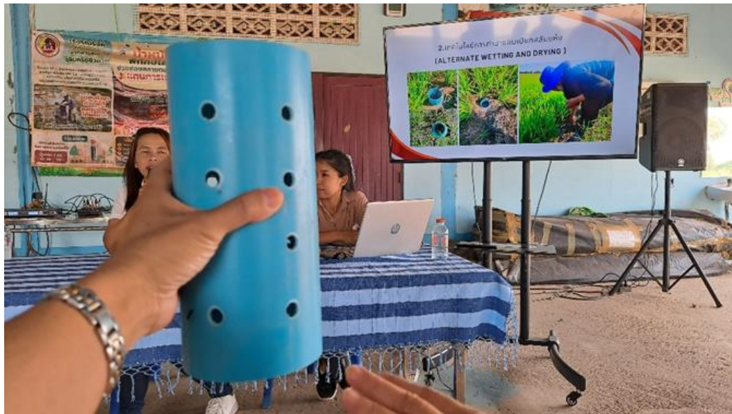
圖 16 直向塑膠管佈設於田區固定地點，精準控制土壤水分之水位。