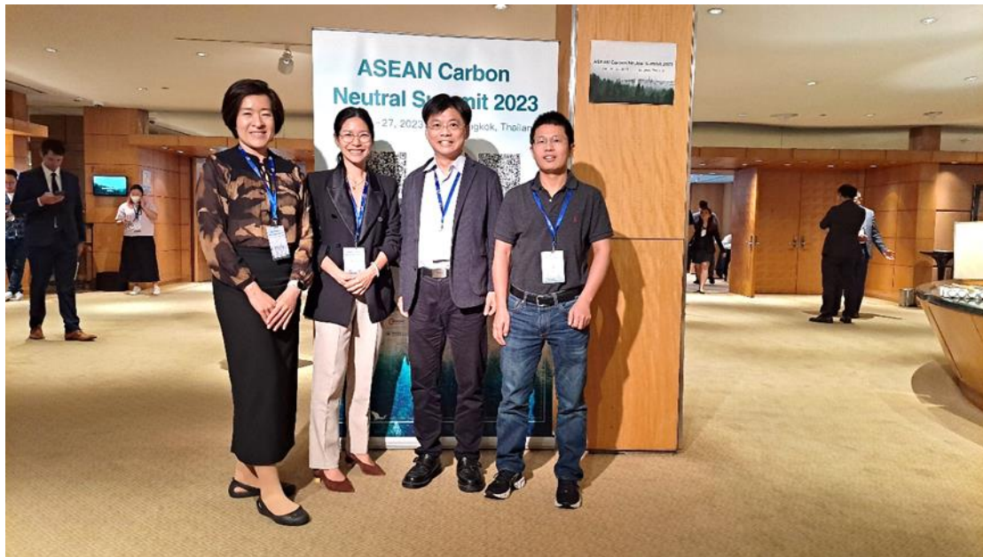
圖 4 東協高峰會臺灣與新加坡及廣州與會代表合影