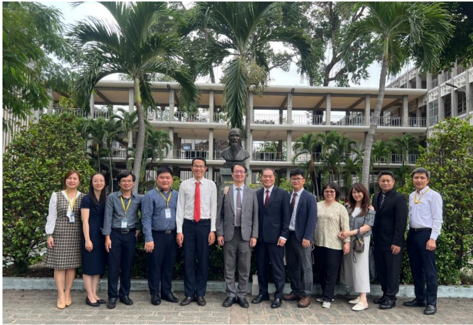
傳統醫學學院與會人員與本次參訪人員合影留念