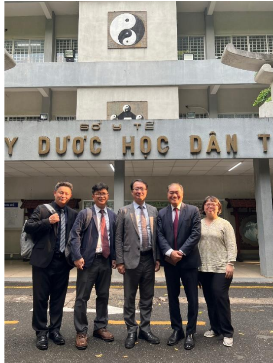
本團人員於駐胡志明市台北經濟文化辦事處合影留念