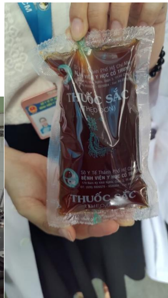
院內煎煮中藥製劑的場域以及成品