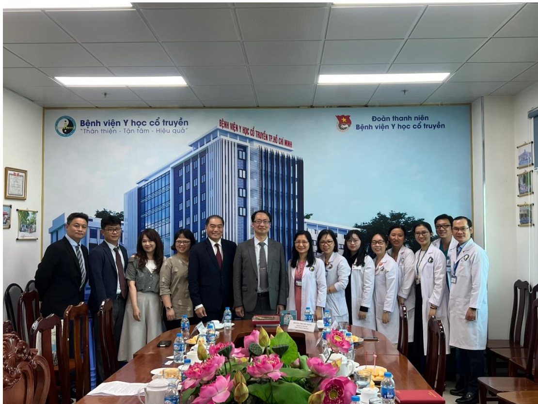
學術交流結束後，醫院與會人員與本所人員合影留念