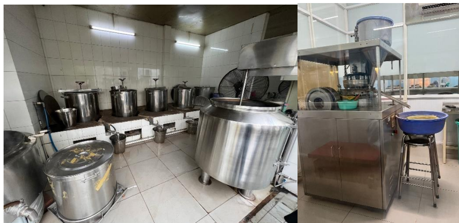
中藥製劑萃取與成品打錠