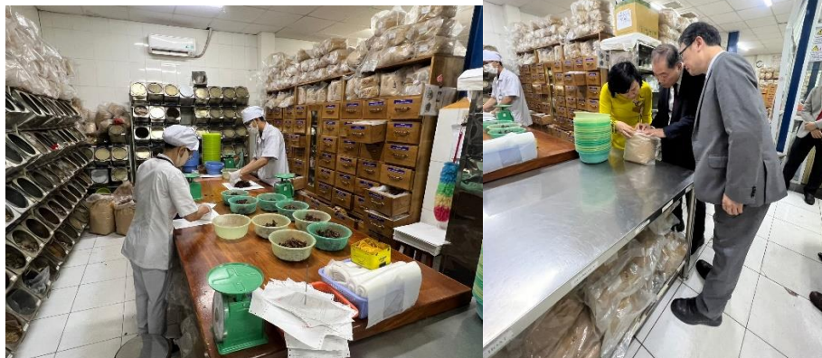
本團人員參觀研究所藥材儲存與取藥場域