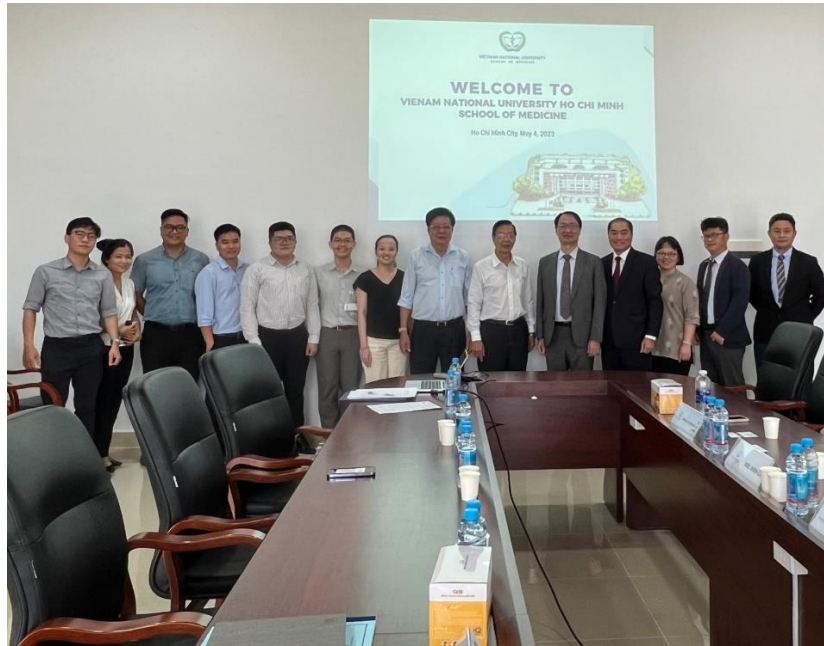
學術交流結束後，醫學院與會人員與本所人員合影留念