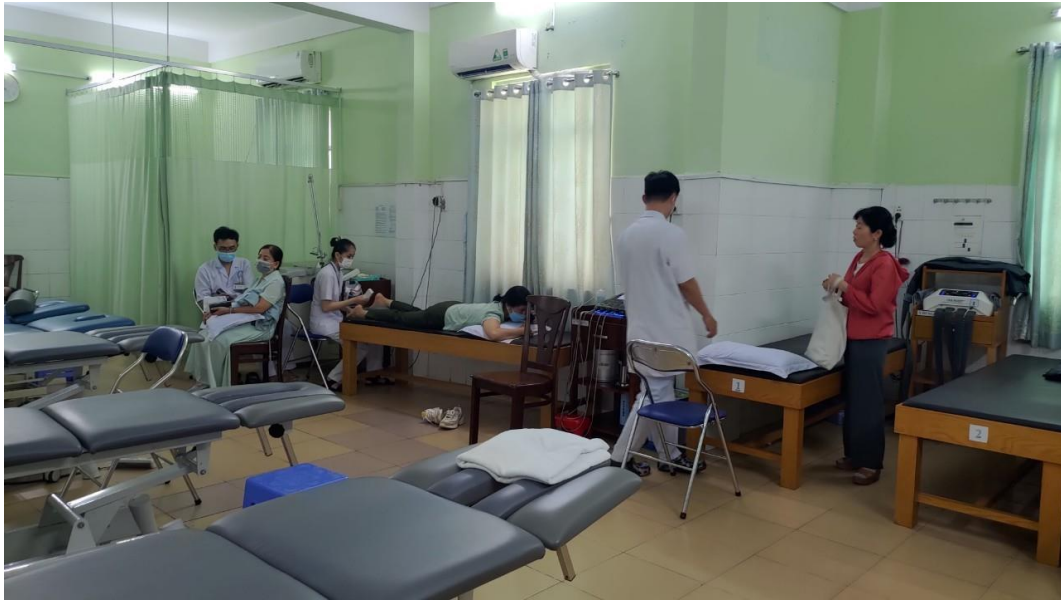
古傳醫學醫院施行推拿場域