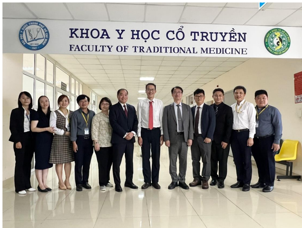
學術交流結束後，傳統醫學學院與會人員與本所人員合影留念