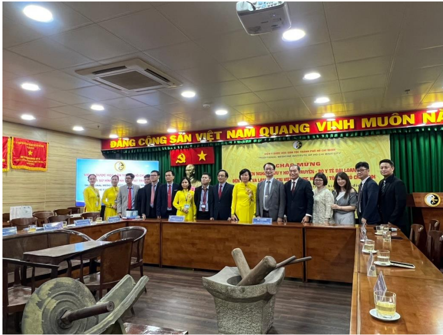
本團人員與民族醫學研究所與會人員合影留念