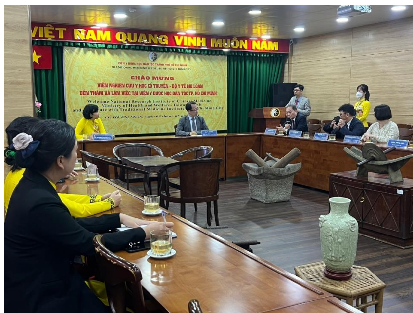
陳參事和賢教授對雙方合作模式給予建議