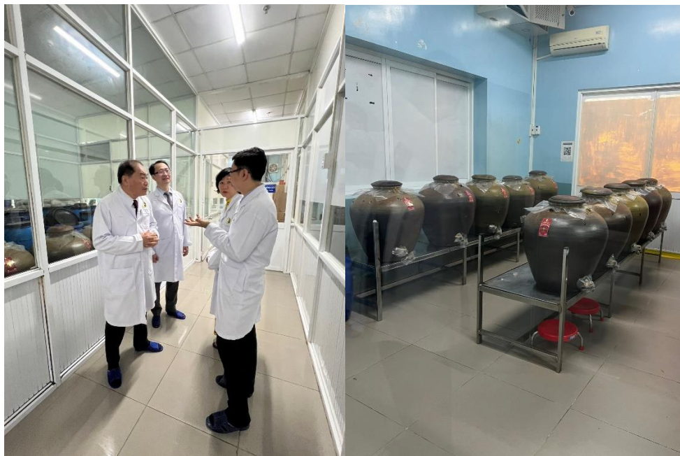
本團人員參觀藥酒製造廠域