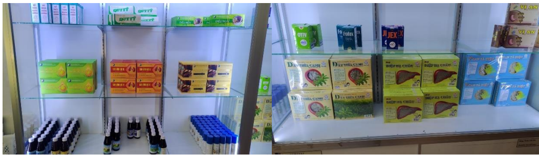
院內研發醫療保健產品