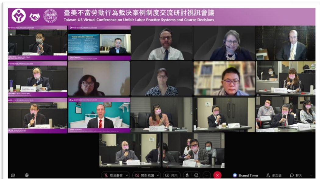
臺、美雙方進行視訊會議之電腦截圖畫面