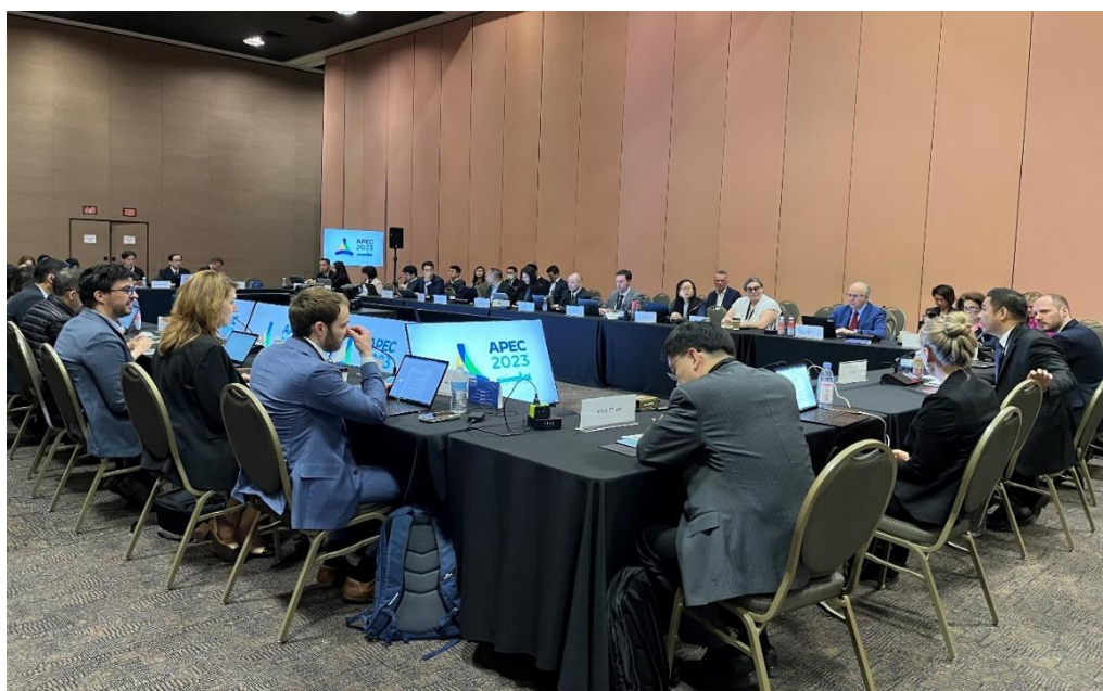
圖 1：各會員經濟體及外部單位出席本年度 DESG1 會議