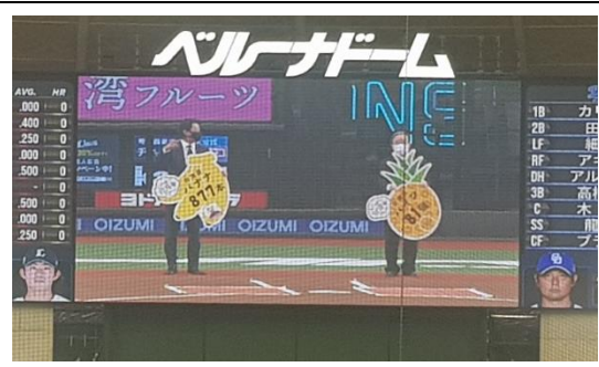
副主委開球前，由 Wismettac Foods 公司岩崎部長與本會農糧署胡署長致贈球團臺灣水果。