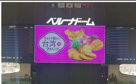
比散過程中也穿插多次臺灣水果宣傳影片(約30秒)。