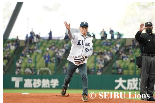
副主委順利完成開球儀式