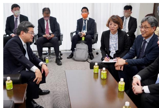
副主委與大下內社長會談。