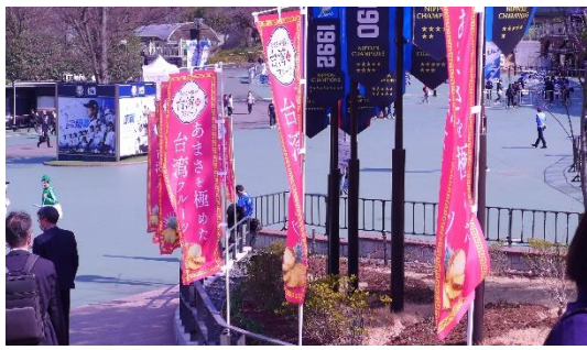
球場周邊佈置了許多宣傳用關東旗。