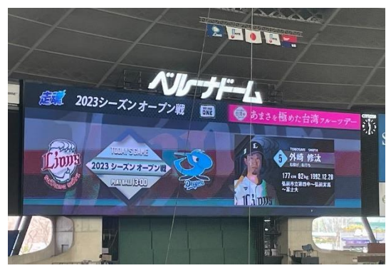
賽前球場記分板(電子螢幕)刊登臺灣水果廣告。