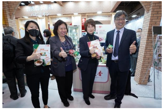
副主委與本會訪團巡場協助國內參展業者行銷推廣 (臺灣農水產館業者)