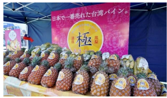
球場前廣場設置臺灣生鮮鳳梨攤位。