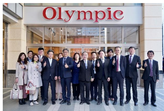
訪團前往日商 Olympic 集團總部拜訪。