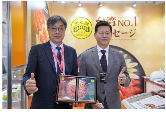
副主委與本會訪團巡場協助國內參展業者行銷推廣 (其他臺灣參展業者)