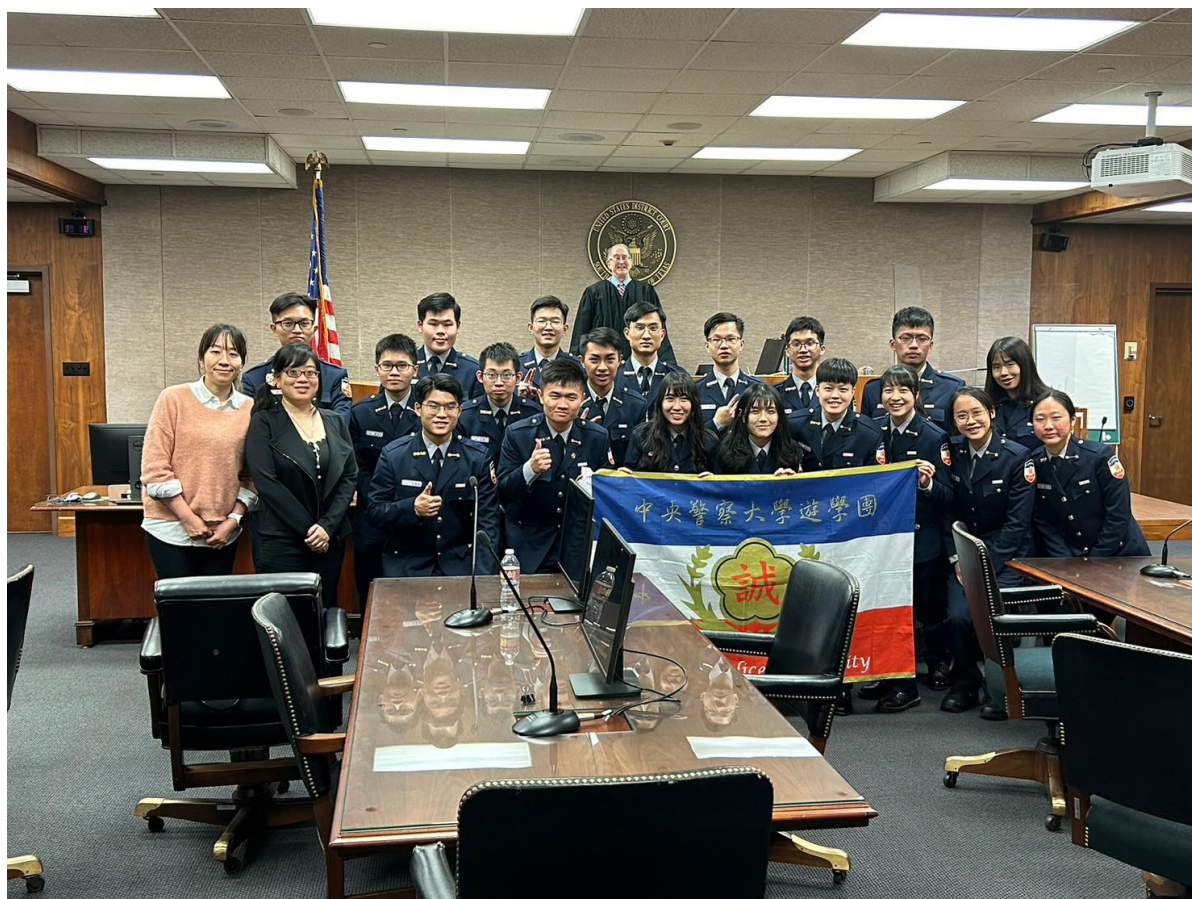
圖 24 本校遊學團與聯邦法院法官合影