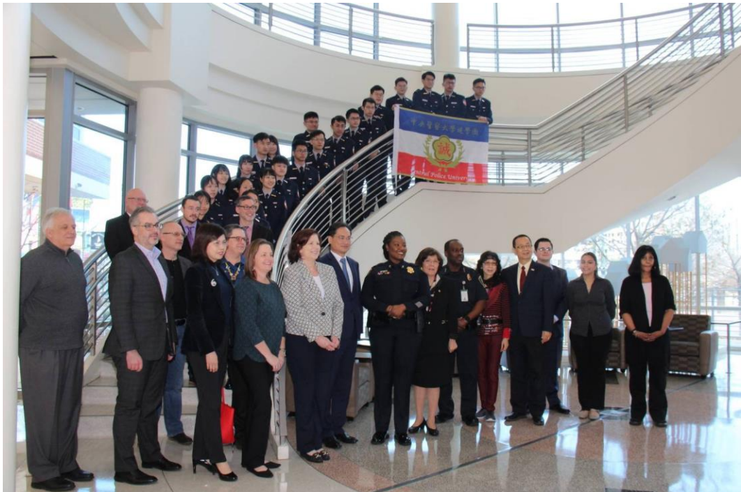
圖 4 姊妹校遊學團於開幕式合照