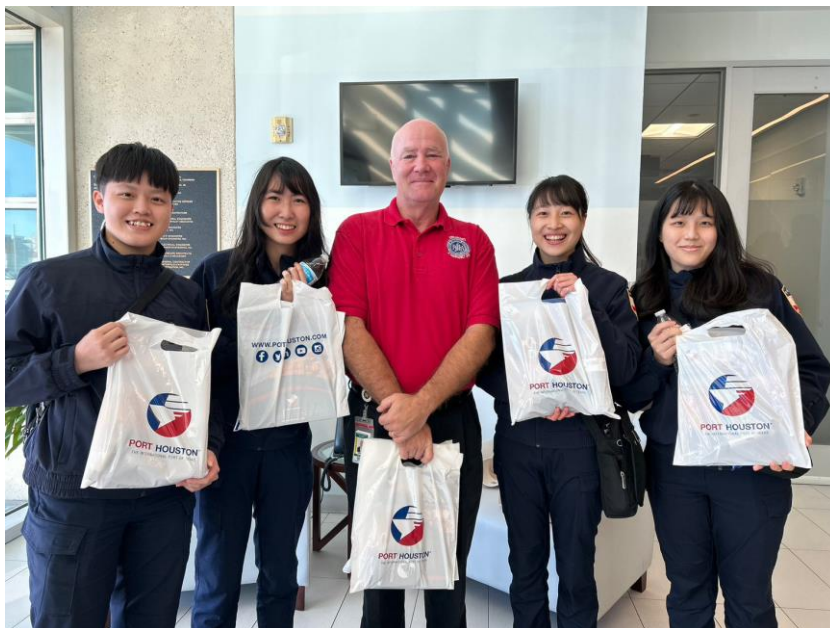
圖 26 港務局局長贈送學生紀念品