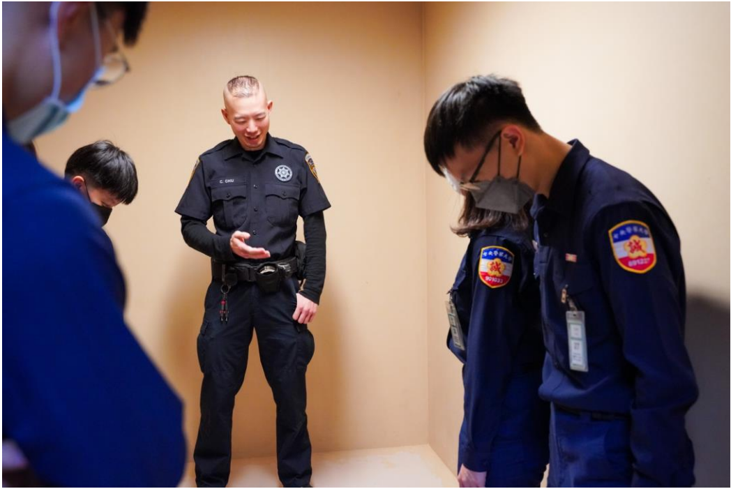
圖 15 學生進入獨居房參觀

同時我們也參觀所內醫療設備以及就醫流程，收容人在所內就醫無須另外負擔費用，而 HIV 陽性之受刑人也沒有另外隔離，若人員在與 HIV 受刑人執行勤務時受傷，將會立即投藥。在我國，婦女得請求攜帶 3 歲以下之子女入監，但在美國無子女入監之規定，懷孕的收容人若分娩後，子女由其家人攜回或者交由社會機構處置。高度監禁區域，多為有精神疾病之收容人，犯下重大惡行者，甚至再設獨立區域，增加牢門分離，其身著黃色獄服以利辨識，且均為獨立牢房，不得放封，參訪過程中，偶有收容人隔著鐵門叫囂、敲打鐵門尋求關注，對學生而言，是十分難忘的經驗。