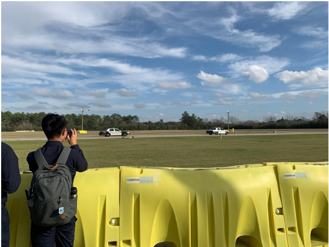
圖 22 HPD 警校教官示範駕訓課程