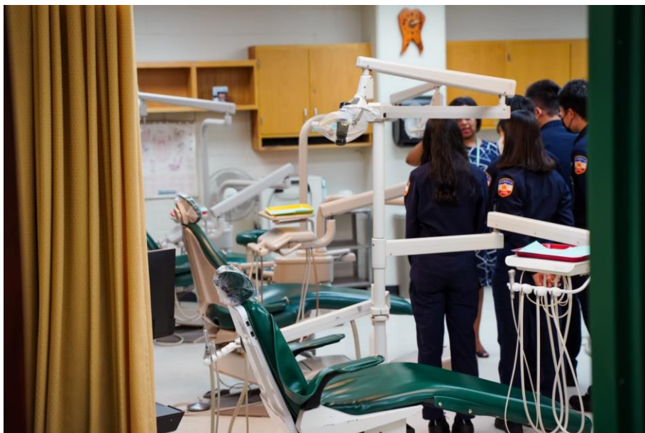
圖 16 看守所內就醫流程說明

同時我們也參觀所內醫療設備以及就醫流程，收容人在所內就醫無須另外負擔費用，而 HIV 陽性之受刑人也沒有另外隔離，若人員在與 HIV 受刑人執行勤務時受傷，將會立即投藥。在我國，婦女得請求攜帶 3 歲以下之子女入監，但在美國無子女入監之規定，懷孕的收容人若分娩後，子女由其家人攜回或者交由社會機構處置。高度監禁區域，多為有精神疾病之收容人，犯下重大惡行者，甚至再設獨立區域，增加牢門分離，其身著黃色獄服以利辨識，且均為獨立牢房，不得放封，參訪過程中，偶有收容人隔著鐵門叫囂、敲打鐵門尋求關注，對學生而言，是十分難忘的經驗。