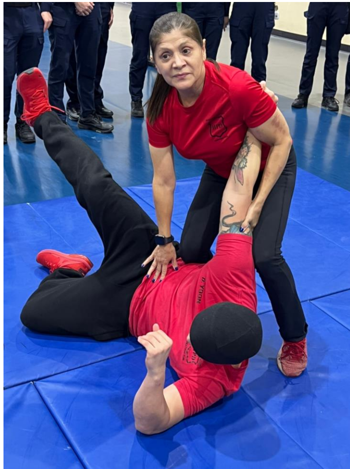
圖 20 HPD 警校教官示範演練

學員在學校接受體能訓練包含制伏人犯、電擊槍射擊、自主重訓等，教官為現役警察，其表示若需要出勤時，仍須配合勤務指派出動。其中一名女性教官年近 60 且體格嬌小，警察學校也負責現職警察的在職訓練，她表示無論是學員或員警，體能標準不分男女、年紀均相同，所以就算是她也要達到一樣的標準才能合格，她並示範如何制伏另一位體格健壯的教官。