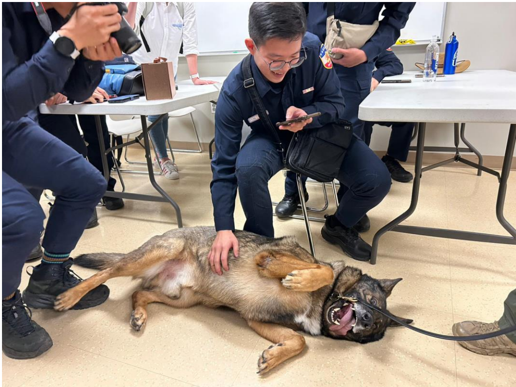
圖 27 本校學生與 K9 互動

休士頓警局所飼養的警犬均為公犬，警犬不會進行結紮手術，若飼養母犬一起訓練，會有發情的問題，對公犬之穩定性影響較大。而每隻警犬均指派專責警察負責訓練，下班後也必須帶回住所，24 小時相處，警犬退役後也是優先考量負責員警是否願意領養。警犬隊的警車配色與一般警車有異，車身部分為全黑，避免民眾與一般警車混淆，並拆掉後座座椅，讓警犬可以安置在後。而警犬的任務有許多種，在訓練時有單功能取向或雙重功能取向的，包含：緝毒、炸彈、救生、追緝等，也會配合巡邏勤務。警犬隊亦示範警犬如何聽令進行咬人、停止、追捕等動作，可以觀察到警犬完全聽命行事，訓練有成。