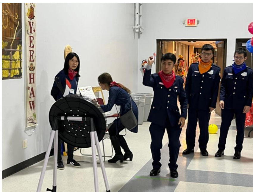
圖 32 TECO 特地安排團康活動