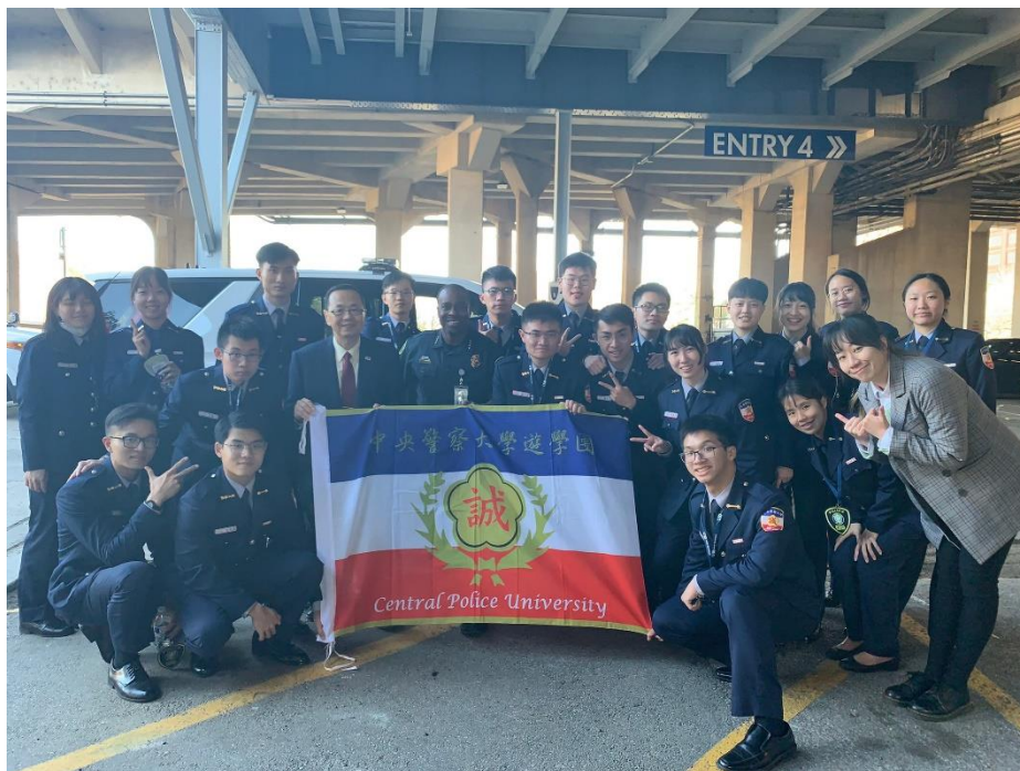
圖 6 參訪 UHD 校警局