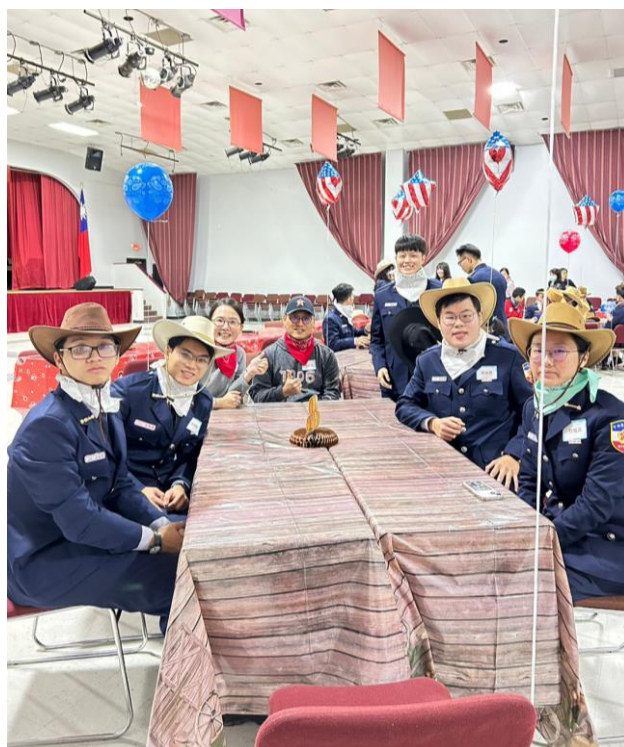
圖 31 TECO 安排臺灣留學生與本校學生同桌互動

此次出訪，TECO 特地安排晚宴接待 UHD 教師與本校學生，並邀請在休士頓進修的臺灣留學生，桌次安排本校學生與臺灣留學生混坐，兩者年紀相仿，讓他們用餐時能夠增加互動，分享彼此在休士頓的所見所聞。晚宴具有德州特色，TECO 致贈每位同學牛仔帽跟領巾，讓同學能入境隨俗，並且安排團康小活動讓各桌競賽，過程融洽、賓主盡歡。