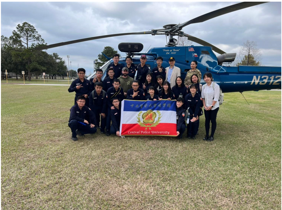
圖 28 本校遊學團與 Harris 郡警局空勤部隊合影

Harris 郡警校也有空勤課程，教官駕駛直昇機前來，並說明平常負責之勤務內容主要是自高空搜尋或追捕，駕駛座隔壁是技術人員的座位，可以檢視直昇機上的攝影機畫面，並負責與地面單位聯繫，而參訪當日恰逢其接獲勤務通知須出勤，我們一行人還有幸觀賞到直昇機起飛。