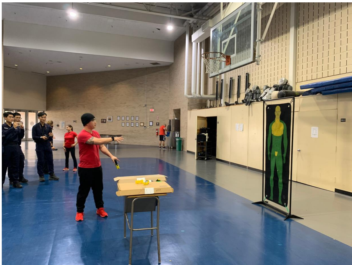
圖 21 HPD 警校教官示範電擊槍（Taser）

而美國近年增加使用電擊槍（Taser），電擊槍約有 5 萬伏特的電力，通電瞬間肌肉會繃緊無法動彈，也減少嫌疑犯致命的可能，增加使用非致命武器是目前美國警政的趨勢。電擊槍擊發時無後座力但仍會有巨大聲響，為免其他同仁誤會是擊發手槍，操作的標準作業流程是喊出「Taser! Taser!」後再擊發，擊發後射進人體的接頭有倒鉤，讓嫌犯不易拔除，最新一代的電線連結到彈匣無法被扯斷，若犯嫌想要從彈匣側扯除，只會將線愈拉愈長。