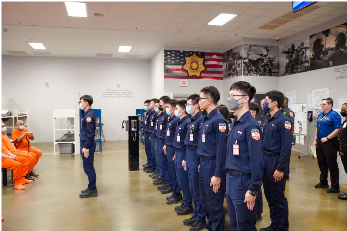
圖 17 Brothers in Arms 計畫

美國社會十分敬重退役軍人，看守所中針對犯下罪行的退役軍人設有 Brothers in arms 計畫，協助他們復歸社會，重新整合至社區中，所方安排職業訓練協助其就業，其為集中住宿，約 40-50 人住在上下舖的舍房中，中央為長排餐桌，另設有可放封的區域，可以自主運動，管理強度較低且光線明亮，還有對外的電話可以與親友聯繫。本次參訪也遇到曾派駐香港之退役軍人，其用中文與學生相談甚歡。對看守所而言，如何協助更生使其不再犯才是最重要的。參訪結束後， Dr. Harris 請學生向退役軍人致意，學生便自發性的整隊敬禮，在場均感動萬分，甚至有部分收容人落下眼淚。 Dr. Harris 平常即協助 Brothers in arms 計畫，她表示可以看得出來在場的收容人都十分感動，敬禮儀式讓他們想起以往從軍的歲月，重新喚回榮譽感。