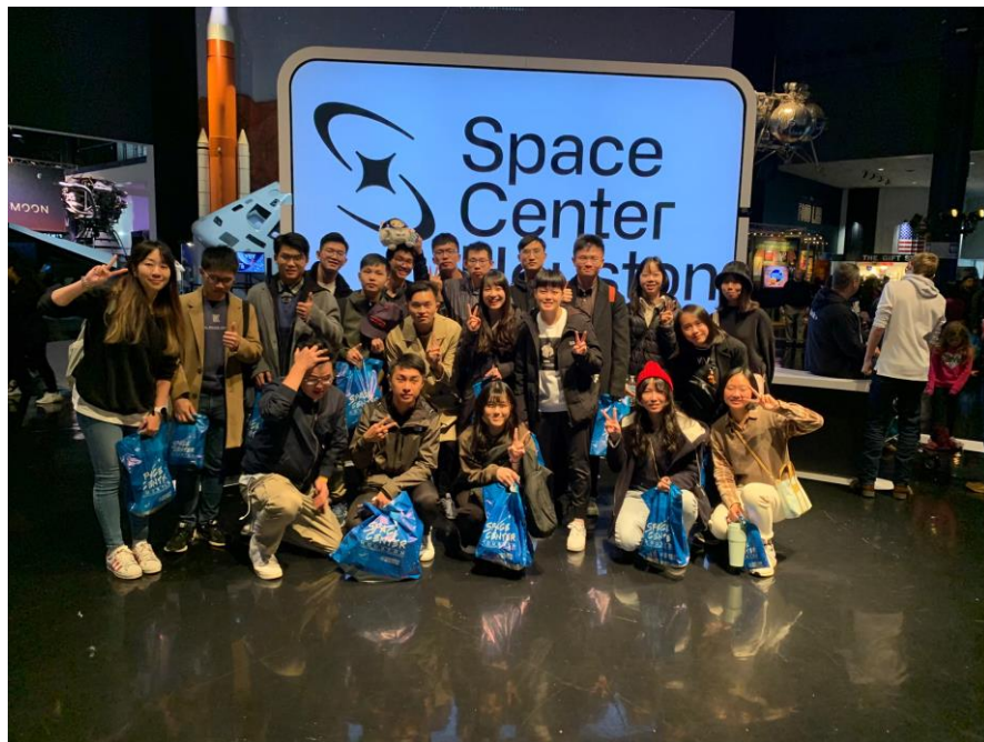
圖 34 本校遊學團於 Space Center 合影