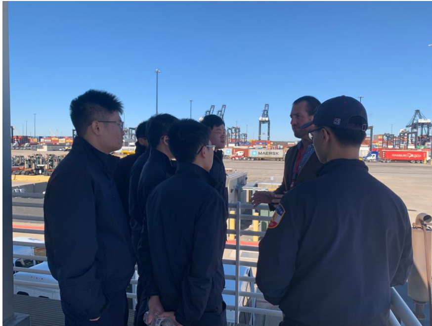
圖 25 休士頓港工作人員解說貨櫃檢查流程

休士頓港是國際港，是美國外國貨物處理量最大的港口，算上國內貨物後也是美國第二大港口，僅次於南路易斯安那港。就全世界來看，休斯敦港也位居第 10 位。因此休士頓港貨物出入關的檢查量十分龐大，其腹地廣大，也設有貨櫃轉運站，以利檢查。海關人員表示檢查貨品的難處是不易檢驗，他們常會檢視貨櫃是否具有輻射性，以避免危險物品運至美國，但其實香蕉、磁磚等都具有輻射性，在檢驗上需要更加用心避免失誤。本次遊學團多為國境警察學系的學生，海關人員也期勉同學能夠在國境兩端共同為治安努力。