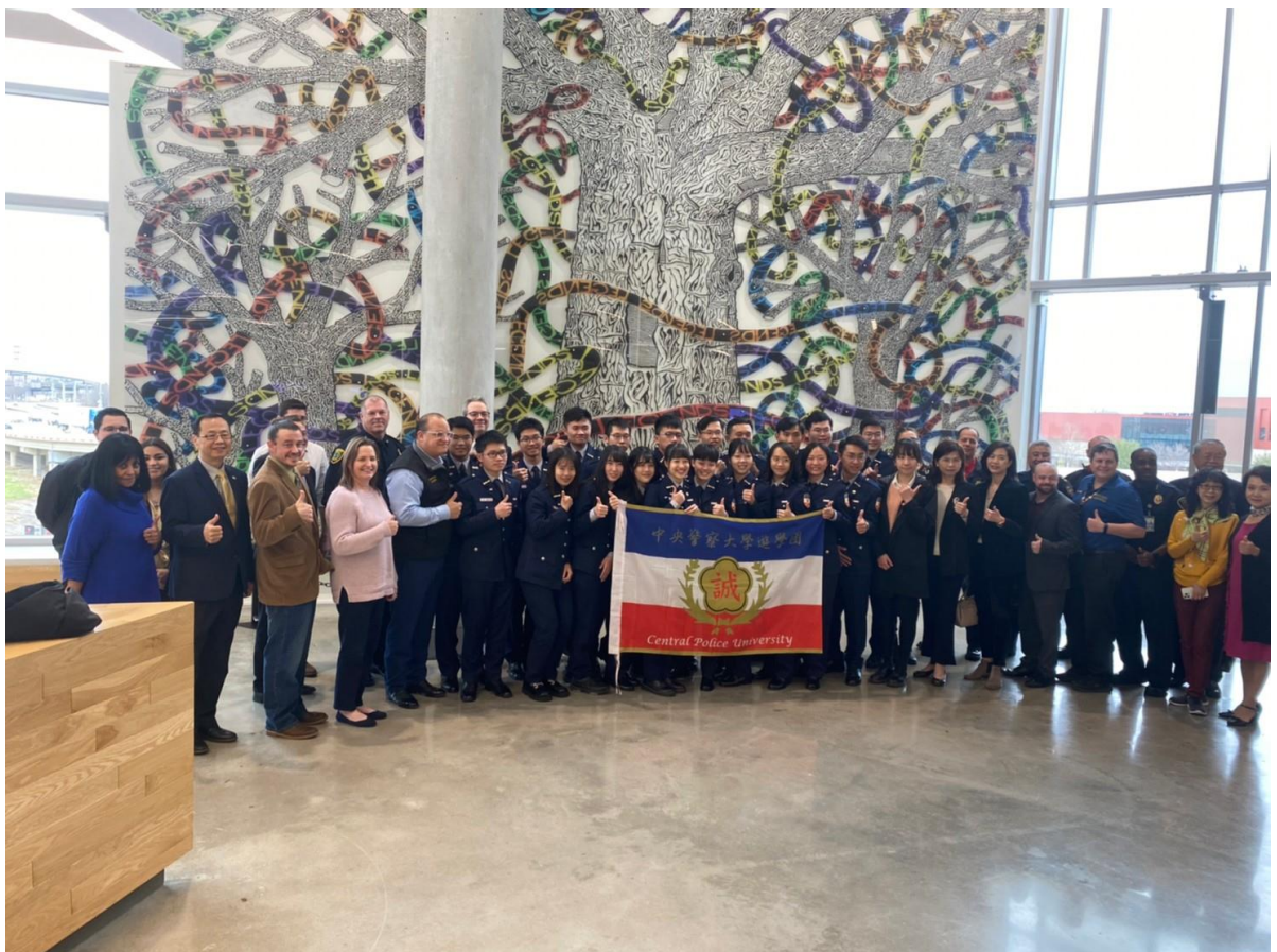
圖 37 本校遊學團與 UHD 教師以及實務機關代表於結業式合影