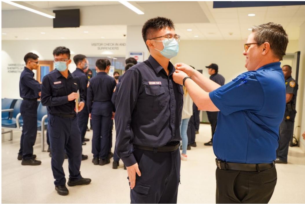
圖 18 所方致贈徽章

Harris 郡看守所隸屬於 Harris 郡警局，參訪結束後所方逐一贈警長徽章，並別在學生制服領子上，學生也感到很榮幸能獲得此紀念品。