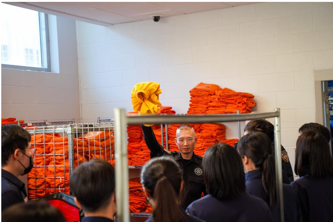
圖 14 獄警說明獄服顏色的不同

Harris 郡看守所現有 1 萬多名收容人，每日新收及出所人數眾多，人員流動頻繁，人犯轉移均透過地下通道進行，地下通道連結附近警局、法院等執法機構，因監所亦為執法機構的一環，附近居民對於看守所的反彈聲浪不大。收容人在內著橘色獄服，罪行重大、心神喪失、具危險性的收容人則著黃色獄服，以利辨識。若有違規或者自殘傾向的收容人，會被關到獨居房，獨居房中央地板上設有一個大型排水孔作為廁所使用，排水開關則設於門外，由管理人員啟動。若有人入住，牆面會另鋪上泡棉牆面，避免其受傷。