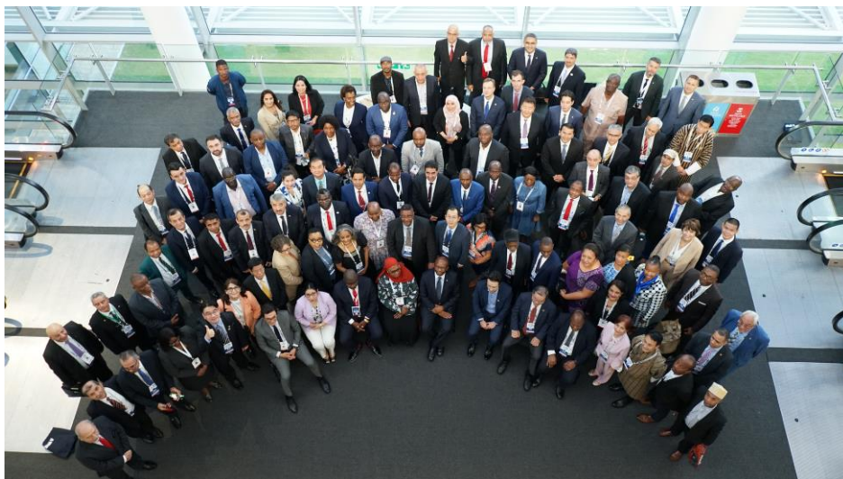
A-WEB第5屆會員大會會員代表合影