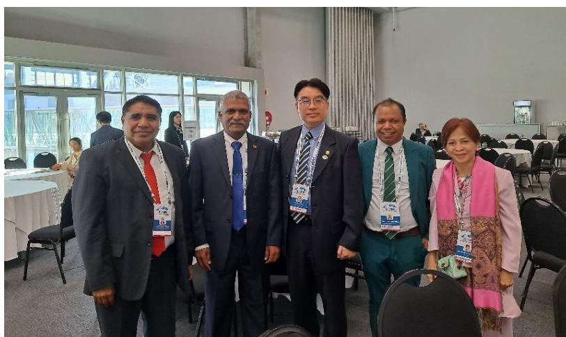
蒙委員志成與亞洲區新任執行委員國代表合影