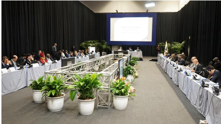
A-WEB臨時執行委員會議開會情形

委員案：任命我國中央選舉委員會及巴勒斯坦中央選舉委員會為監察及審計委員。(四) 第5屆會員大會議程案。討論事項：(一) 下次執行委員會會議主辦國案：由下任副主席國決定是否主辦下次執行委員會會議，若無主辦意願，則由秘書處主辦。(二) 建立A-WEB選舉最佳實踐/創新及獎項入口網站。會議至下午6時結束。