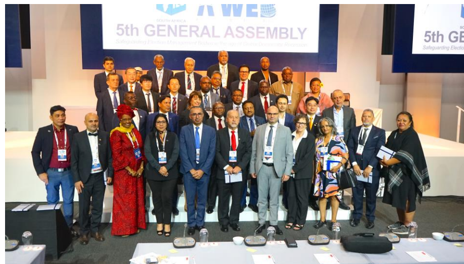
執行委員國代表會後合影