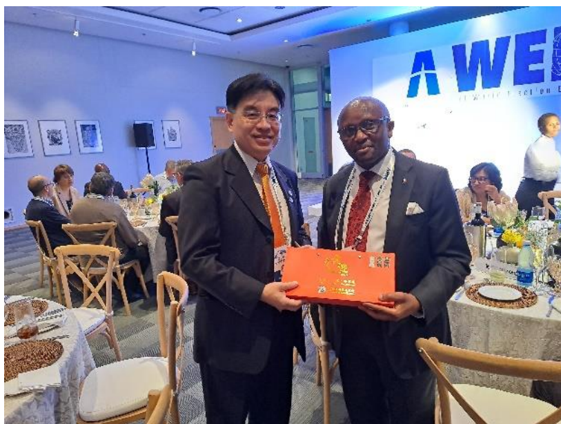
蒙委員志成與 A-WEB 新任主席、南非選舉委員會主任委員 Mosotho Moepya 合影

(2)11個新任執行委員，分別為：非洲區利比亞高等國家選舉委員會、模里西斯選舉委員辦公室及獅子山共和國國家選舉委員會；美洲區厄瓜多國家選舉委員會、瓜地馬拉最高選舉法院及秘魯國家選舉法院；亞洲區印尼總選舉委員會、馬爾地夫選舉委員會、菲律賓選舉委員會及東帝汶國家選舉委員會；大洋洲區薩摩亞選舉委員會辦公室。