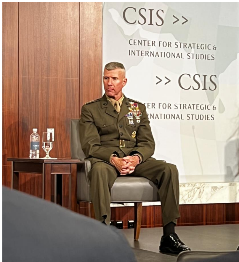
2022.7.18 A Discussion with the Assistant Commandant of the Marine Corps