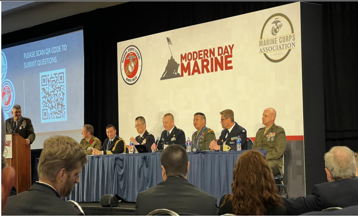
2022.5.10-13 Modern Day Marine Expo