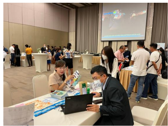
武陵農場與口譯人員推介情形