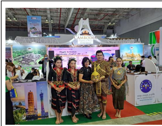
鄰近柬埔寨攤位特色