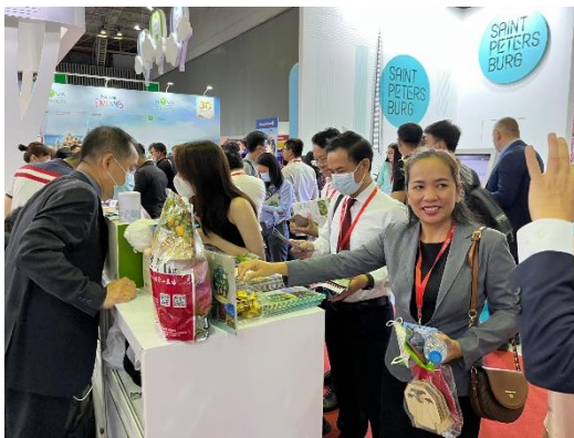
本會展會推介情形