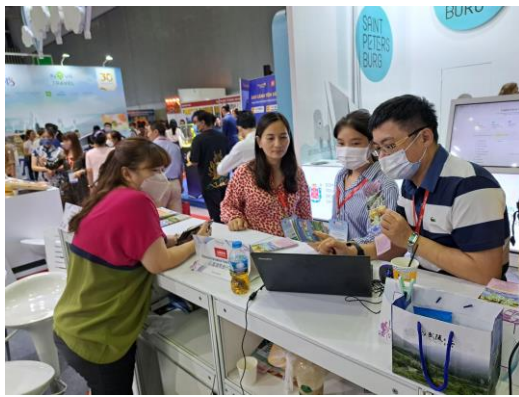
本會展會推介情形