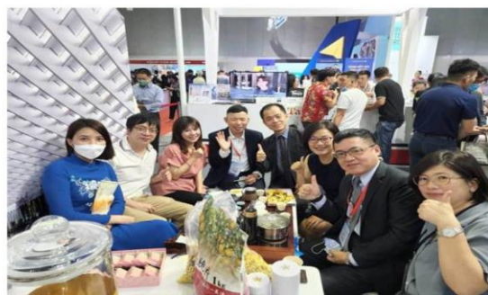
武陵農場前進越南參加年度旅遊盛會-ITE胡志明市國際旅展，長青茶大受歡迎。