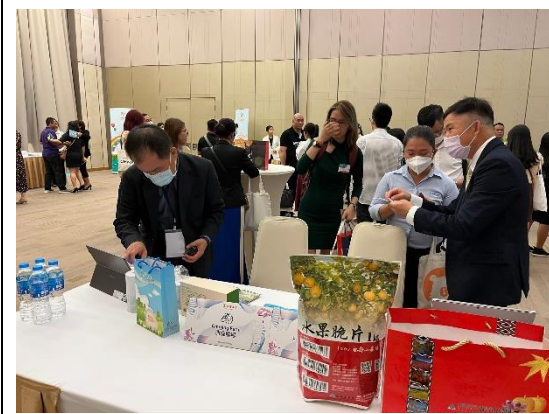
清境及福壽山農場推介情形