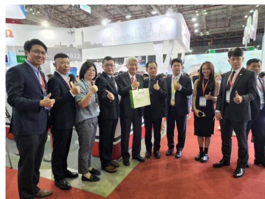
石瑞琦大使與本會人員合影