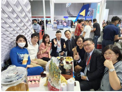
本會農場產品參與現場品茗活動