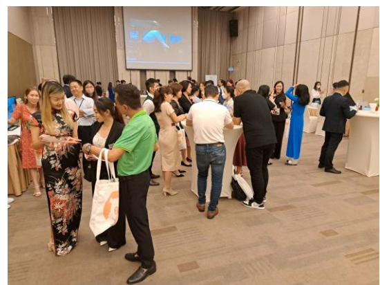
推廣會現場人潮密集