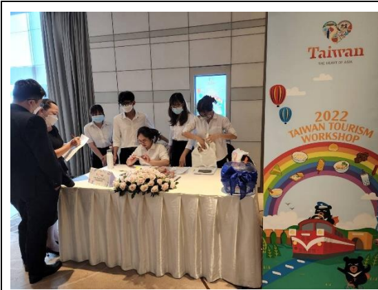
臺灣觀光推廣會入口簽到席