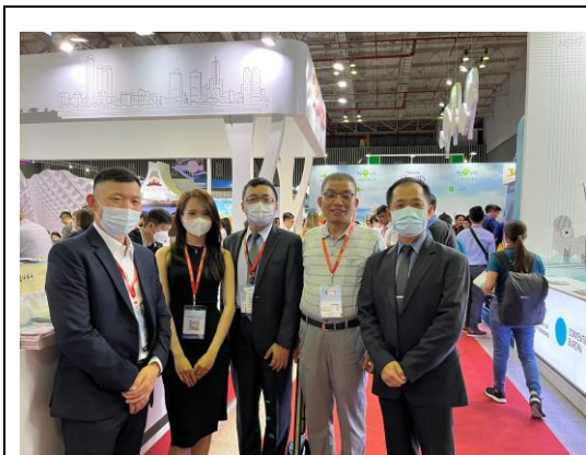
農場人員與旅行同業合影

展場整體熱鬧、氣氛升溫，本會於展位聘請 2 位口譯人員分別為當地就讀大學的越南華僑及越南本地的大學生，無論中文及越南文均佳，且曾有相關類似工作經驗，個性積極活潑，頗瞭臺灣及越南消費者旅遊習慣與喜好，能適時發揮以在地語言解說農場特色，效果甚佳。農場亦把握機會適時推出拍照上傳至 FB 打卡換小禮品活動，成功宣傳並吸引參展民眾駐足拍照，此展為活動獲得不錯的迴響，不僅為觀光外交注入正面的意義，也讓越南朋友知道了臺灣的特色並瞭解多元文化；旅展現場越南朋友倘繞行臺灣館，可感受濃厚臺灣味，並藉由以吃喝相互結合等體驗，帶來佳評如潮，給來臺灣館參觀越南民眾不同以往全新體會。