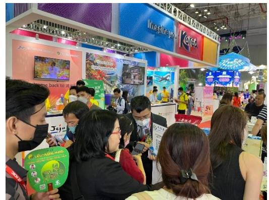
本會展會推介情形