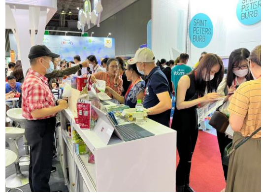
本會展會推介情形