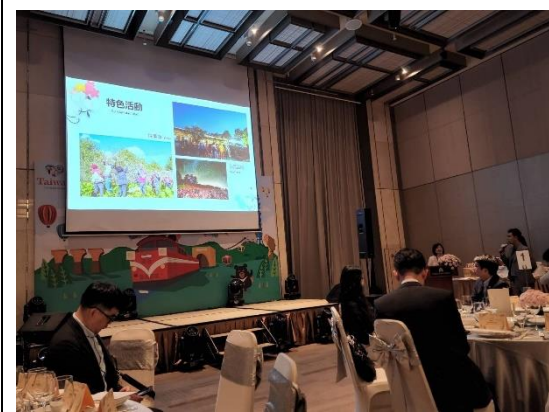
本會人員進行旅遊簡報