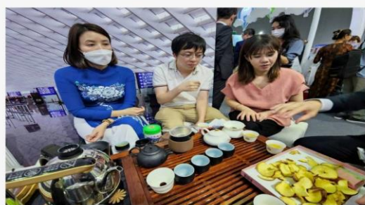
觀光局辦理疫後台灣旅遊業者「首發團」，在越南參加年度旅遊盛會-ITE胡志明市國際...

武陵農場第一次參加觀光局辦理的疫後台灣旅遊業者「首發團」，到越南參加年度旅遊盛會-ITE胡志明市國際旅展，6天的旅展中，武陵農場的長青茶現泡試喝，現場民眾稱讚，詢問度高，農場人員行銷介紹，可上農場官網訂購。