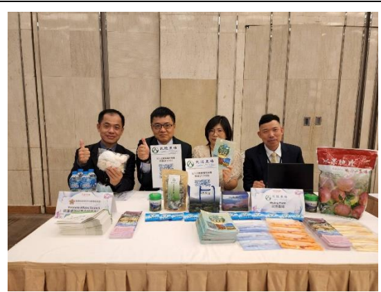
本會及農場推廣人員