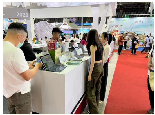
本會展會推介情形

針對旅遊同業、媒體記者或展現較大興趣赴臺旅遊的民眾，各農場均運用平板電腦，透過螢幕中照片、影片及當地文字加以介紹，獲得良好回響。本會及農場所提供之各式文宣品，包含中、英文版、越語版紙本摺頁，搭配農特產品樣品展示，另對於洽談較熱列之民眾，另備有櫻花、紫藤口罩、綿羊鑰匙圈、茶包、保養品試用組等小禮品贈送，至會展最後一日均踴躍索取一空，宣傳成效