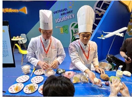
鄰近越捷航空試吃活動

展場整體熱鬧、氣氛升溫，本會於展位聘請 2 位口譯人員分別為當地就讀大學的越南華僑及越南本地的大學生，無論中文及越南文均佳，且曾有相關類似工作經驗，個性積極活潑，頗瞭臺灣及越南消費者旅遊習慣與喜好，能適時發揮以在地語言解說農場特色，效果甚佳。農場亦把握機會適時推出拍照上傳至 FB 打卡換小禮品活動，成功宣傳並吸引參展民眾駐足拍照，此展為活動獲得不錯的迴響，不僅為觀光外交注入正面的意義，也讓越南朋友知道了臺灣的特色並瞭解多元文化；旅展現場越南朋友倘繞行臺灣館，可感受濃厚臺灣味，並藉由以吃喝相互結合等體驗，帶來佳評如潮，給來臺灣館參觀越南民眾不同以往全新體會。