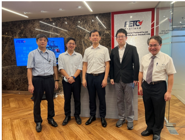
圖 3 於台灣 ETC 團隊拓點辦公室稽核情形