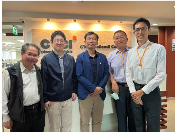
圖 4 於中鼎公司拓點辦公室稽核情形

包案件之投標，該公司有融資方面的需求，期望我國能設立出口信貸機構(Export Credit Agency，ECA)，讓工程產業在未來進軍海外市場時能有更足夠的資金支持，另亦期盼我國政府能致力於與他國締結避免雙重課稅之協定等，以利提高台商競爭力，工程會表示相關議題涉及工程產業輸出，後續將與相關部會於工程產業全球化平台會議共同討論；。