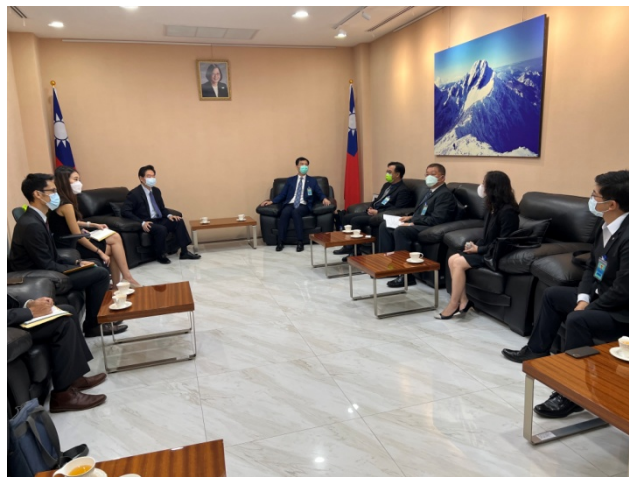
圖 2 於駐泰國代表處交流情形

有限公司為國內大型統包工程業者，以及遠通電收公司具有策略性地將臺灣 ETC 經驗發展到海外，早年先以參賽取得 ITS 大獎打開知名度後，再進而向東南亞等國輸出多車道自由流(M-Flow)的成功案例，後續寄望駐處仍持續給予更多協助及商機引薦，吸引我國工程業者持續來到泰國市場。另針對大使所提協助泰國曼谷水患治理問題，我國在此方面已有成功經驗，先前也曾組團赴亞洲開發銀行專題介紹「員山子分洪道」案例，獲國際人士肯定，後續回國後將與經濟部水利署等機關研議相關議題，再提供成功案例予駐處參考。