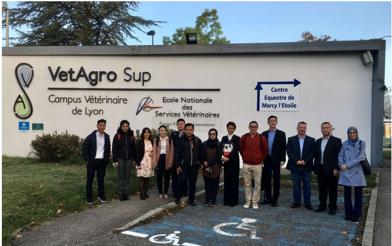
圖三、活動參與成員於 VetAgro Sup 及 ENSV-FVI 合照