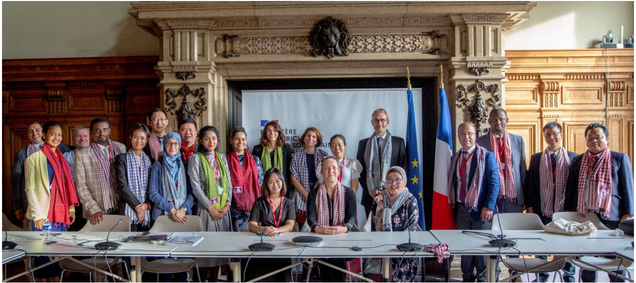
圖一、活動參與成員於法國農業部合照