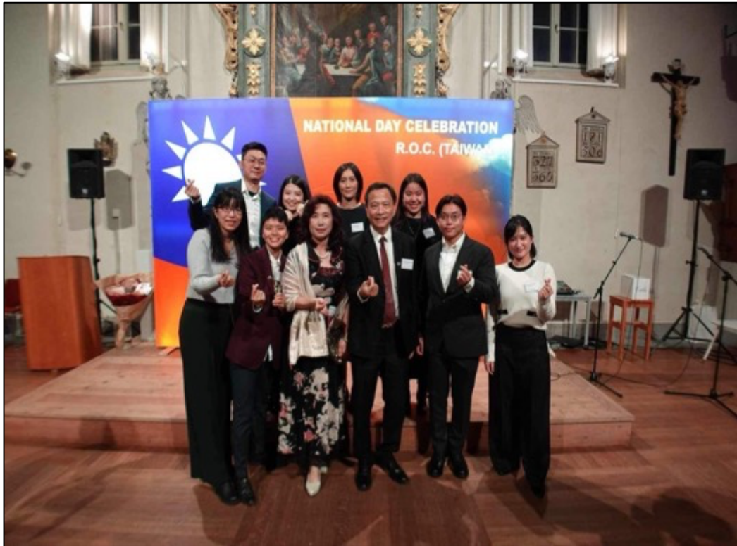
圖3：我國駐瑞典大使館邀請參加民國112年國慶晚宴