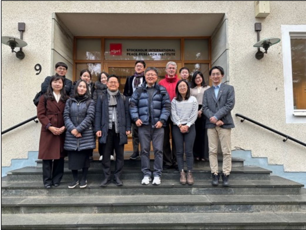
圖5：大韓民國（南韓）國防部主計局與 SIPRI 研究員合影