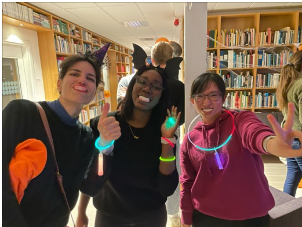
圖4：參加 SIPRI 萬聖節團體活動