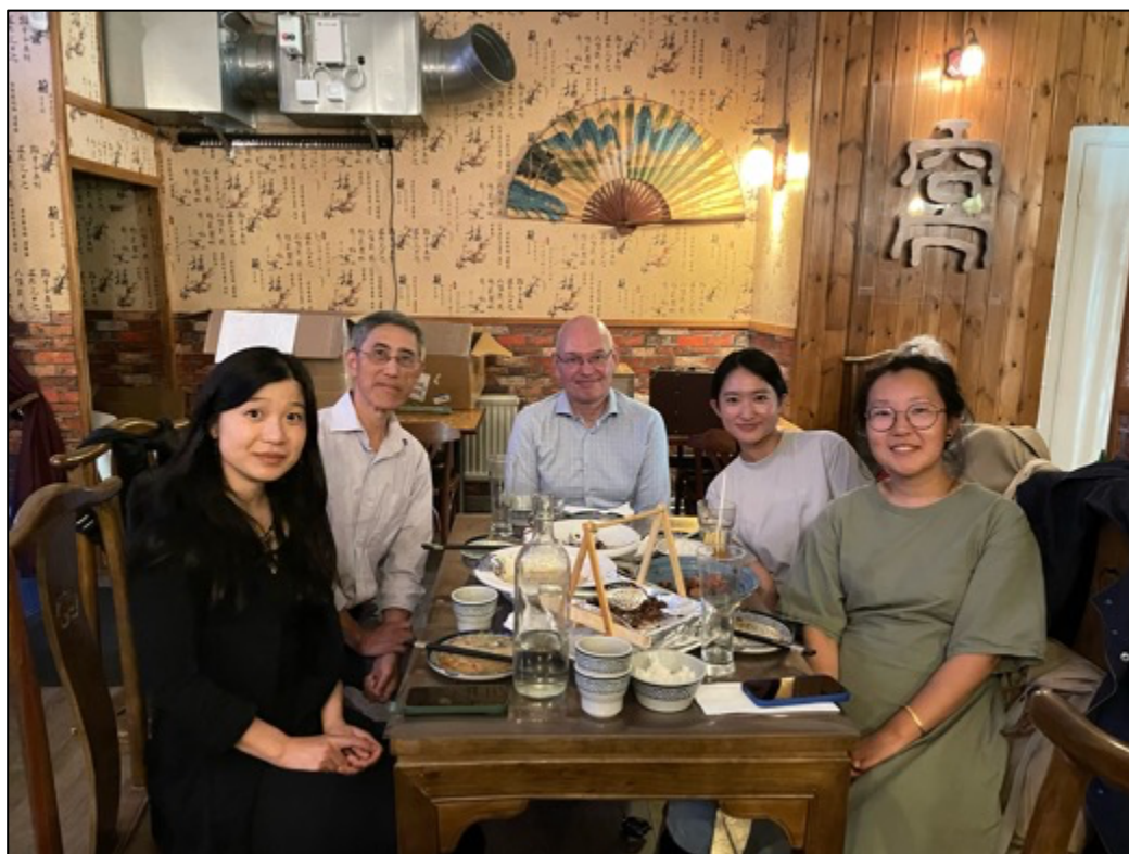
圖8：結訓返國前與 SIPRI 研究主管及東亞小組研究員合影