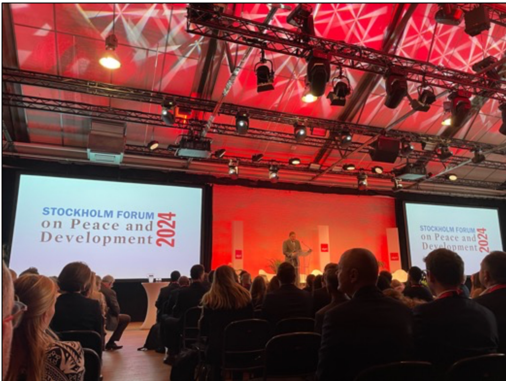
圖6：參加 SIPRI 2024年和平與發展論壇