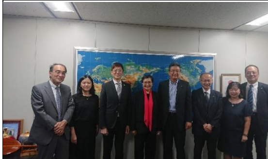
拜會 JATA(日本旅行業協會)