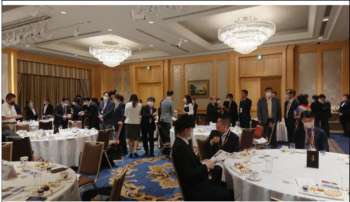
睽違 3 年，台日業者首度實體辦理商談推廣會，現場交流氣氛熱烈