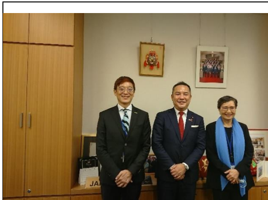
拜會日本國會鈴木英敬眾議員