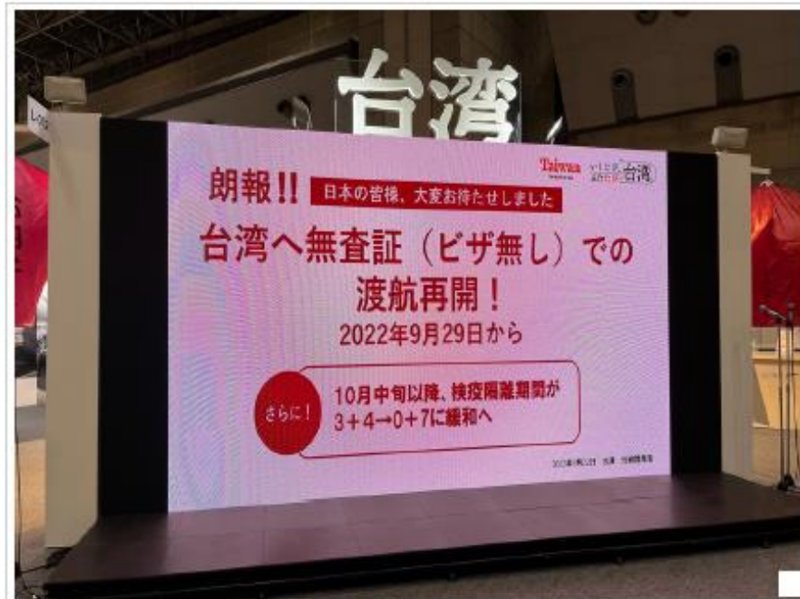
ブースではビザなし渡航再開決定を告げる映像を表示している