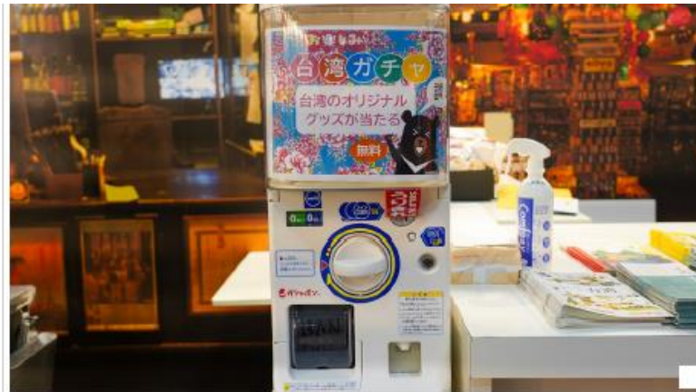
台湾ガチャのチャレンジタイムはブースでお尋ねを