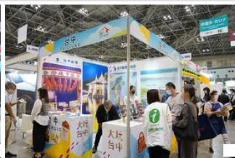
台中市観光旅遊局