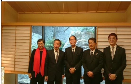
與香川縣前任知事浜田惠造早餐會