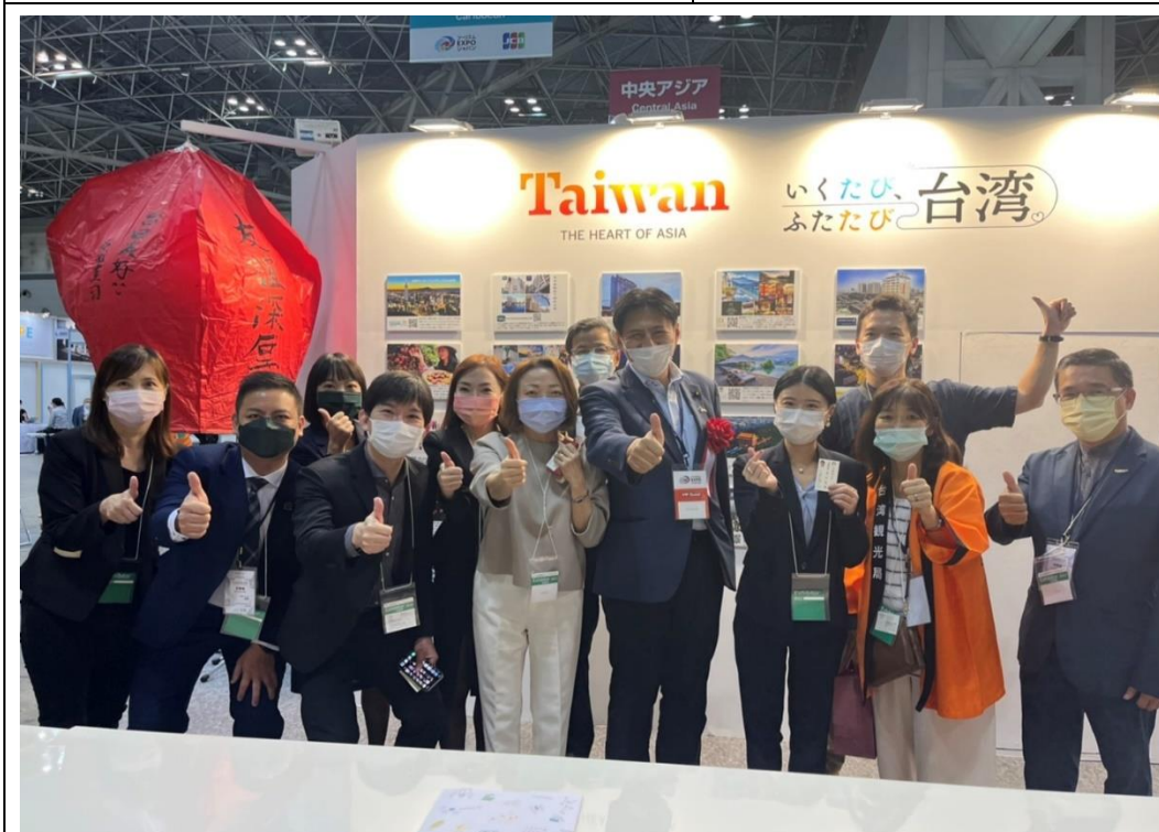
日本外務副大臣(相當於外交部次長)武井俊輔眾議員(右五)也蒞臨台灣館參觀