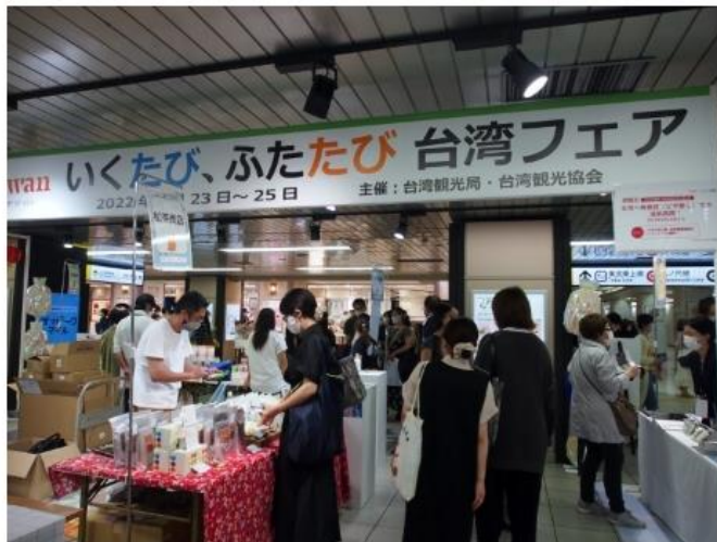
にぎわう観光フェア