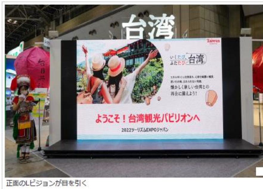
正面のレビジョンが目を引く

4日間通して行なわれているのは、特別企画の台湾スタンプラリー。台湾観光館に用意された8か所のスタンプポイントのうち異なる6種のスタンプを集めるとガチャにチャレンジできるというもの。期間中1000名に台湾のホテル宿泊券やオリジナルグッズがプレゼントされるという。