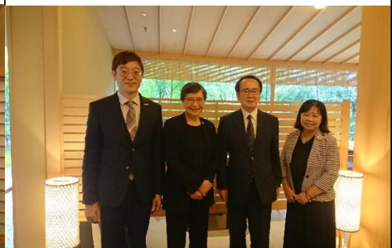
拜會香川縣現任知事池田豐人