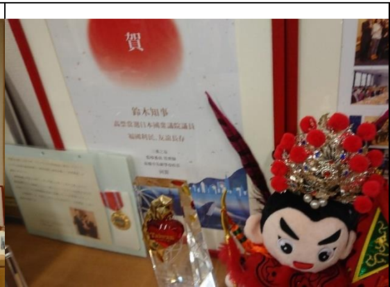
鈴木眾議員桌面常態擺設與台灣相關物件、報導，含 2014 年獲頒「台灣觀光貢獻獎」獎座