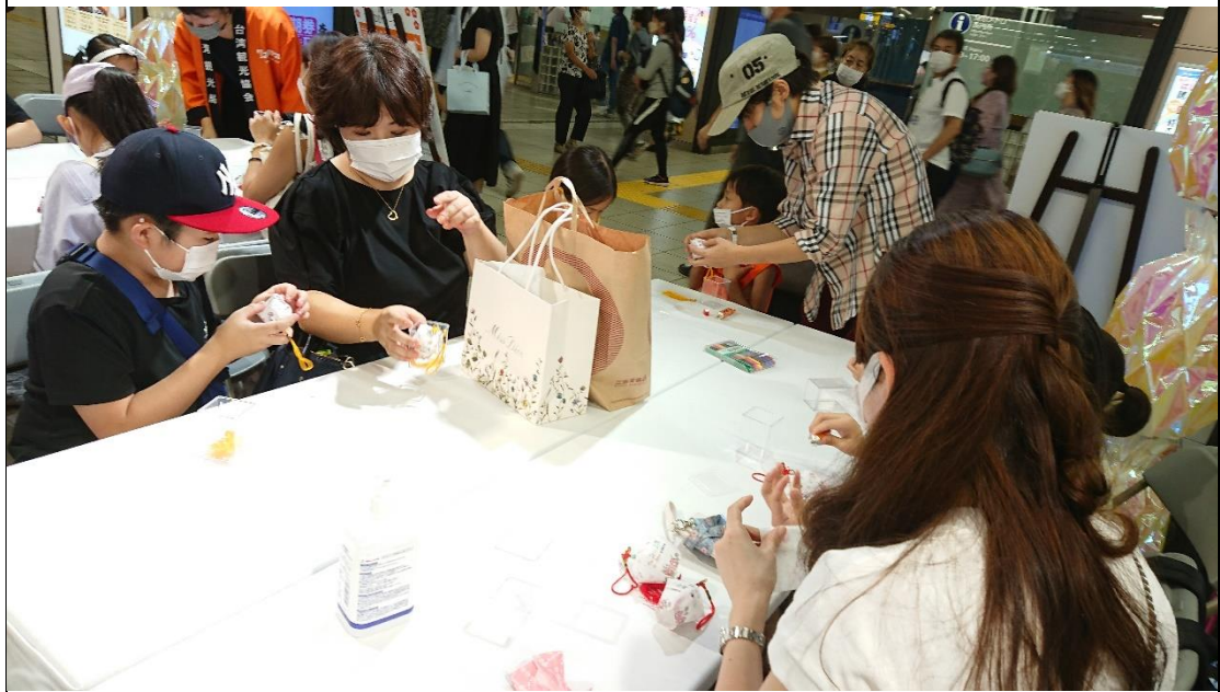
在人潮川流不息的池袋車站辦理台灣觀光 B2C 推廣活動，其中 DIY 手作天燈特別吸引親子駐足