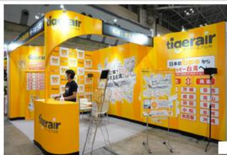
タイガーエア台湾も出展