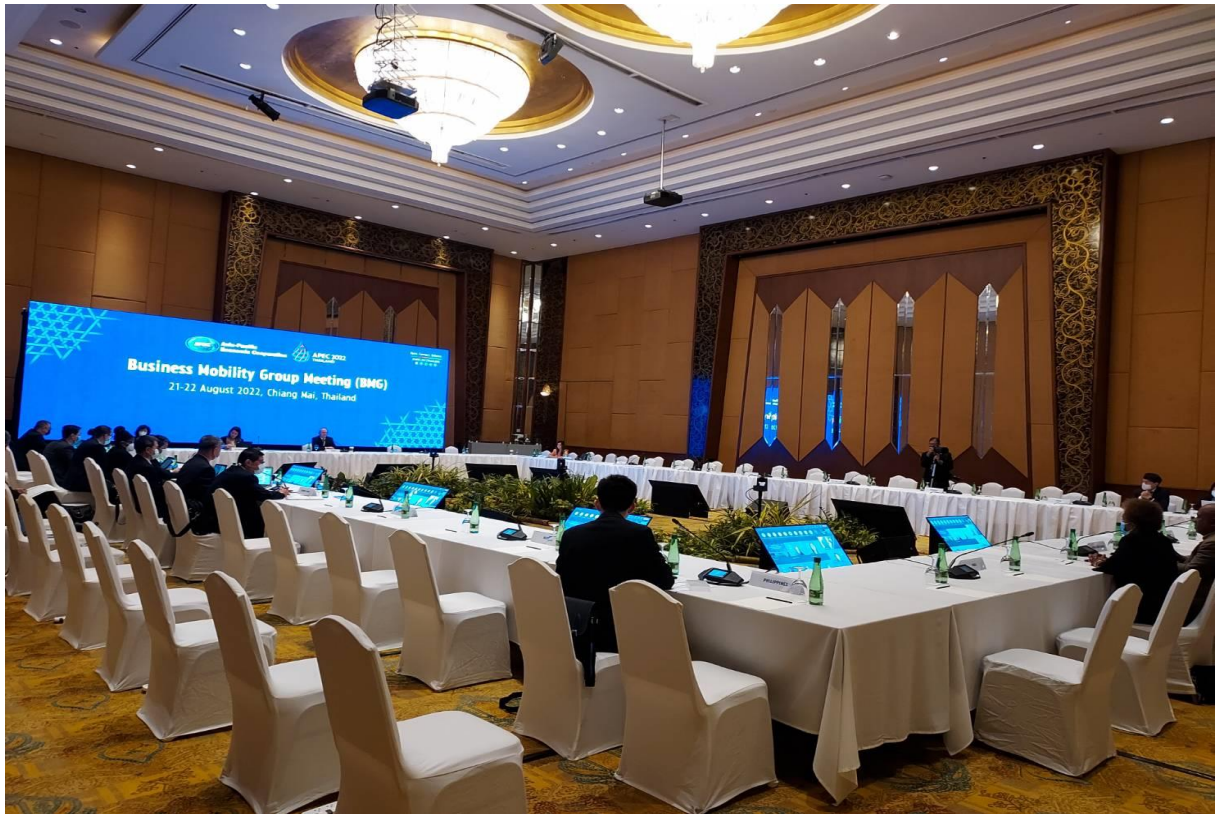
參加 BMG3 實體會議，現場共有九個會員體代表出席