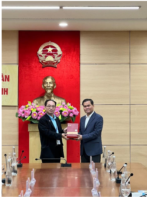
團長與廣寧省副省長合照