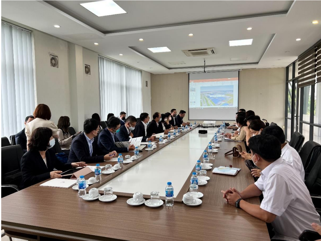
參訪富壽省工業區