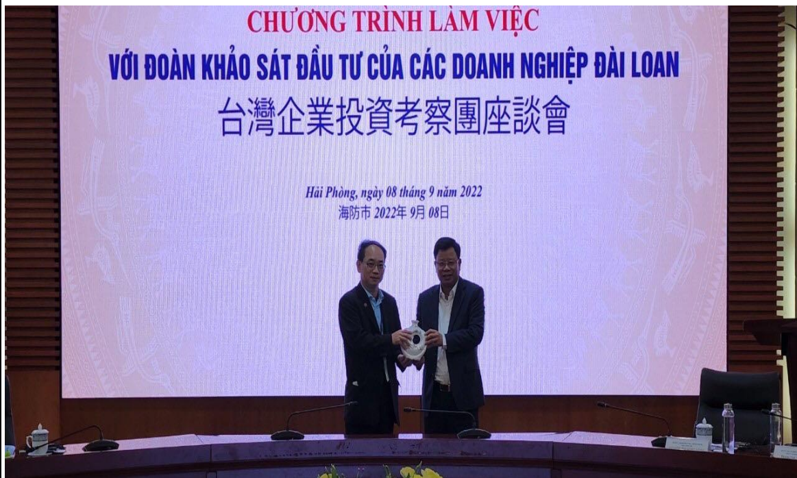
團長與海防市經濟區管理局黎局長合照