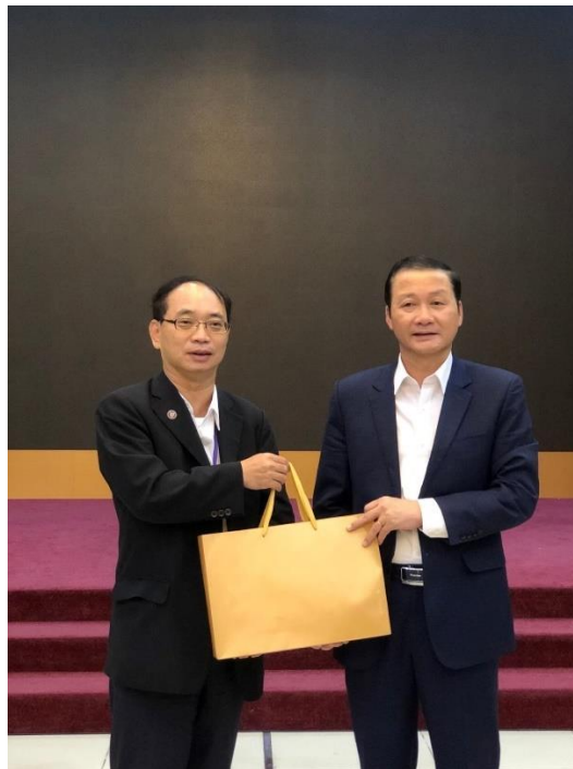
團長與清化省省長合照