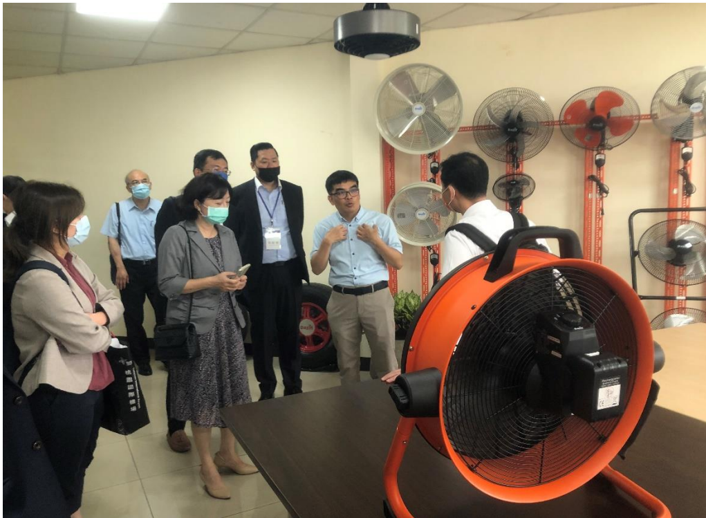
參訪大新責任有限公司