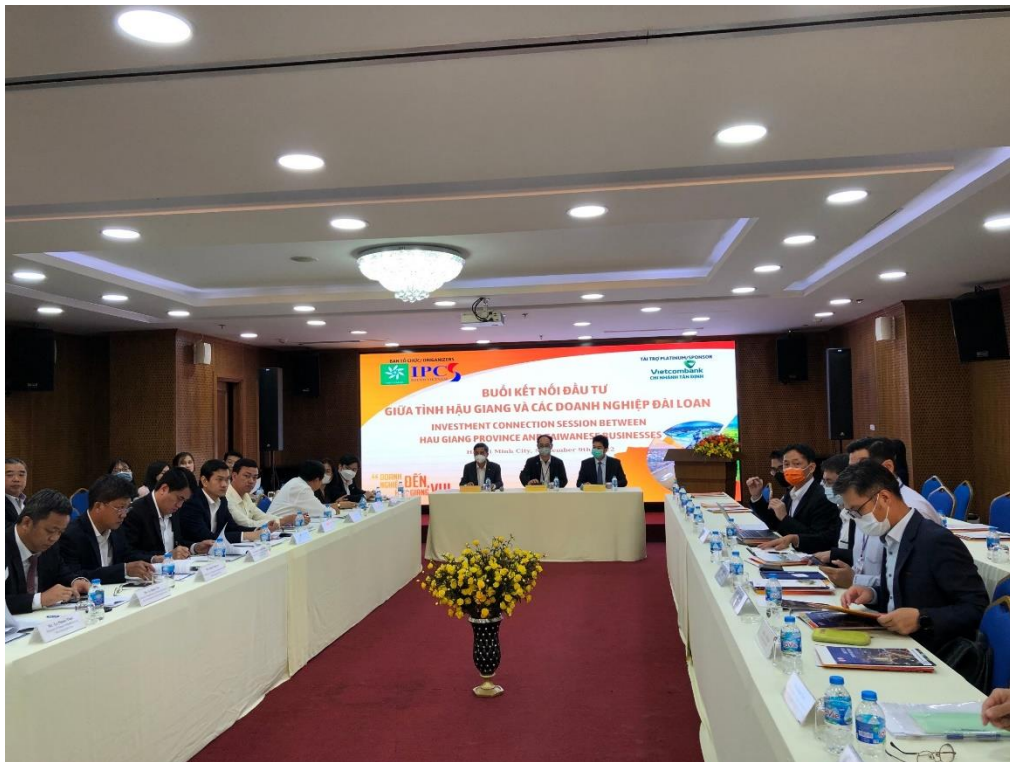
計劃投資部南部投資促進中心(IPCS)投資座談會