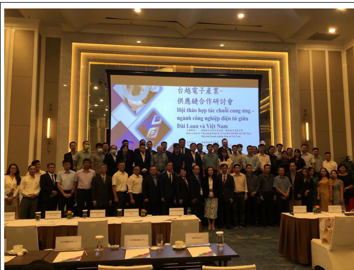
臺越電子產業供應鏈合作研討會