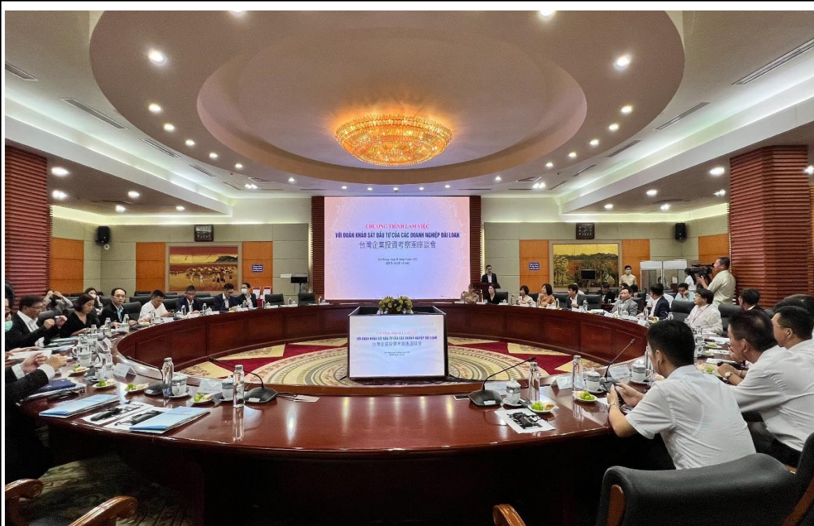
拜會海防市經濟區管理局