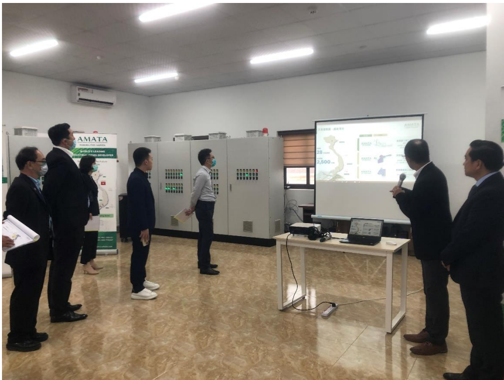
參訪廣寧省工業區