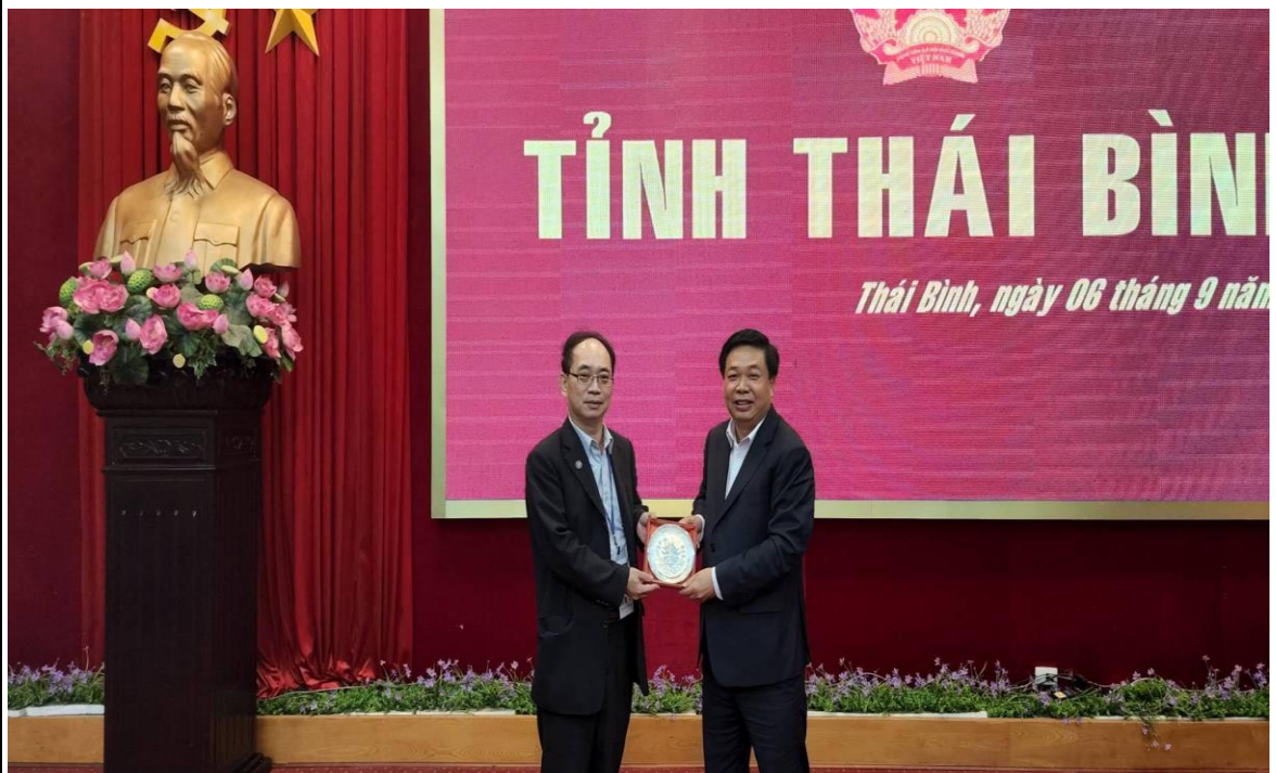
團長與太平省省長合影