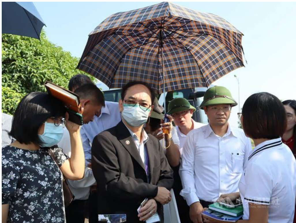
參訪南定省工業區