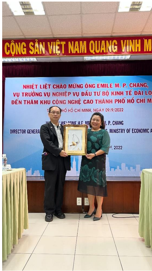
拜會西貢高科技園區