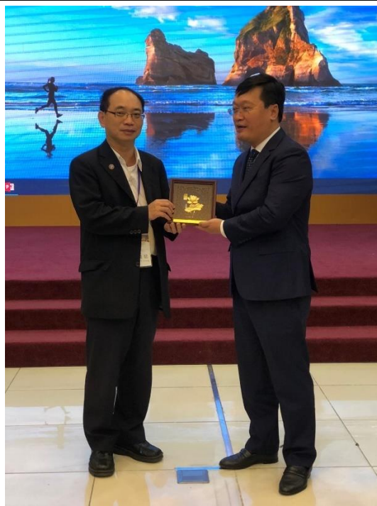
團長與藝安省省長合照