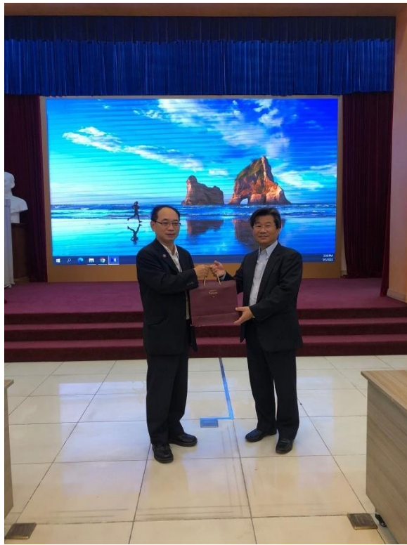
團長與 FIA 杜局長合照