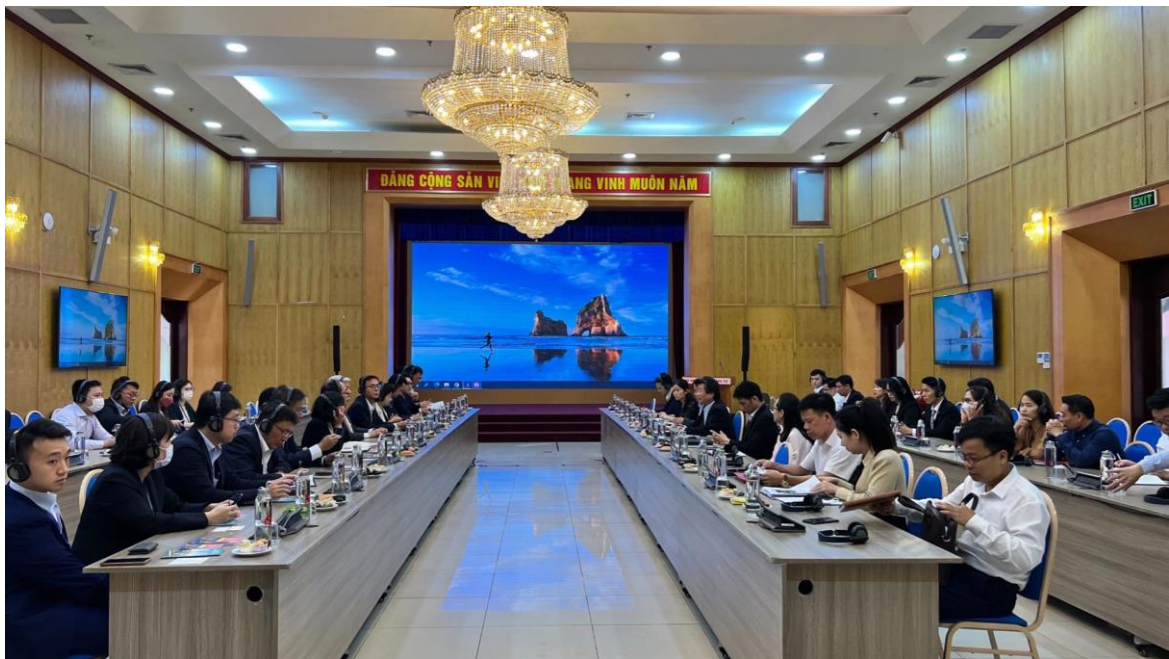
拜會越南計劃投資部外人投資局(FIA)