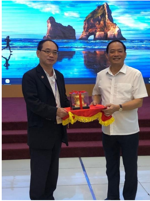
團長與興安省省長合照