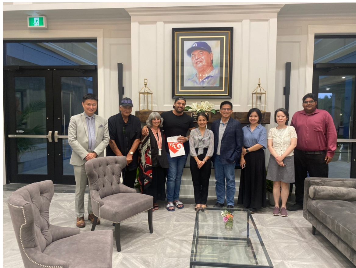
7/4 我團赴尼加拉瀑布考察