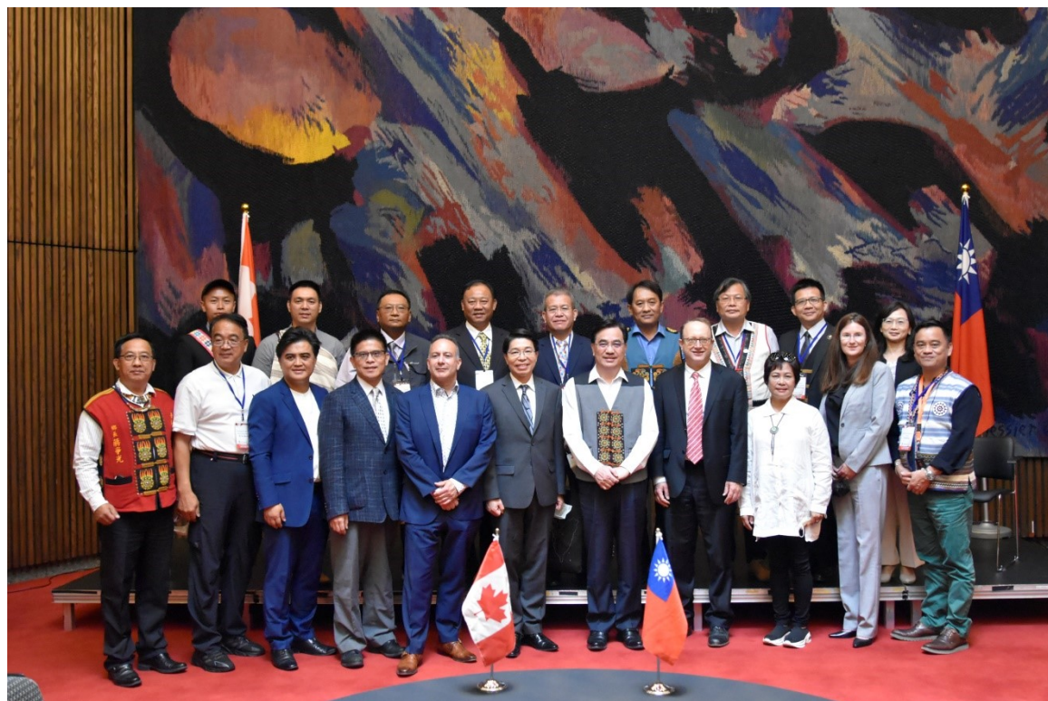
7/5 本會曾專門委員興中與渥太華大學史國良教授分享身分認定政策