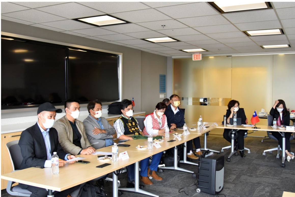
7/7 我團與第一民族稅務委員會座談交流