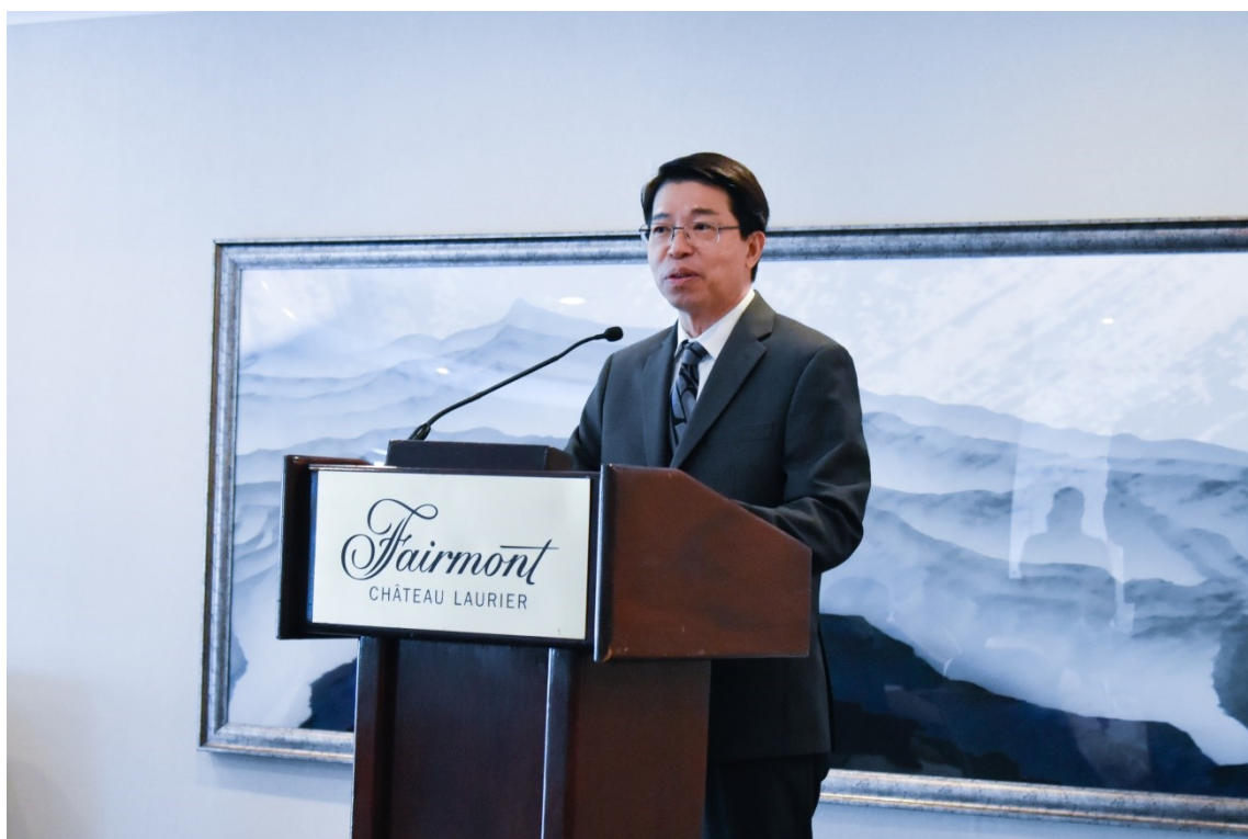
7/5 陳大使文儀於歡迎餐酒會中致詞