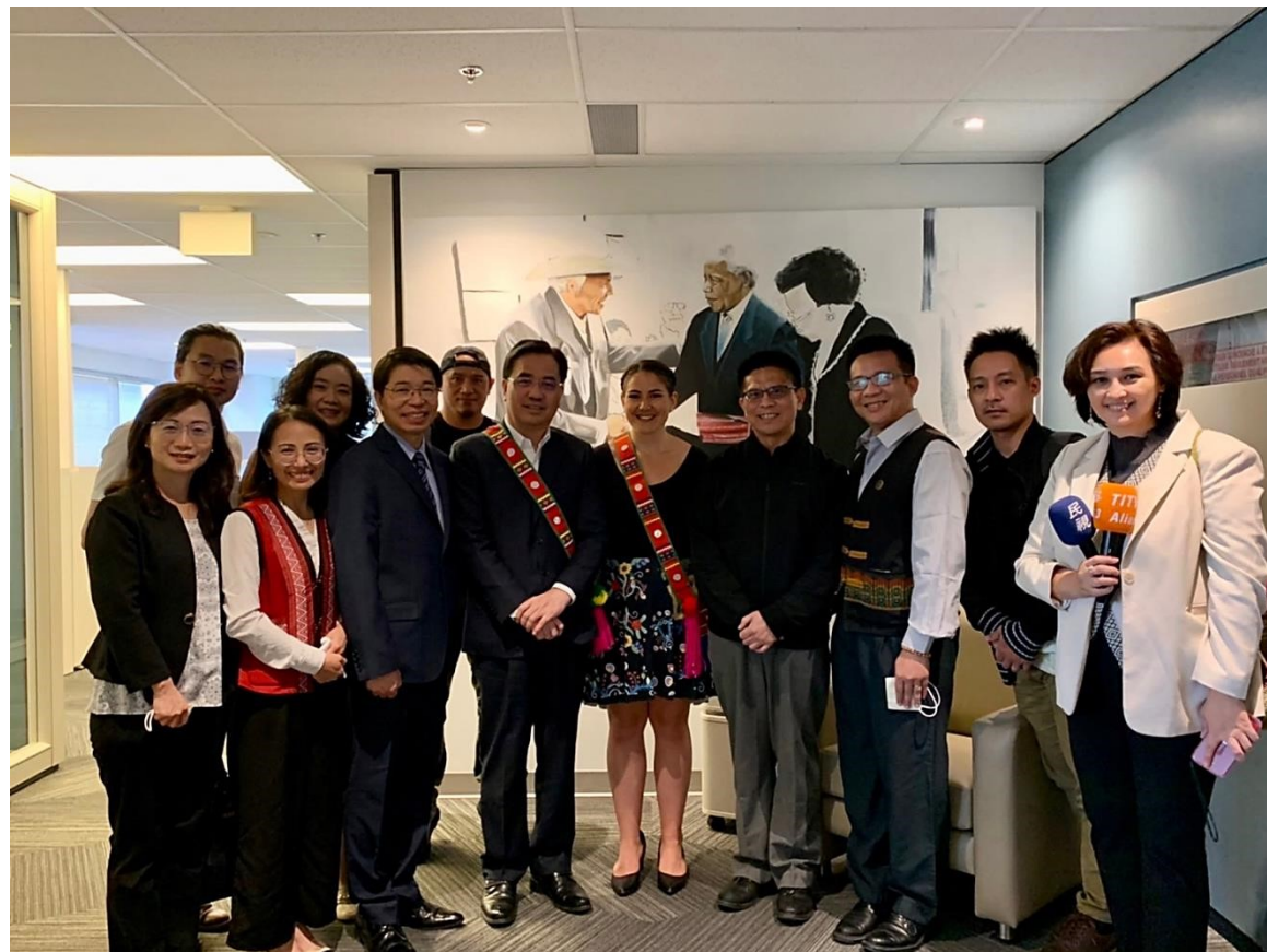
7/6 我團團員與梅蒂斯全國理事會主席 Cassidy Caron 交流