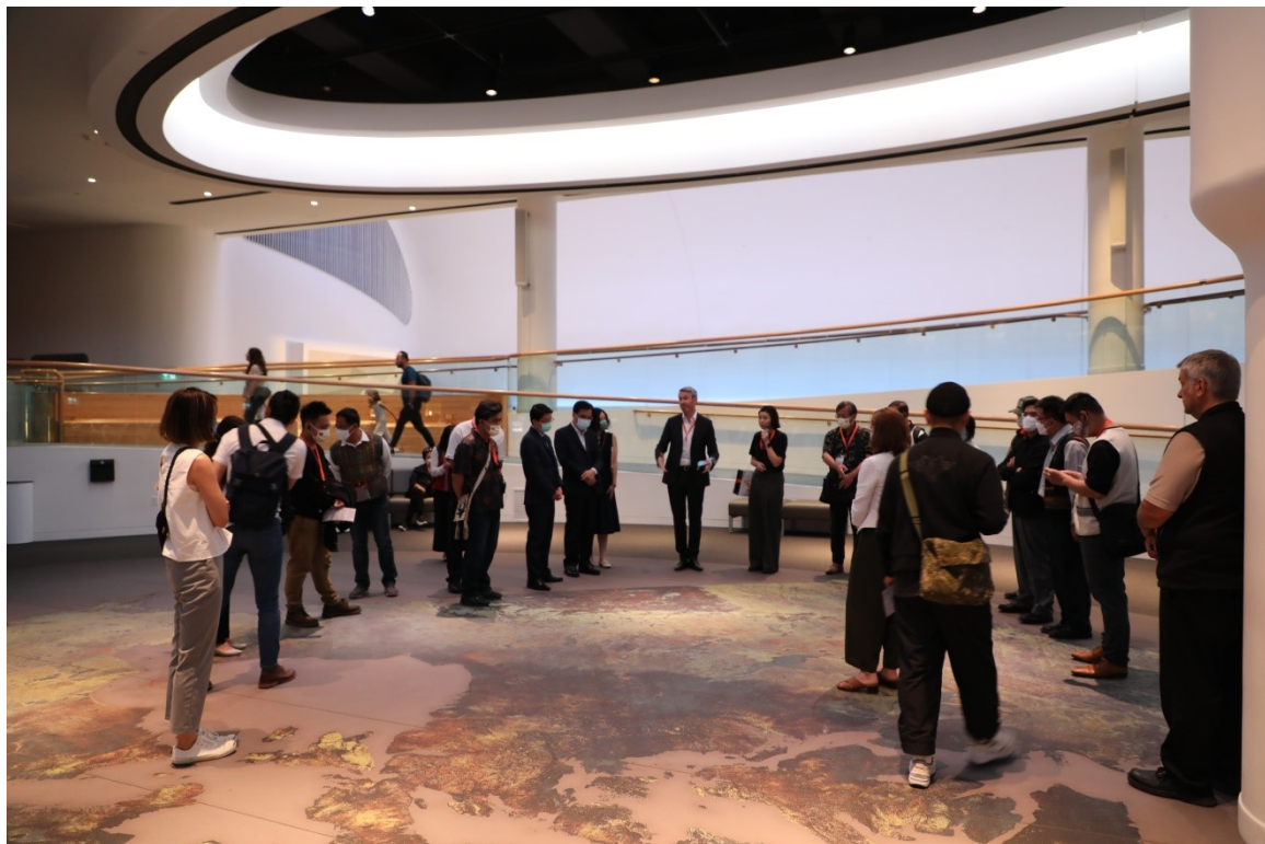
7/6 加拿大國家歷史博物館代理館長致贈書籍予主委