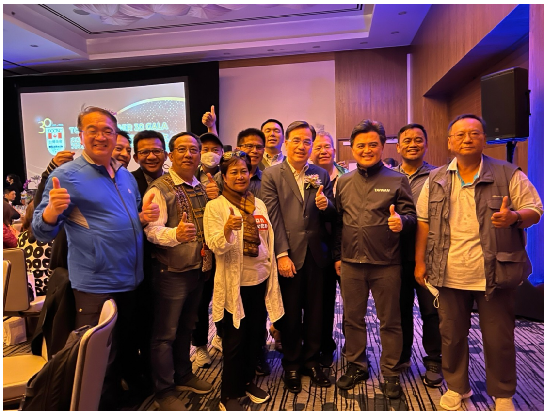
7/8 我團出席卑詩省台灣商會三十週年晚宴合影(2)