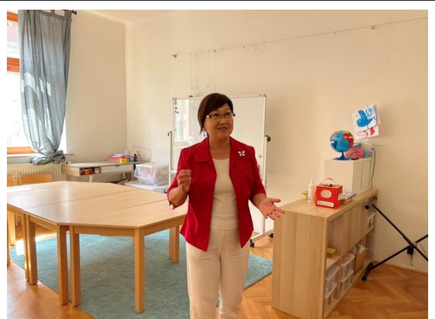
參訪捷克布拉格繁中學校