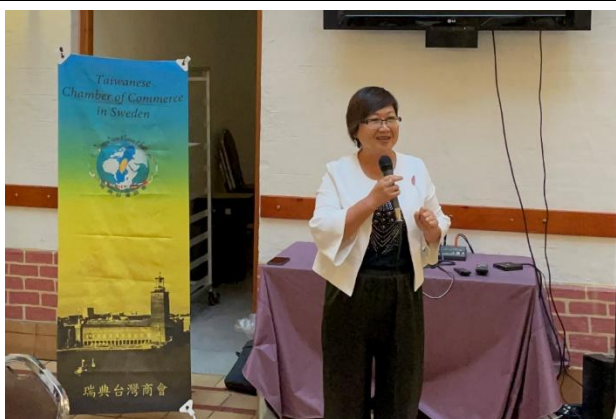
出席瑞典地區僑臺商座談餐會