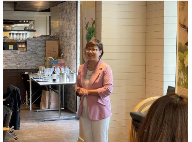
出席瑞士僑務座談餐會致詞