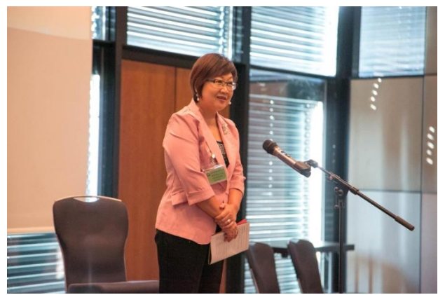
出席歐臺協會第 51 屆年會致詞