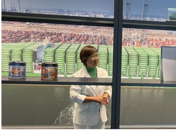
參訪長榮海運歐洲分公司