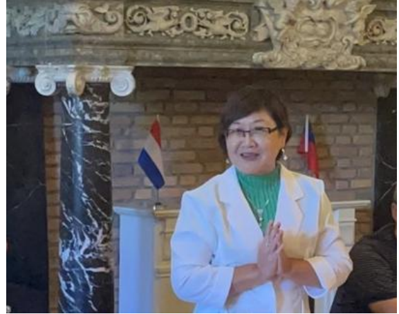
主持荷蘭地區僑務工作座談會