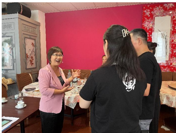
參訪臺灣華語文學習中心-奧地利中華僑校