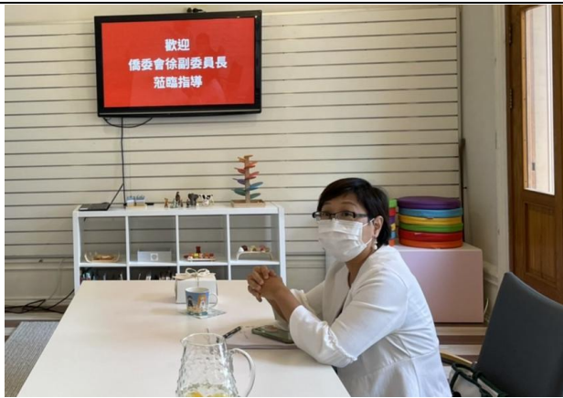
參訪瑞典臺灣華語文學習中心-Tizzy 的中文樂教室