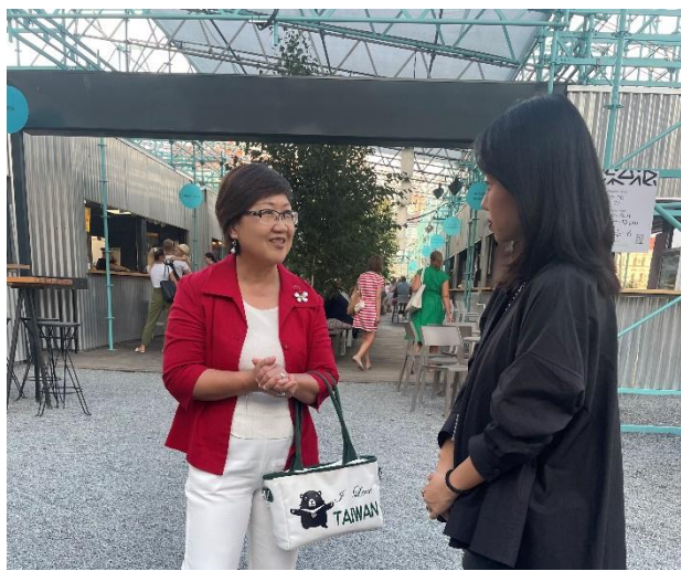
參訪企業 Manifesto Market