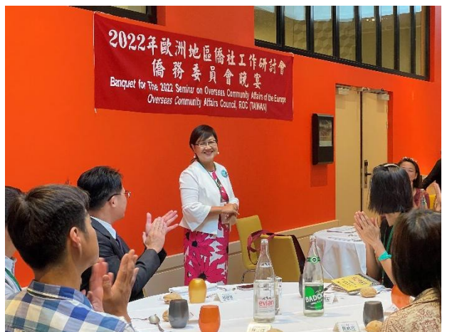
主持 2022 年歐洲地區僑社工作研討會歡迎晚宴