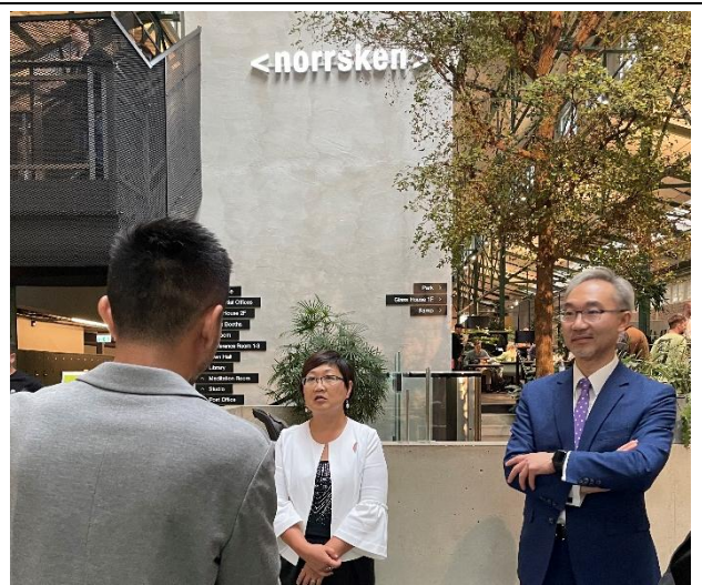
參訪瑞典非營利組織 Norrskan Foundation