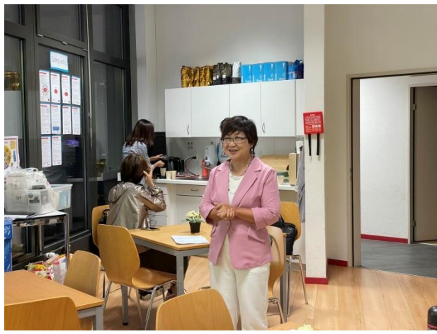
參訪瑞士蘇黎世中文學校