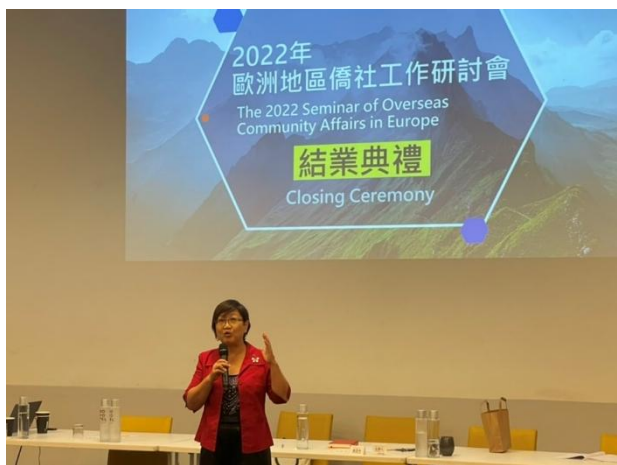
主持 2022 年歐洲地區僑社工作研討會結業式