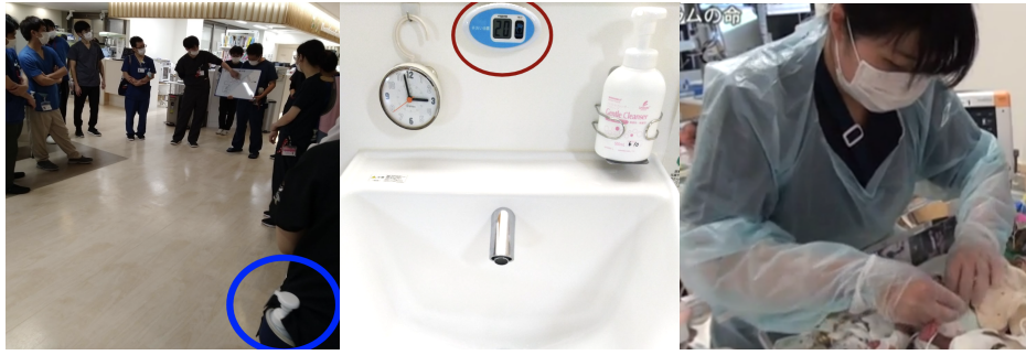
圖四、單位中感染控制執行之眾多細節與面向