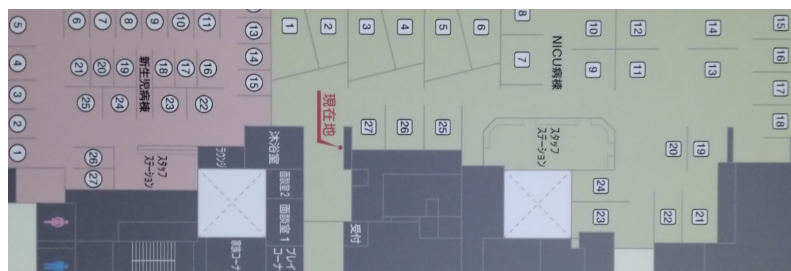
圖二、神奈川縣立兒童醫療中心新生兒病房配置，綠區為新生兒加護病房，紅區為新生兒後續照護病房

神奈川縣立兒童醫療中心(後文簡稱為當院)為縣立三級週產期醫療中心，其新生兒加護病房的規模為全國第三大，收治了許多極度早產兒與其他醫學中心轉診而來的困難新生兒個案。新生兒加護病房(Neonatal Intensive Care Unit, NICU)總床數為二十七床，新生兒後續照護病房(Growth Care Unit)總床數亦為二十七床，每年照顧的極度早產兒數量約為九十名，規模與本院新生兒加護病房相仿。除了週產期醫療中心之外，神奈川縣立兒童醫療中心也是一個綜合型的兒童醫院，因此除了兒童內科之外，兒童相關科別例如小兒外科、小兒骨科、小兒眼科等等一應俱全，提供給當地的兒童最完善的醫療。