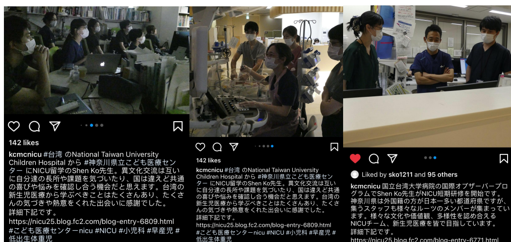
圖五、指導教授非常友好的在官方社群網站介紹臺灣與臺大醫院，協助紀錄我這一個月的臨床學習過程，並讓我有機會分享臺灣的照護經驗給團隊

二、近年來因為疫情暫停很多國際活動，此次在日本疫情趨緩的空檔中很幸運獲得前往見習的機會，在日本也收到了非常友善的對待與豐富的交流機會。熱情的團隊除了幫助我完成此次的學習目標－極度早產新生兒優化神經預後照護－之外，還和我分享了許多其他新生兒常見疾病的照顧經驗、討論研修醫師期間遇到的新生兒科疑難雜症以及展示當院自豪的家族中心照顧（family-centered care），希望我們單位未來也可以帶給他人這樣的見習經驗與溫暖（圖五）。