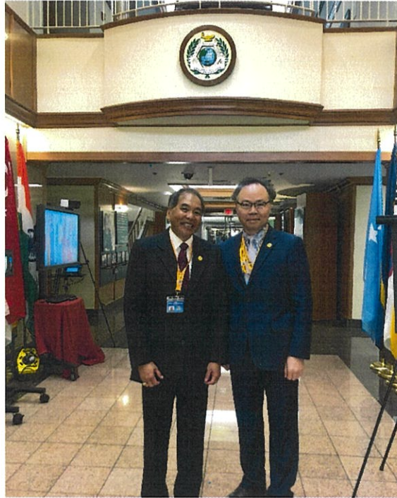
與 APCSS 主任 Pete Gumataotao 將軍合影