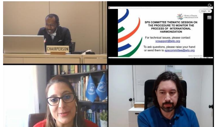
圖 2、監督國際調和程序主題會議情形。