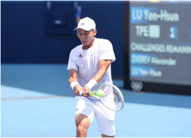
圖 13：網球選手盧彥勳比賽情形