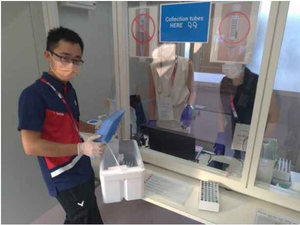
圖 55：助理防疫協調官繳交代表團唾液 瓶至採檢處進行快篩 1