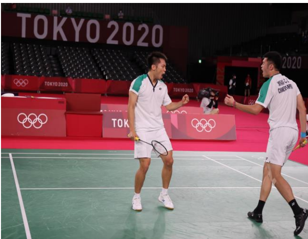
圖 33：羽球選手李洋(左)、王齊麟(右)比賽情形