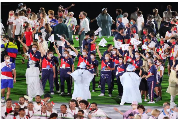
圖 65：中華隊參加閉幕情形