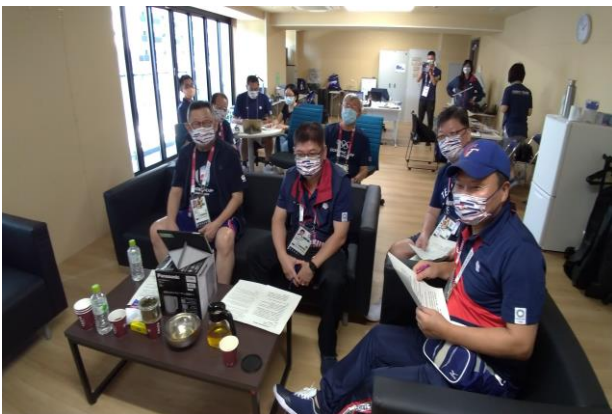
圖 59：防疫應變小組東京端與國內端召 開防疫應變小組會前會