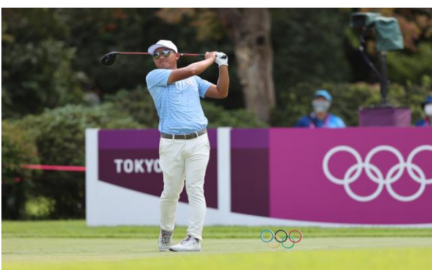
圖 41：高爾夫選手潘政琮比賽情形