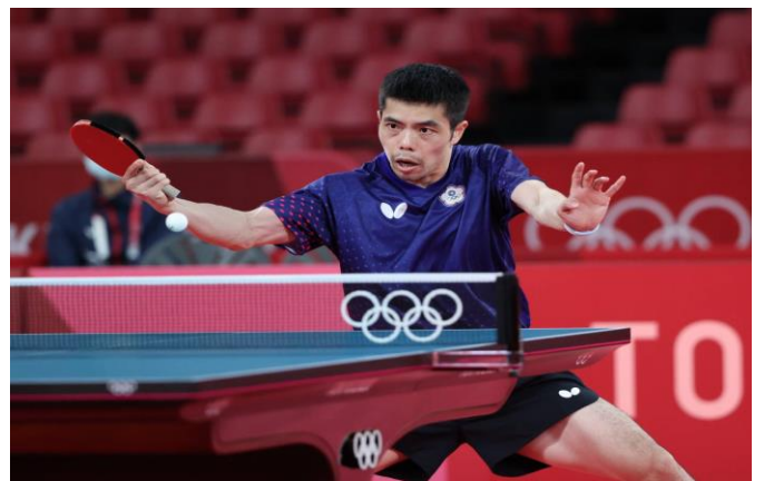
圖 18：桌球選手莊智淵比賽情形