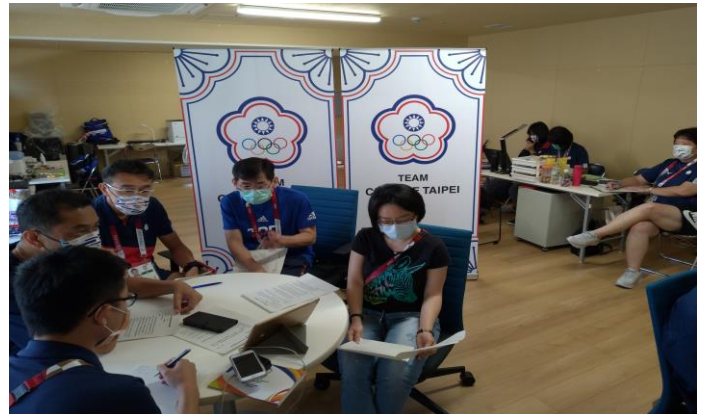
圖 60：防疫應變小組東京端與國內端召開防 視訊會議