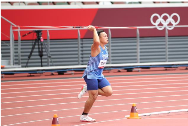
圖 47：田徑選手鄭兆村比賽情形