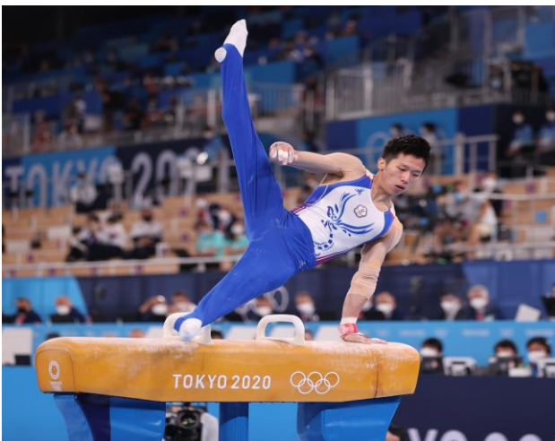
圖 39：體操選手李智凱比賽情形