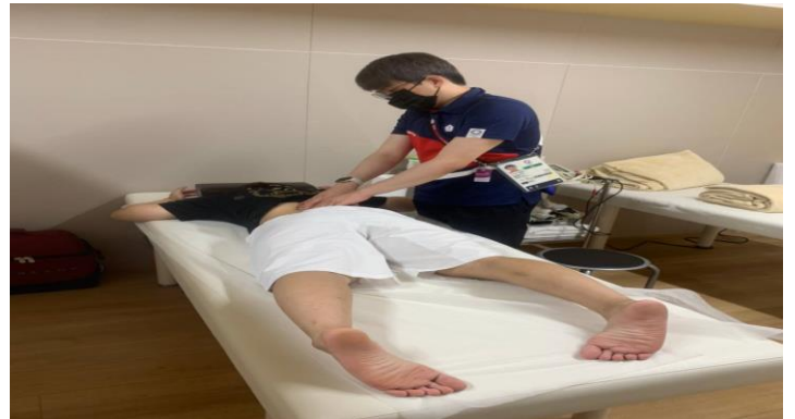
圖 58：物理治療師於團本部醫護室照顧選手