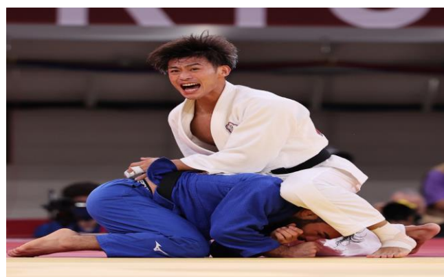
圖 4：柔道選手楊勇緯比賽情形