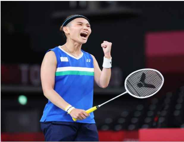
圖 37：羽球選手戴資穎比賽情形