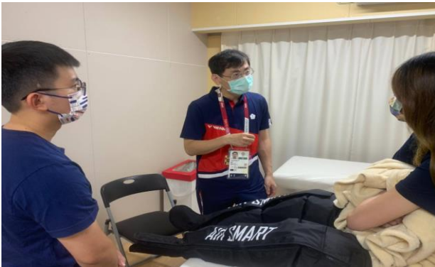
圖 57：隊醫於團本部醫護室照顧選手