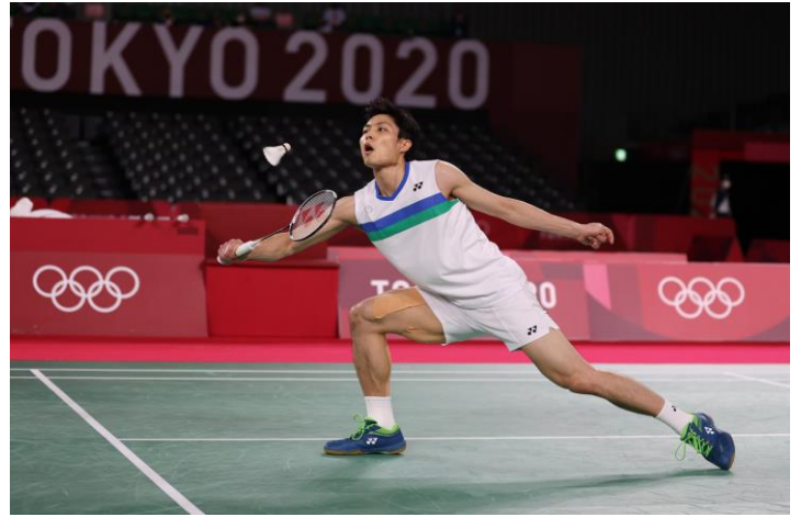
圖 32：羽球選手周天成比賽情形