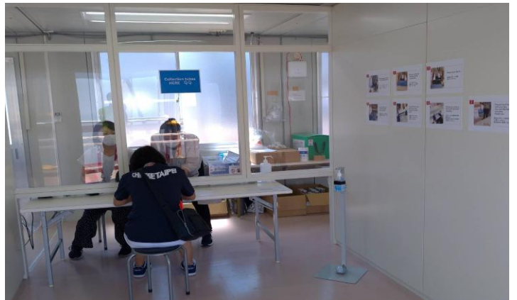
圖 54：選手村進行唾液快篩作業 2