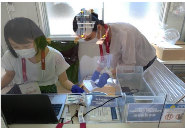
圖 53：選手村進行唾液快篩作業 1