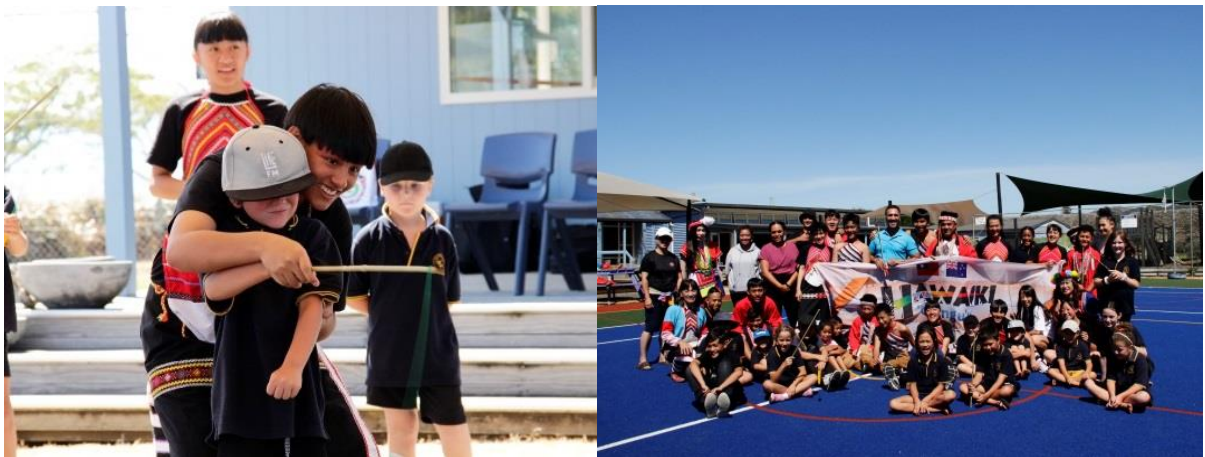
圖：鄒族山美部落青少年帶領 kaiaua school 學生學習風笛及與師生合照。

鄒族山美部落青少年代表團分享傳統歌舞，並贈送象徵鄒族傳統傳遞信息的「風笛」予校內師生，讓小學生初體驗臺灣原住民族文化，雙方留下美好的回憶。