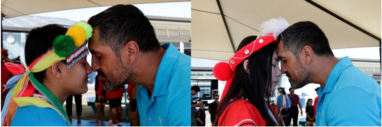
圖：Kaiaua School 校長以 Hongi 接待我團

間的關係在這裡即像是家庭一樣，融合毛利族人及其他不同族群的文化，並有部分時段採以全校共同上課之教學方式，於交流過程中可見校園師生感情融洽。