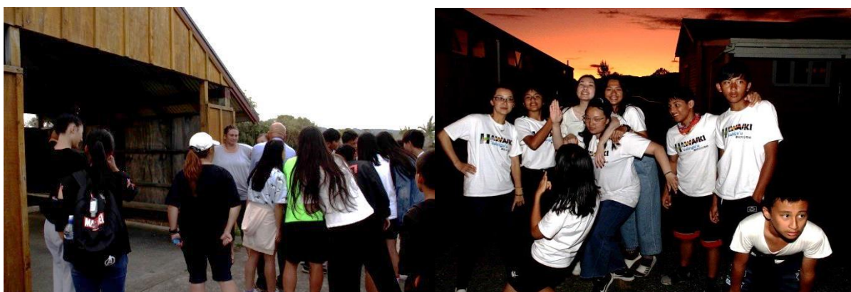
圖：進入 Ngāti Pāoa 部落前、晚間自由活動。

造訪 Ngāti Pāoa 部落，因車程延誤未能於原定時間抵達，故該部落以簡易 Pōwhiri 迎賓儀式迎接我團。另原定傍晚前往 Miranda hot pools 溫泉游泳池，惟該池業於 109 年 2 月 4 日起裝修，爰取消行程。晚間團員們自由活動，並入住 Wharekawa Marae。