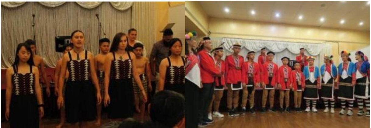
圖：紐西蘭毛利族青少年及臺灣鄒族部落代表團青少年傳統歌舞展演

兩族青少年透過雙方傳統歌舞展現與小遊戲建立起彼此的情誼，我團也以部落有趣、活潑的傳統歌謠邀請現場來賓一同唱跳，現場氣氛相當熱絡且愉快。