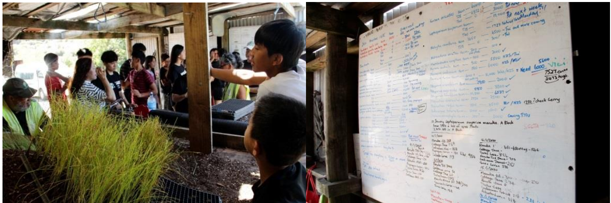
圖：參訪植物保護所及各類植物紀錄表

為讓我團瞭解紐西蘭的環境生態，紐方臨時安排我團前往當地原生植物保護所，經由毛利族人的介紹得知，他們會將原生植物的種子進行保存，並定期進行原生植物的統計，每季按植物的生長週期進行栽種，避免原生植物絕種。