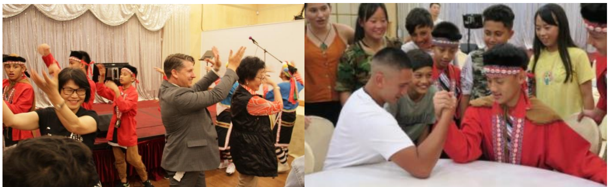
圖：透過鄒族傳統歌謠與小遊戲與貴賓、紐西蘭毛利族青少年進行互動