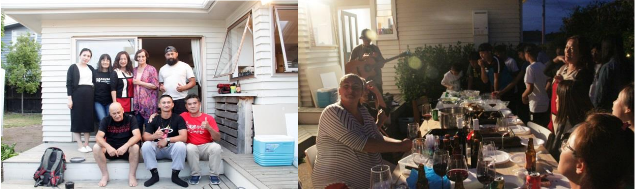
圖：我團至 H 公司 Mararaia 共同負責人家中。

晚間，由 H 公司 Mararaia 共同負責人，邀請我團至家中享用 BBQ 晚餐，一同度過最後一個夜晚。