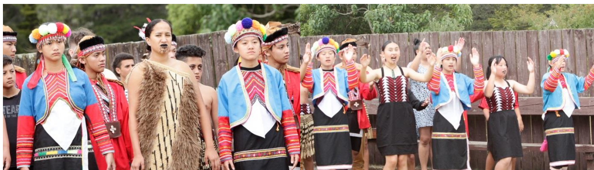
圖：鄒族與毛利族一同進行 Pōwhiri 迎賓儀式

我團本次受邀共同參與所有儀式，與 Ngāti Manu 部落成員一同進行 Pōwhiri 迎賓儀式，並與毛利青少年共同演出前日學習毛利族的歌曲與舞蹈，並於儀式上呈現臺灣鄒族「團結祭」及「Homeyaya 小米祭」等傳統樂舞。