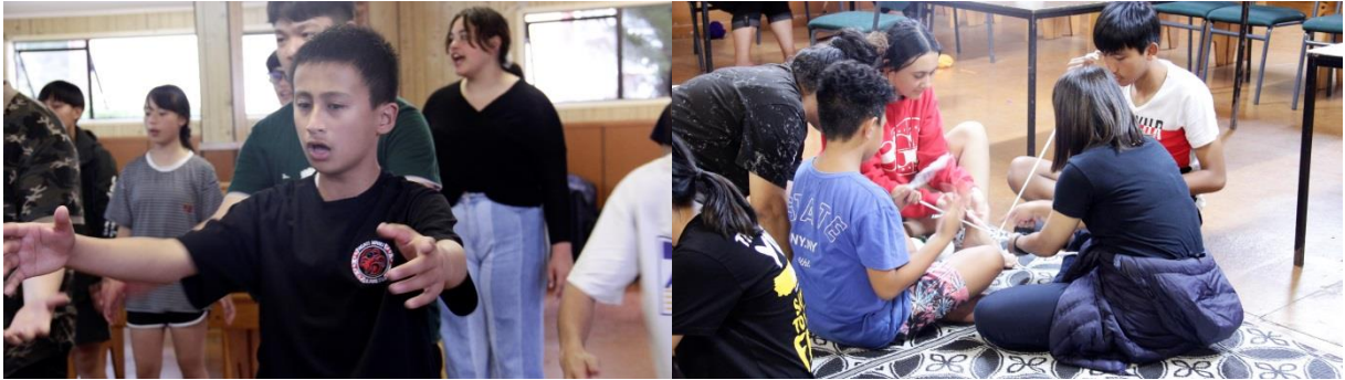
圖：練習 Kapa haka 與製作 poi 球

演出，故於儀式前 1 日積極學習 Kapa Haka 及 Poi(毛利族女性舞蹈，使用附著繩索的圓球進行歌舞擺動)等傳統樂舞。