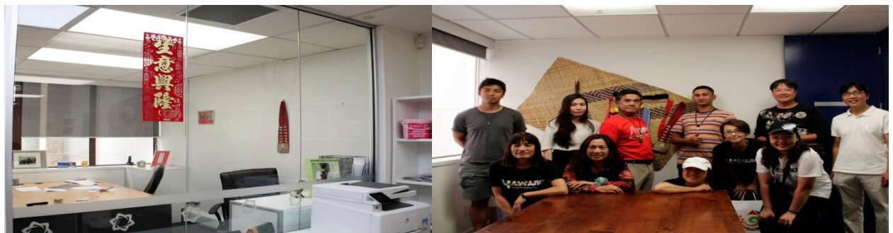
圖：參訪 Hawaiki Nui Ltd. 哈維奇基諾旅遊公司