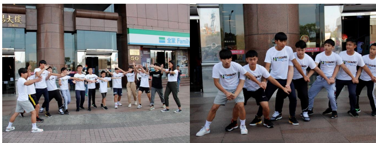
圖：部落青少年代表團於臺北車站前亞洲大樓廣場進行快閃演出

安排鄒族山美青少年部落代表團於臺北車站亞洲大樓廣場前進行快閃活動，以本次與紐西蘭毛利族青少年交流主要之樂舞曲目-鄒族「小米祭組曲」演出，不僅讓路過的民眾們一同感受原住民之美，亦藉此讓團員預演，並增強自信心。