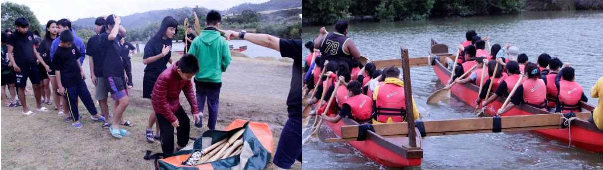
圖：於當地聖河(Taumarere River)划行 Waka 練習船。