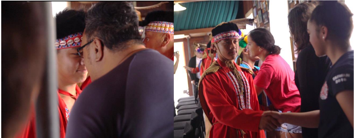
圖：雙方進行 hongigi 儀式

於 Pōwhiri 儀式末，毛利族人也以毛利傳統文化中重要的 hongi(毛利族人以鼻相觸的見面禮)迎接我團，hongigi 係毛利族中相當重要的問候方式，代表雙方互相交換生命與呼吸。