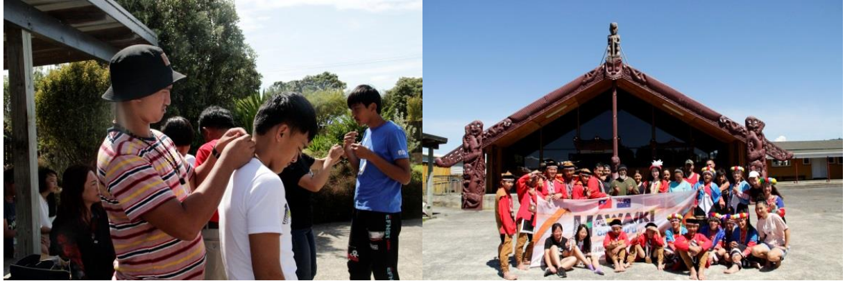
圖：毛利族青少年為鄒族青少年戴上綠石項鍊及合照。