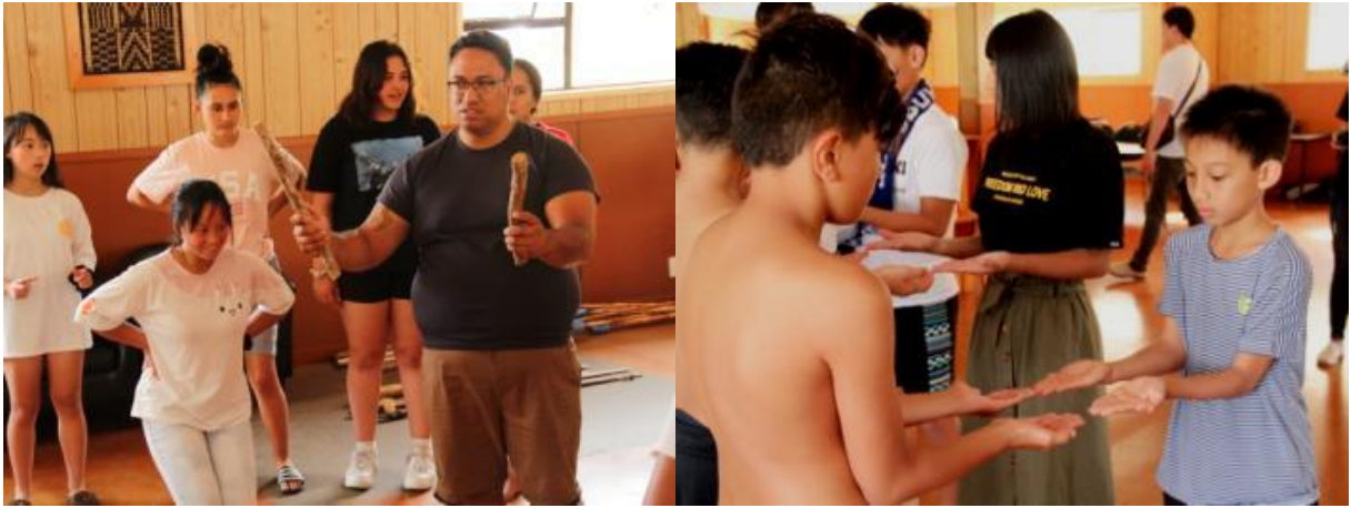
圖：毛利傳統遊戲與團康互動

雙方青少年休閒互動後，Ngāti Manu 部落族人帶領雙方青少年進行團康活動，以進一步認識彼此，並透過傳統遊戲帶入毛利戰舞姿勢的各項意義，讓我團青少年以輕鬆方式學習毛利傳統文化及涵義。