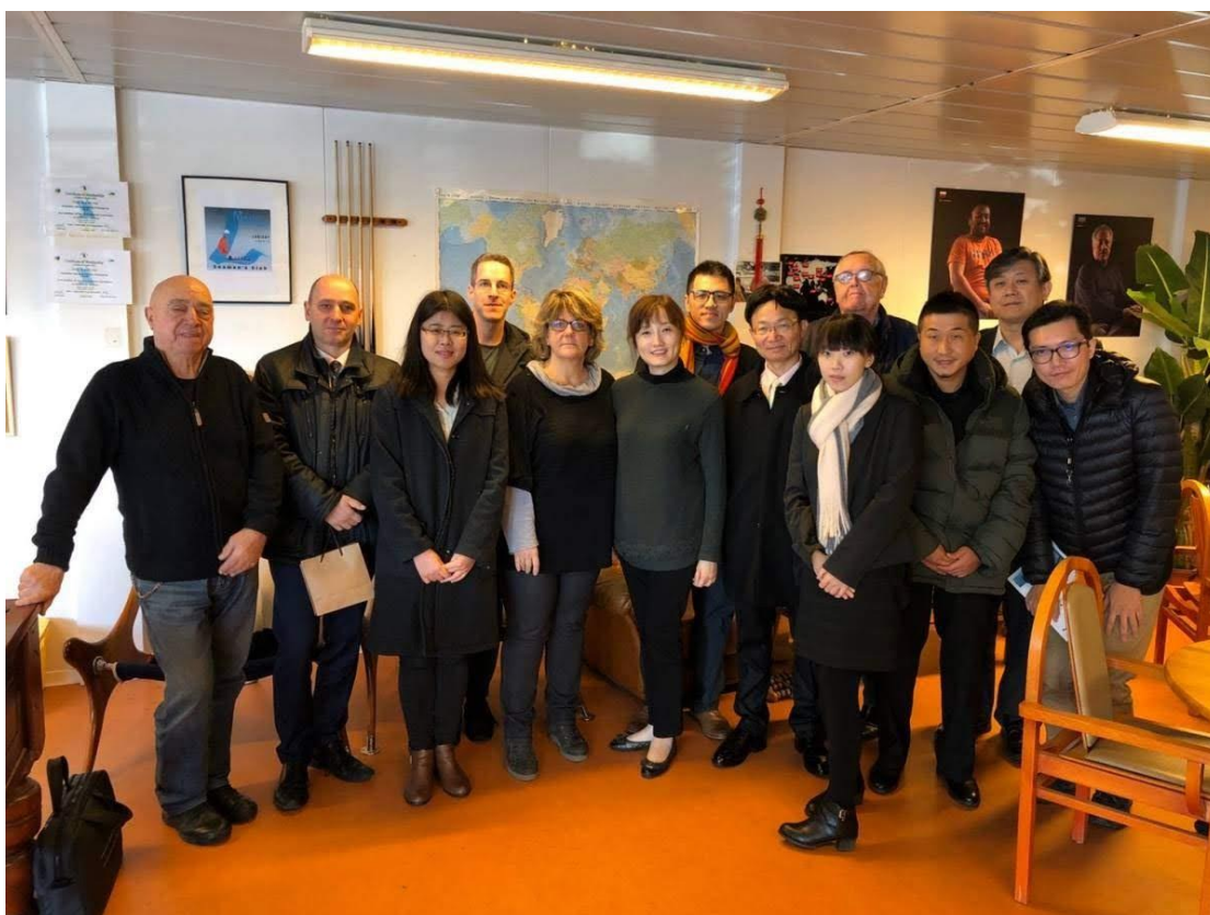
◎於法國洛里昂參與歐盟遠洋漁工系列活動工作坊與臺方長官及歐方人士合影