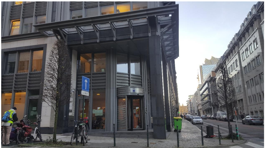
◎布魯塞爾歐盟區街景