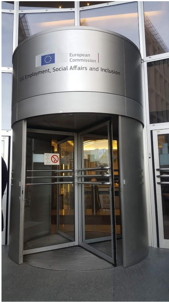
◎就業、社會事務及融合總署(DG-EMPL)大門