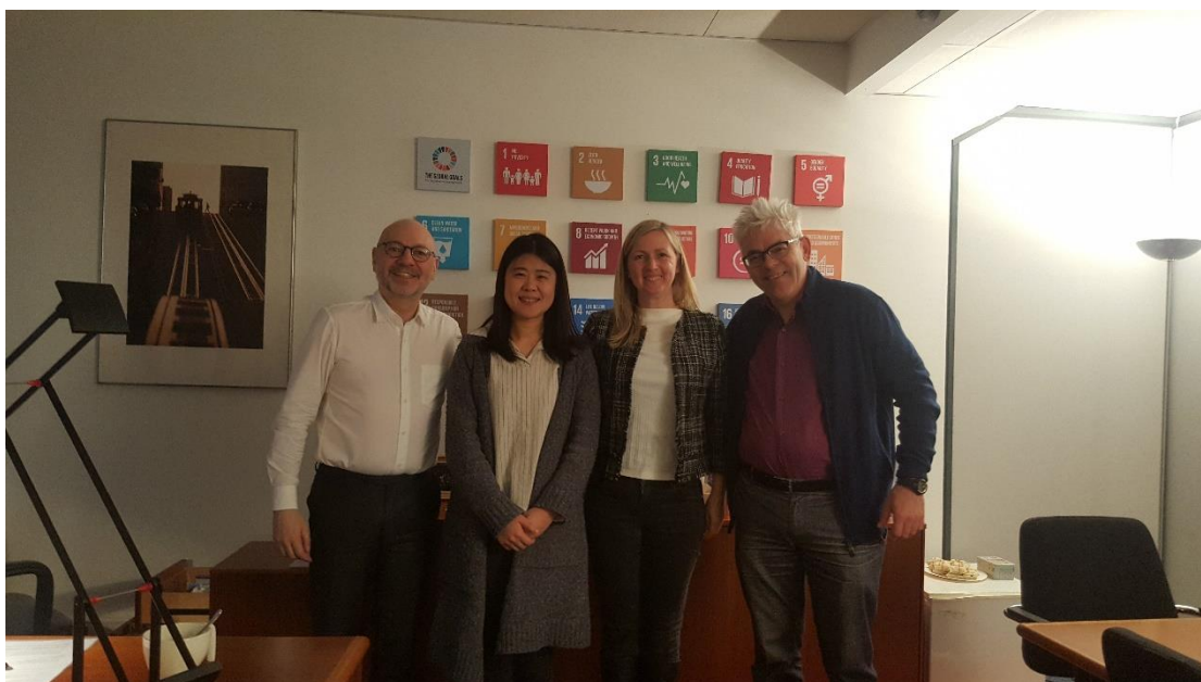
◎與國際事務處處長(左1)、副處長(右1)及處務秘書(右2)合影